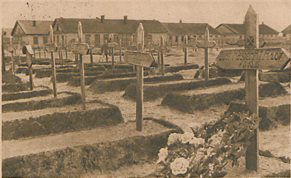
Biala Deutscher Friedhof.