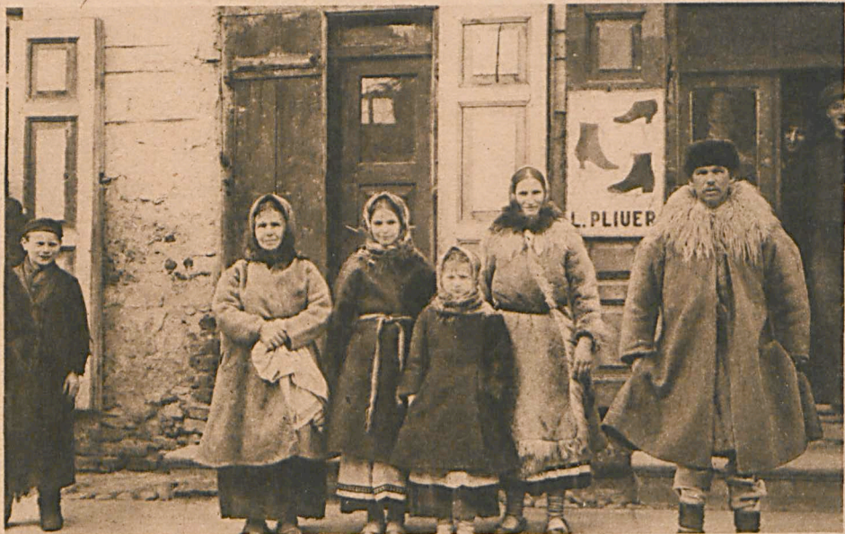
Biala Polen vom Lande.