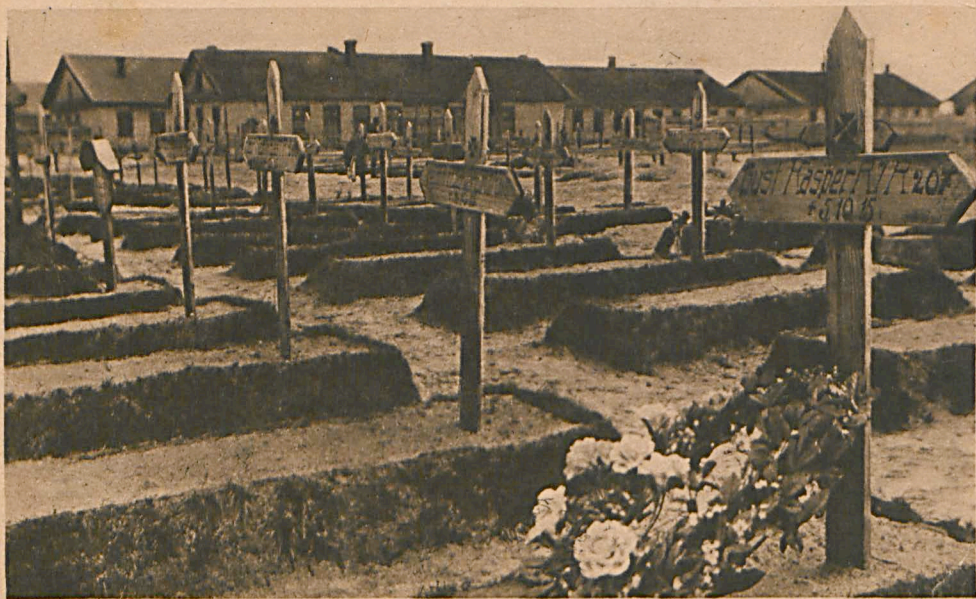
Biala Deutscher Friedhof.