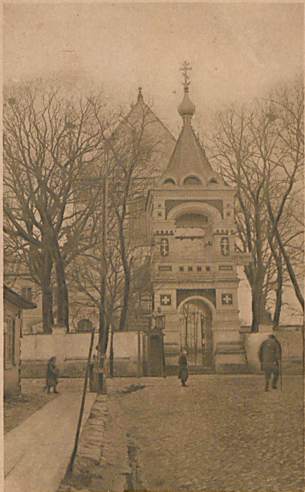
Biala Russische Klosterkirche.