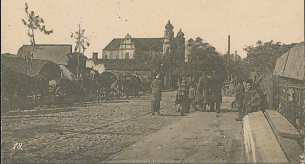
Bresterstraße mit der russischen Kirche in Biala