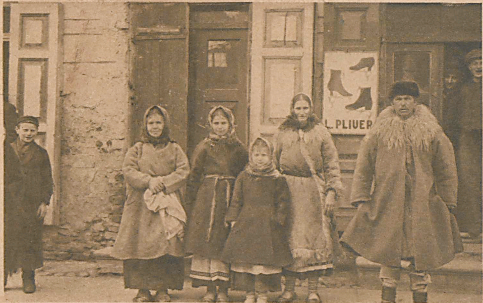
Biala Polen vom Lande.