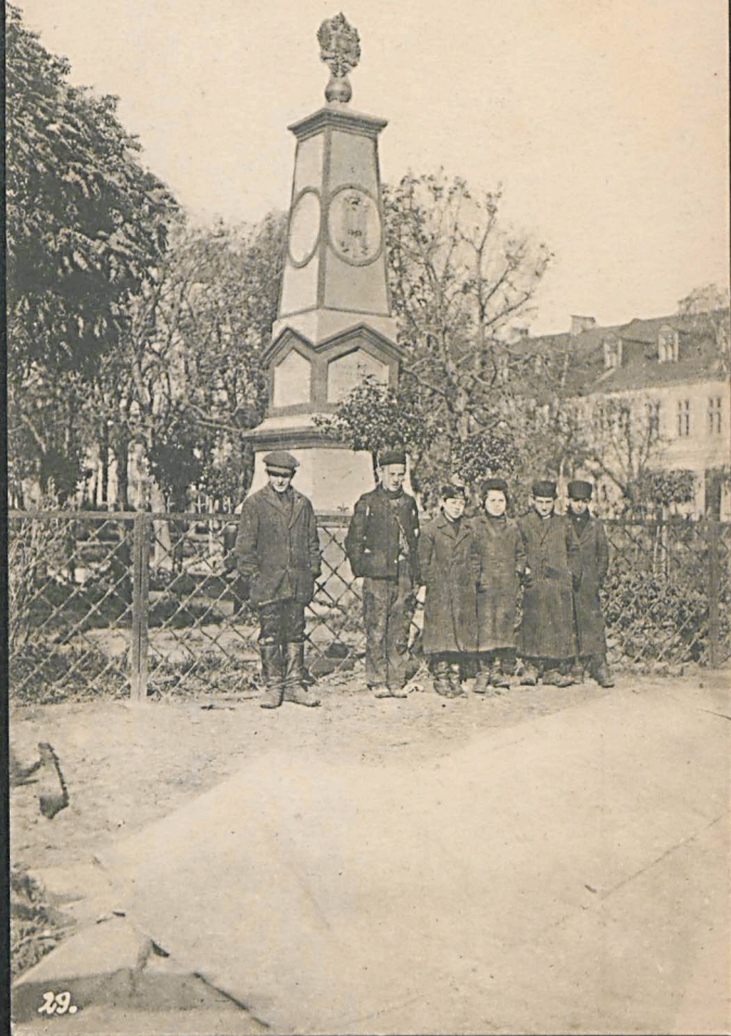
Denkmal der Zwei-Kaiser-Zusammenkunft in Biala