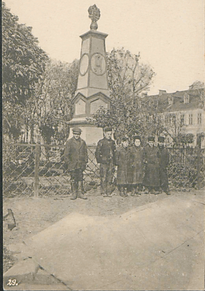
Denkmal der Zwei-Kaiser-Zusammenkunft in Biala