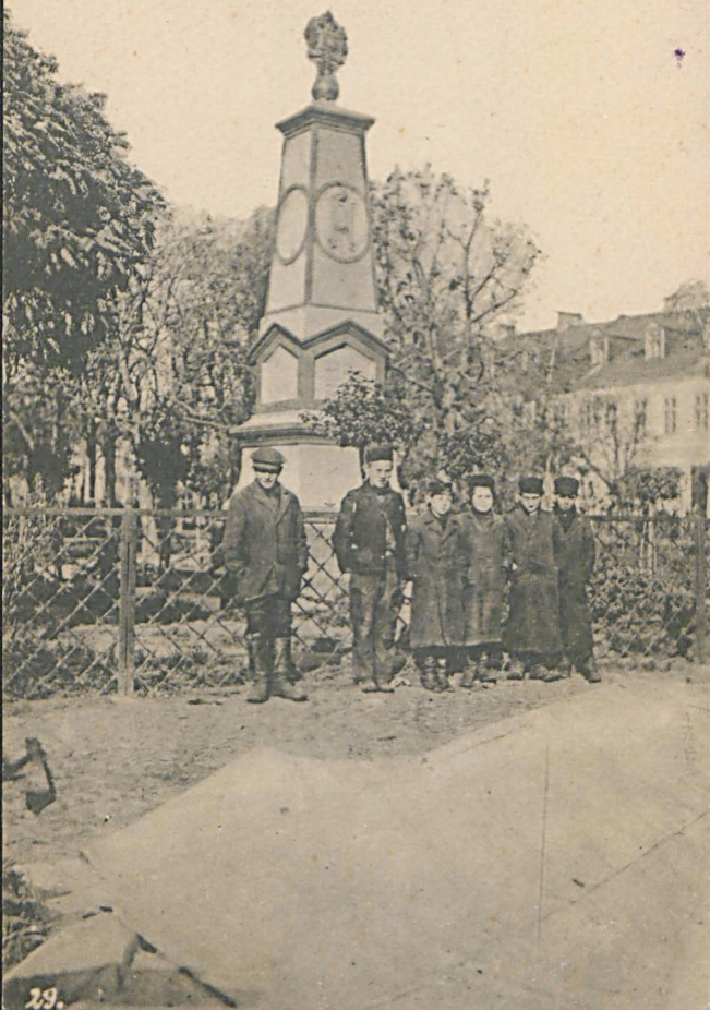
Denkmal der Zwei-Kaiser-Zusammenkunft in Biala