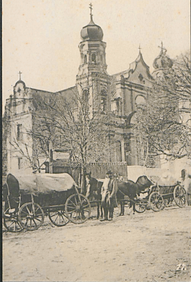
Russische Kirche in Biala