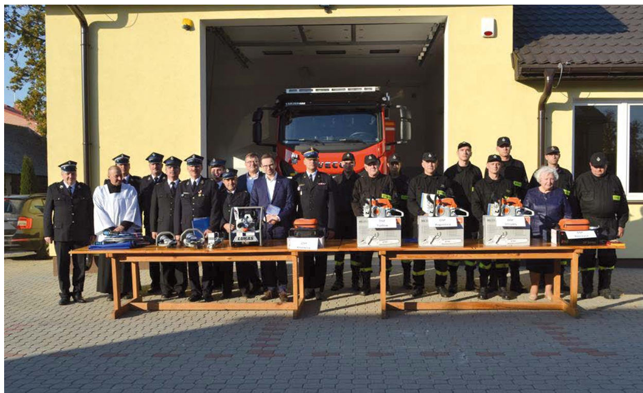
Oficjalne przekazanie sprzętu strażakom