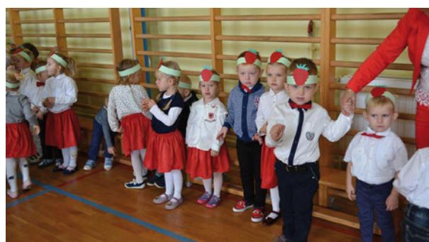
Rzeczyckie przedszkolaki w akcji

na skorzystać ze wsparcia psychologiczno-pedagogicznego, w tym z zajęć z logopedą, psychologiem, pedagogiem, ze wczesnego wspomaganie rozwoju dziecka, terapii ręki oraz logo rytmiki.