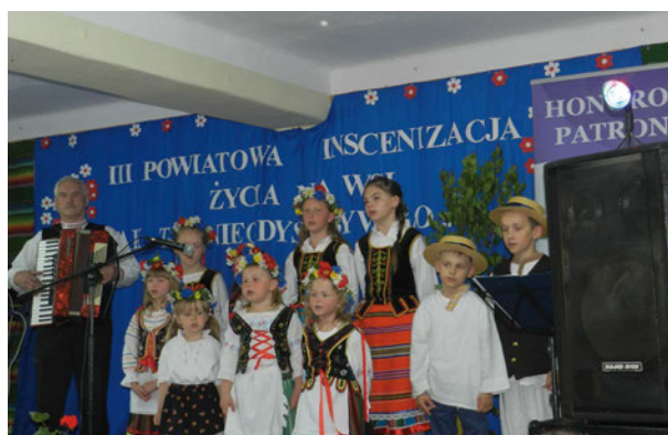
Inscenizacja życia na wsi „Jak to niegdyś bywało...” w Zaściankach – Dziecięcy Zespół Ludowy „Hreczka” z Zaścianek