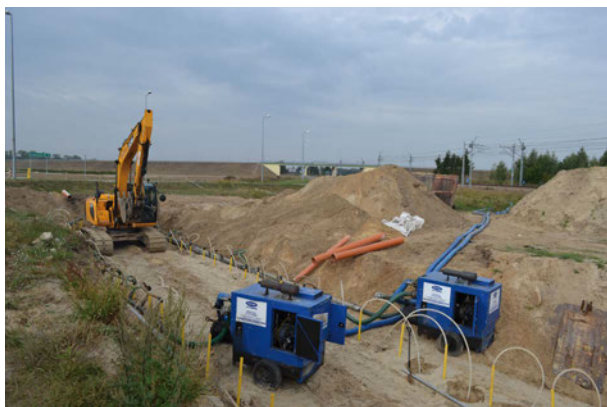
Kanalizacja w trakcie budowy

Dzięki tej inwestycji, mieszkańcy Rzeczyicy będą mogli cieszyć się łącznie prawie 20 km sieci kanalizacji sanitarnej grawitacyjno-tłocznej z przepompniami, co podniesie ich standard codziennego życia. Kanalizacja wspomże eliminację nieprzyjemnych zapachów spowodowanych odprowadzaniem ścieków do szamb i ich przelewaniem się, ukróci preceuder ich nielegalnego przepompowywania oraz zmniejszy ryzyko wpadnięcia do niezabezpieczonego zbiornika - szamba. Budowa kanalizacji sanitarnej przyczyni się ponadto do podniesienia jakości wód powierzchniowych i minimalizacji szkód dla środowiska naturalnego.