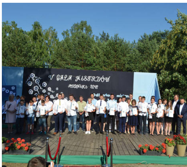
Decoracja zdolnej młodzieży i ich rodziców w pięknym otoczeniu szkoły podstawowej w Rudnikach