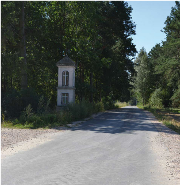
Nowa droga w Jelnicy