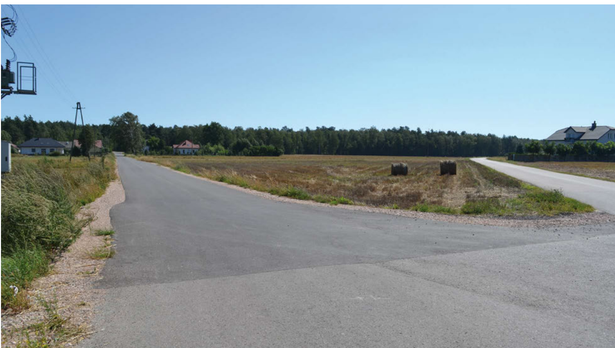
Nawierzchnia asfaltowa w miejscowości Przychody