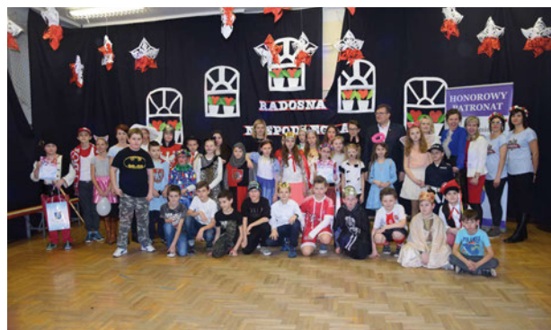
Bal Kostiumowy „Radosna Niepodległa” w Rudnikach 25.01.2018 r.