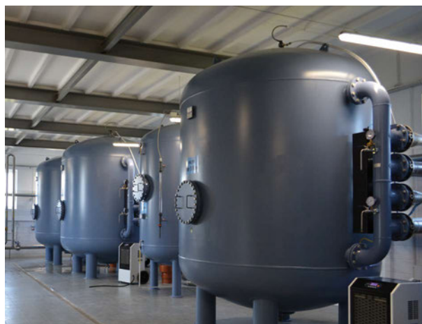
SUW Halasy – wewnątrz budynku

Pierwszym etapem inwestycji była budowa sieci wodociągowej łączącej miejscowości Tłuściec i Krzewica. Budowa wodociągu trwała od 6.05. do 4.07. 2016 r. Sama przebudowa Stacji Uzdatniania Wody w Halasach trwała od 1.06.2017 r. do 18.05.2018 r. i kosztowała 2 490 416,62 zł. Inwestycja ta nie tylko poprawia stan infrastruktury technicznej w gminie, ale także sprzyja ożywieniu rozwoju społeczno-gospodarczego. Pozytywnie wpływa także na rozwój turystyki, rozwiązuje problem ograniczeń wynikających z braku wody dobrej jakości, chroni środowisko przed zanieczyszczeniem i sprzyja wyrównywaniu szans rozwojowych terenów wiejskich.