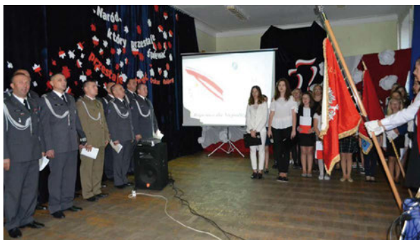
Wieczornica patriotyczna w Rogoźnicy pod hasłem „Naród, który przestaje śpiewać, przestaje istnieć” 18.10.2018 r.