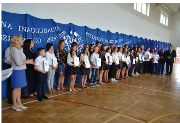
Młodzież wraz z rodzicami odbierała swoje stypendia