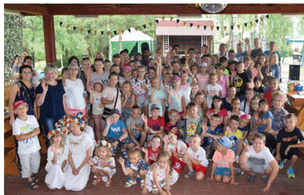
Integracja w Krzymoszytach