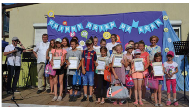
Gminny Dzień Dziecka „Radosna Niepodległa” – Gminna Komisja Rozwiązywania Problemów Alkoholowych ufundowała nagrody dla zwycięzców konkursu „Żyję zdrowo bo sportowo – bez nałogów” oraz zapewniła atrakcje dla dzieci i młodzieży