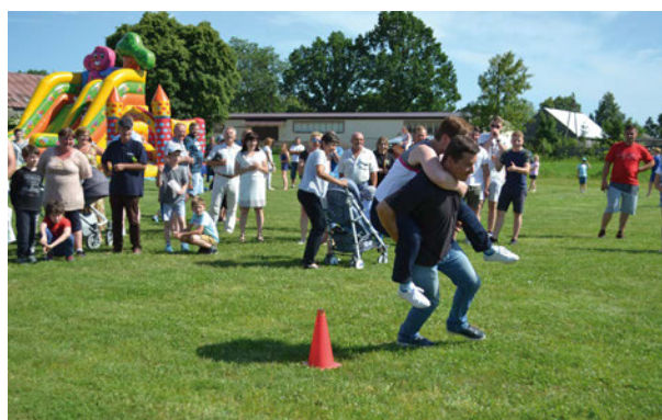
Bardzo widowiskową konkurencją w Krzewicy był bieg z żoną na plecach. Gratulujemy odważnym!