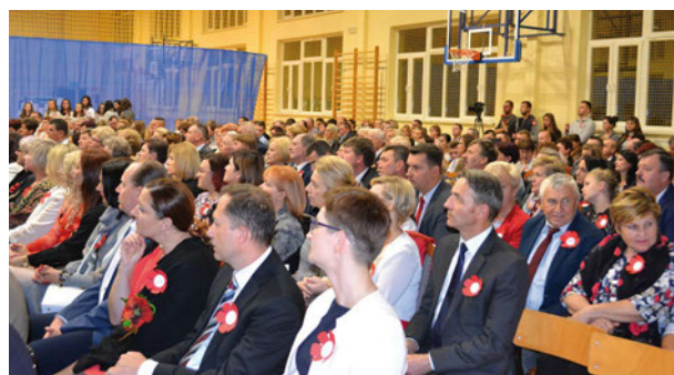
Na patriotyczny wieczór w Krzewicy tłumnie przybyli mieszkańcy gminy