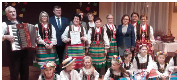
Zespół ludowy „Leśne Echo” z Zaścianek i dziecięcy zespół „Hreczka”

Wyróżnienia i nagrody za uczestnictwo otrzymały zespoły: „Ale Baby” z kapelą z Berezy, „Echo” z Przychód.