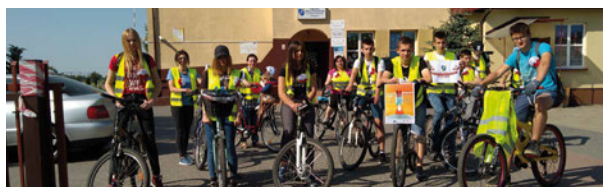
Uczestnicy rajdu rowerowego

W poniedziałek i wtorek 7. i 8. maja uczniowie przygotowali flagi, kotyliony oraz planowali trasę rajdu, nie zabrakło również wspólnego czytania publikacji na temat historii gminy. W rajdzie 9. Maja wzięło udział ponad 100 osób. Aby przemierzyć „Drogę do Niepodległej” uczestnicy mieli do dyspozycji wykonane wcześniej patriotyczne akcesoria – flagi, chorągiewki oraz kotyliony. W tym dniu grupa poznała miejsca i historie związane z regionem międzyrzeckim, które odegrały rolę w procesie odzyskania niepodległości przez Polskę. Ostatnim punktem trasy wszyst-