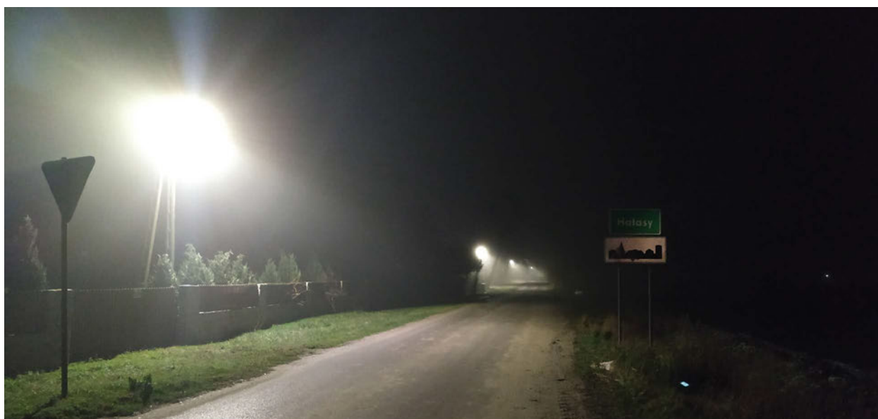
Oświetlenie w technologii LED widziane z oddali

nie gminy Międzyrzec Podlaski – Zadanie 2” współfinansowanego ze środków Europejskiego Funduszu Rozwoju Regionalnego w ramach Osi Priorytetowej 5 Efektywność energetyczna i gospodarka niskoemisyjna, Działania 5.5 Promocja niskoemisyjności Regionalnego Programu Operacyjnego Województwa Lubelskiego na lata 2014-2020. Z tego projektu skorzysta także budynek szkoły w Krzewicy, w którym – prócz modernizacji oświetlenia – unowocześnione zostanie także źródło ciepła na ekologiczne z biomasy (pellet).