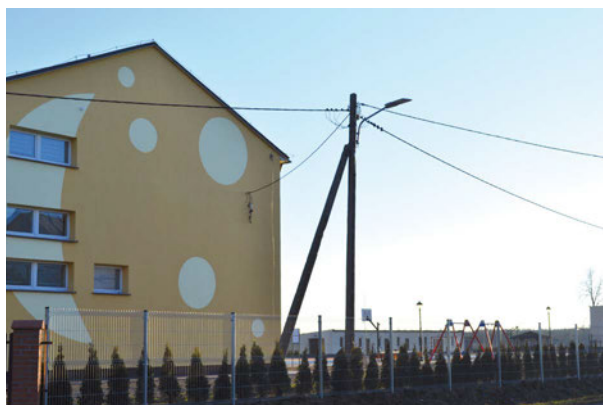
Nowe lampy LEDowe w Maniach

W ramach zadania pn. „Modernizacja istniejącego oświetlenia ulicznego na terenie Gminy Międzyrzec Podlaski” na terenie gminy wymienione zostały lampy oświetlenia ulicznego. Stare, nieekonomiczne i mało wydajne lampy zastąpiono nowoczesną technologią LED. Inwestycja jest warta 1 744 386 zł. Zadanie zostało zrealizowane w ramach projektu „Wdrażanie rozwiązań niskoemisyjnych na tere-