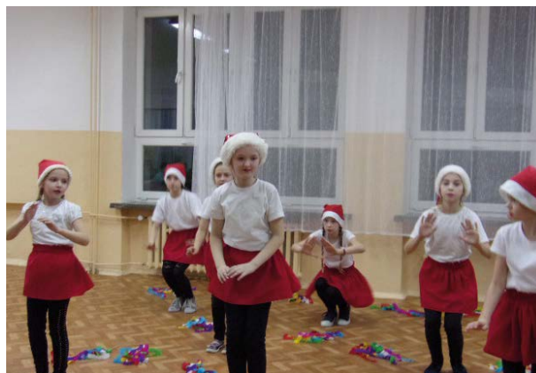
Ferie z Gminnym Ośrodkiem Kultury