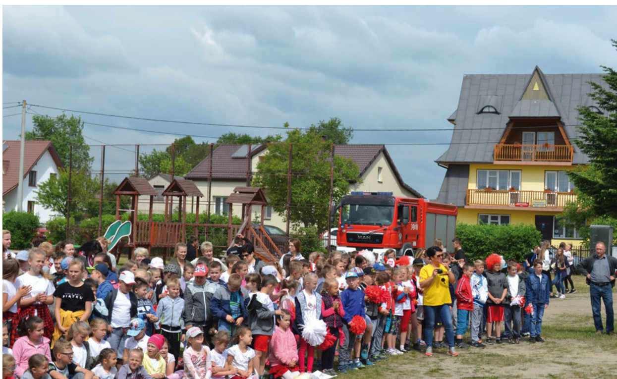
W spotkaniu z mistrzynią wzięła udział cała społeczność szkoły w Misiach i okoliczni mieszkańcy