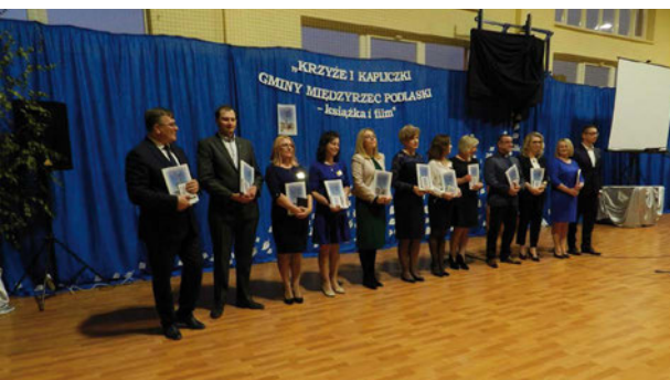
Premiera książki Krzyże i kapliczki Gminy Międzyrzec Podlaski – Premiera książki i filmu „Krzyże i kapliczki Gminy Międzyrzec Podlaski” 12.10.2018 r. w Krzewicy