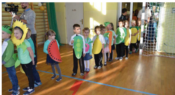
Wielką radością jest zobaczyć takich małych aktorów w przedstawieniu