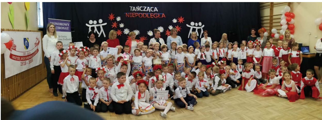
Finał Gminnego Przedszkolnego Przeglądu Tańca „Taneczna Niepodległa 2018” Rudniki 18.05.2018 r.