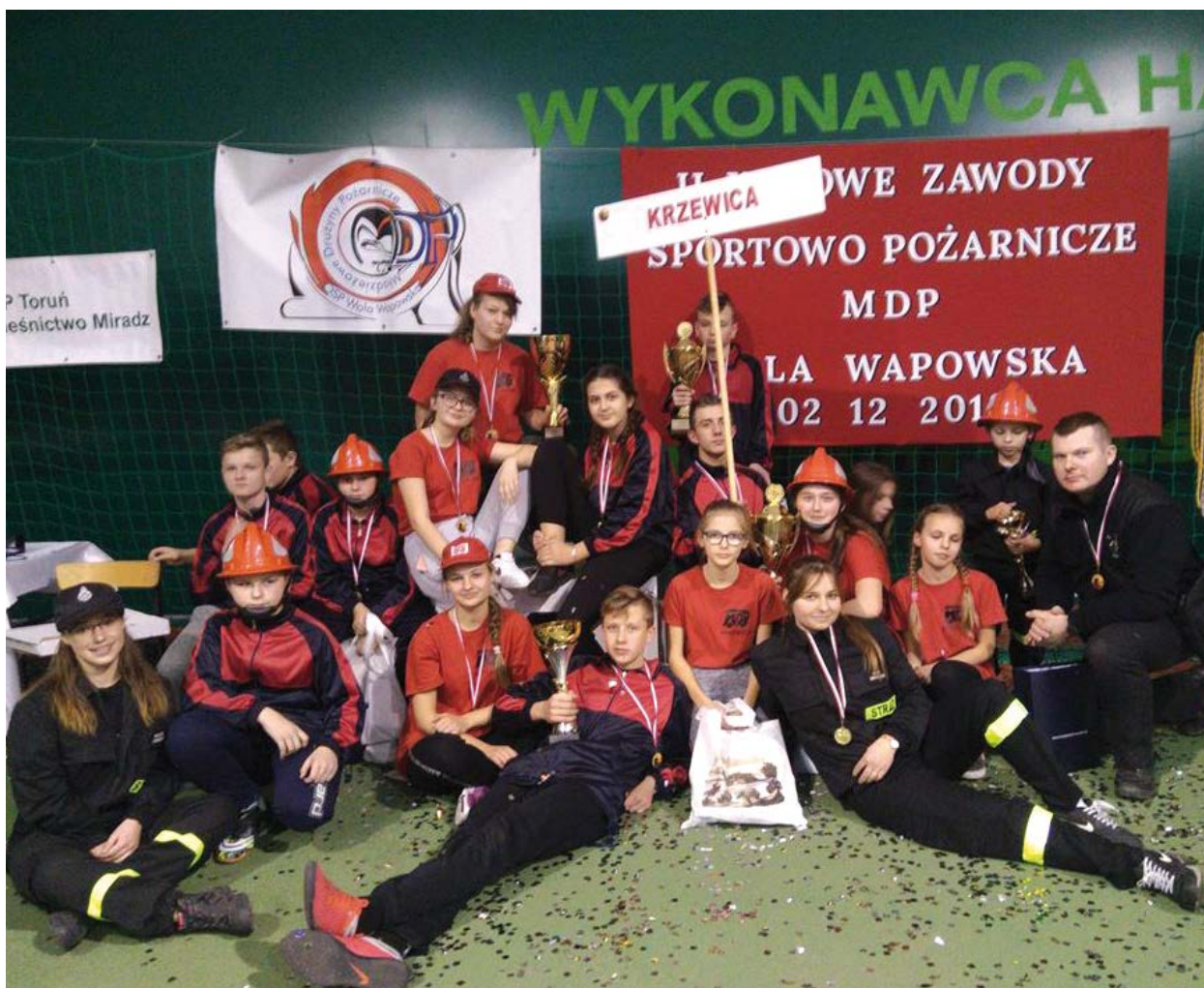
Zwycięska Młodzieżowa Drużyna Pożarnicza z Krzewicy