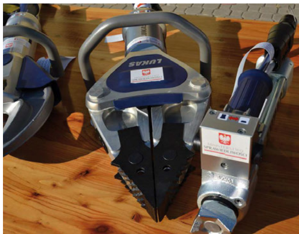
Nowy sprzęt posłuży do ratowania życia i zdrowia

tość projektu wyniosła 84 150,00 zł, a wnioskowana dotacja to kwota 83 308,50 zł. Wkład własny gminy wyniósł 1%, czyli 841,50 zł.