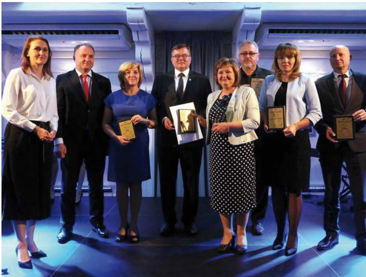
Wręczenie wyróżnienia Gmina Przyjazna Inwestorom

i usprawnień zarządczych np. w formie samooceny CAF, podejmowanie inicjatyw mających na celu uproszczenie obsługi interesanta-inwestora, a także za wysoki poziom dotacji pozyskanych przez gminę – ponad 26 mln zł dotacji z funduszy europejskich w ciągu ostatnich 4 lat, dzięki czemu zrealizowanych zostało 18 inwestycji na łączną kwotę 35 mln zł.