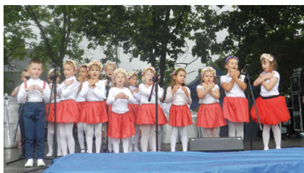
Dzieci występowały na scenie w barwach biało-czerwonych