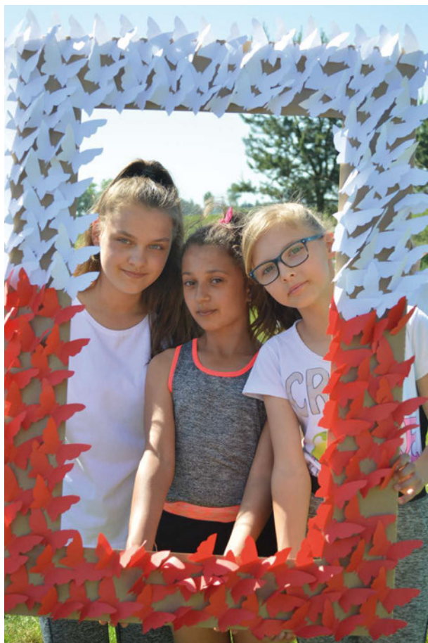
XVII Gminne Biegi Przelajowe im. Janusza Kusocińskiego „Dla Niepodległej”