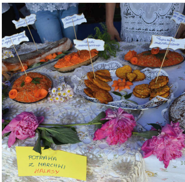
Stoiska gastronomiczne i konkursowe kusily odwiedzających