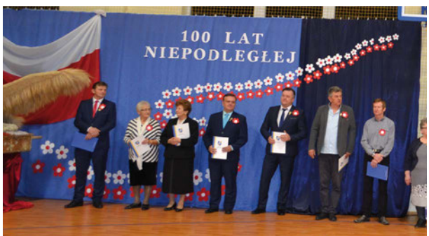
Zasłużeni dla Gminy Międzyrzec Podlaski