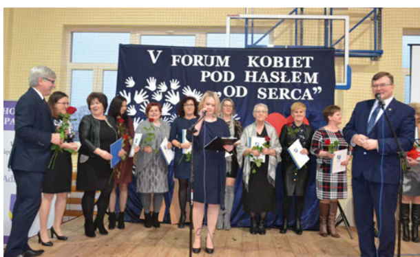
V Forum Kobiet pod hasłem „Od Serca” w Krzewicy