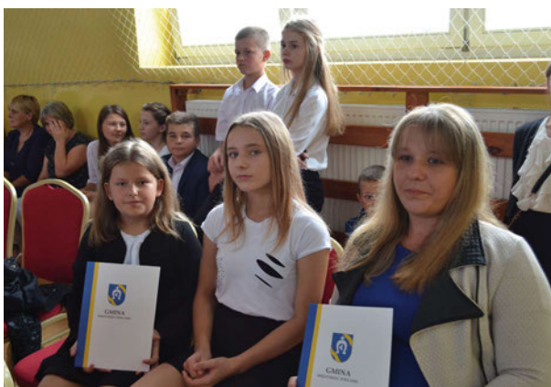
Duma na twarzy dzieci i rodziców – bezcenna