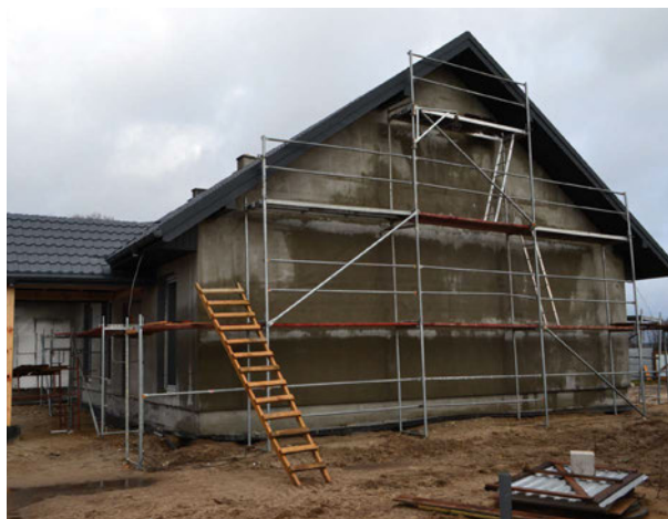
Świetlica w trakcie budowy

Na działkach nr 56/2 i 55/7 w miejscowości Łuby wybudowane zostanie nowe centrum aktywności mieszkańców - świetlica wiejska. Budynek będzie parterowy, niepodpiwniczony, jednokondygnacyjny, z poddaszem nieużytkowym, zrealizowany w technologii tradycyjnej murowanej, z dachem wielospadowym, pokrytym blacho dachówką. Aktualnie nowopowstały budynek jest w stanie surowym zamkniętym.