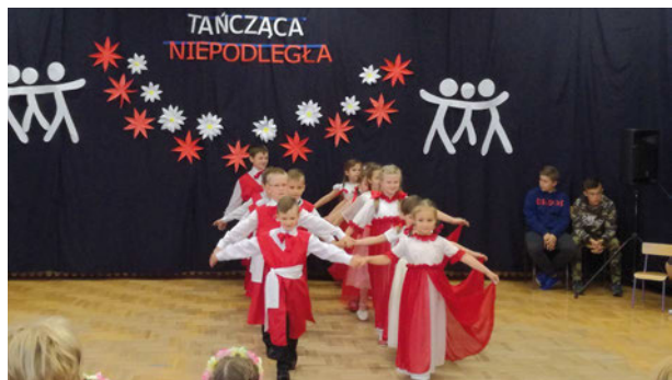
Dzieci bardzo profesjonalnie podeszły do przygotowań swoich układów tanecznych