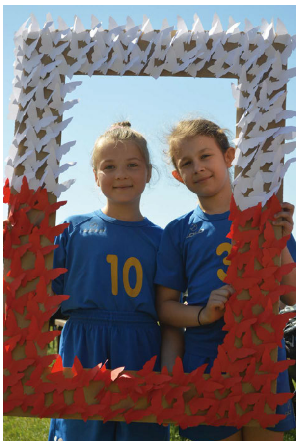
XVII Gminne Biegi Przelajowe im. Janusza Kusocińskiego „Dla Niepodległej”