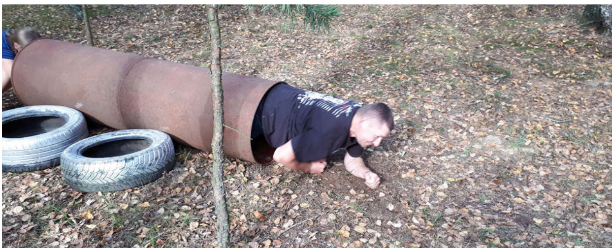
Dużym wyzwaniem w Rudnikach była stacja, w której należało przeczołgać się przez rurę