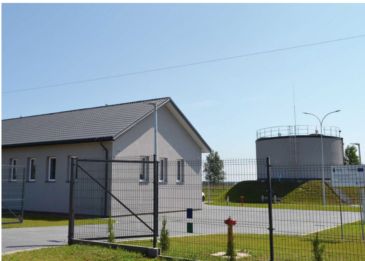
Budynki SUW Halasy po oficjalnym uruchomieniu