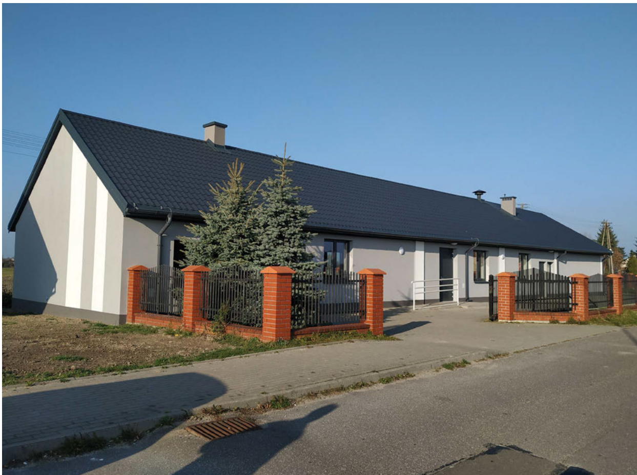
Tak prezentuje się świetlico-remiza w Tłuścu po termomodernizacji

nych, wymianę skrzydeł drzwiowych wewnętrznych, wykonanie nowych instalacji oraz dostosowanie budynku do nowej funkcji - świetlicy - m.in. poprzez wykonanie podjazdu dla osób niepełnosprawnych, rozbiórkę ścianek działowych i okładziny sufitów, wykonanie nowej posadzki. Ponadto, z własnych środków finansowych gminy zostało zakupione wyposażenie do wyremontowanej świetlicy-remizy na łączną kwotę 34 380,88 zł. Zakupione zostały m.in. meble kuchenne (stoły nierdzewne, półki), sprzęt AGD (kuchnię gastronomiczną, patelnię elektryczną, zmywarkę, okap, szafy chłodnicze, wózek kelnerski itd.) oraz drobne wyposażenie jak np. lustra, wieszaki, karnisze i rolety.