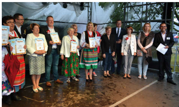
Dożynki Gminne w Rzeczycy