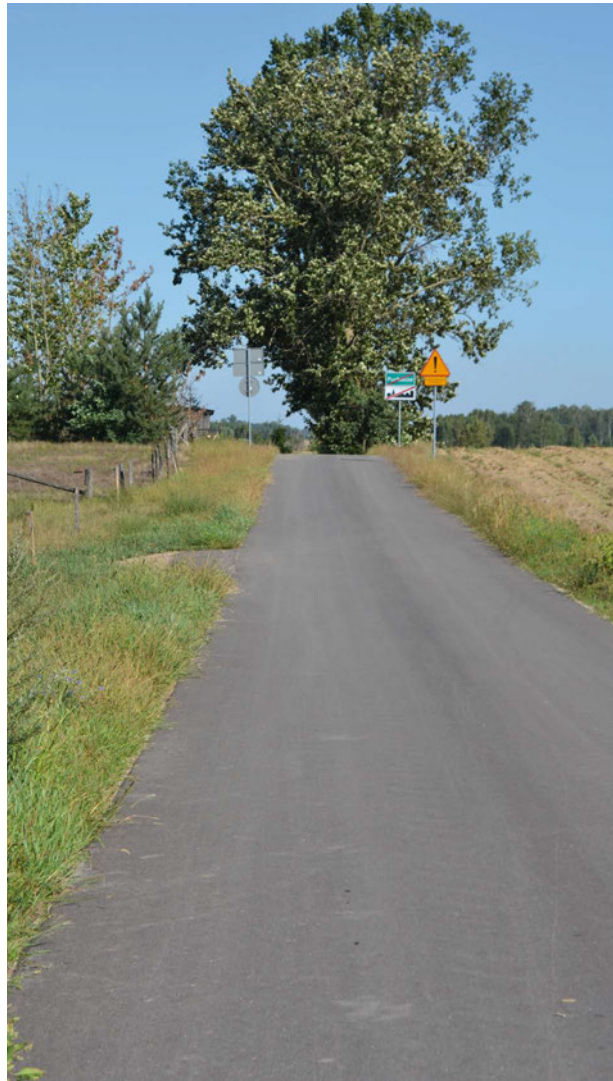
Droga w Puchaczach