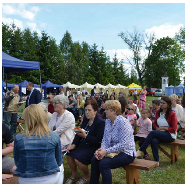
Festiwal w Strzakłach cieszył się obecnością wielu mieszkańców gminy