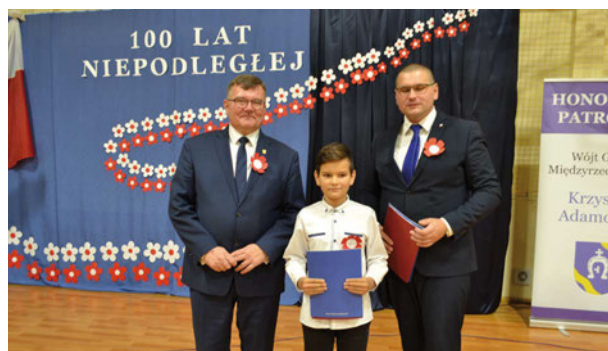
Podczas wydarzenia rozstrzygnięto konkurs pn. Strofy dla Niepodległej