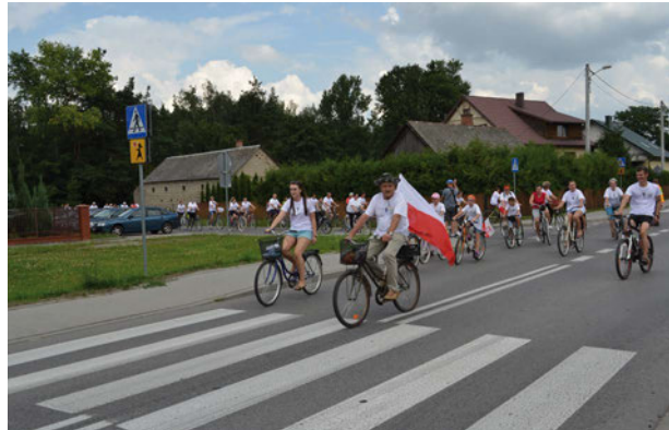
OSP Jelnica na sportowo 29.07.2018 r. – rodzinny rajd rowerowy w koszulkach z motywem 100-lecia odzyskania niepodległości