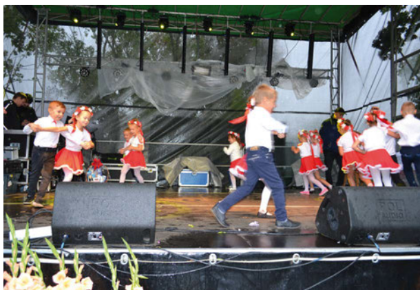
Patriotyczny akcent podczas dożynek w Rzeczycy