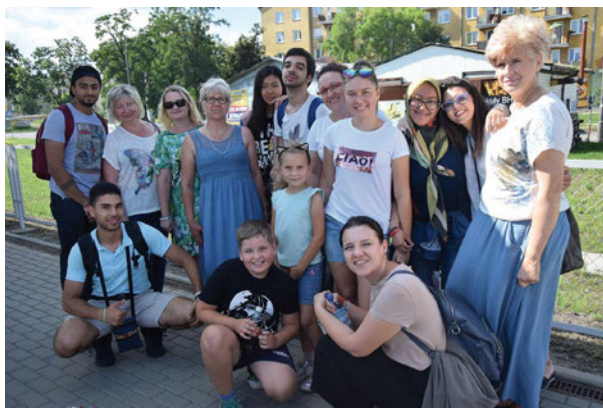
Pamiątkowe zdjęcie młodzieży z Dyrekcją GBP i bibliotekarkami