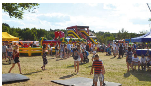
Gminny Dzień Dziecka „Radosna Niepodległa” 10 czerwca 2018 r. odwiedziła liczna rzesza rodzin z dziećmi