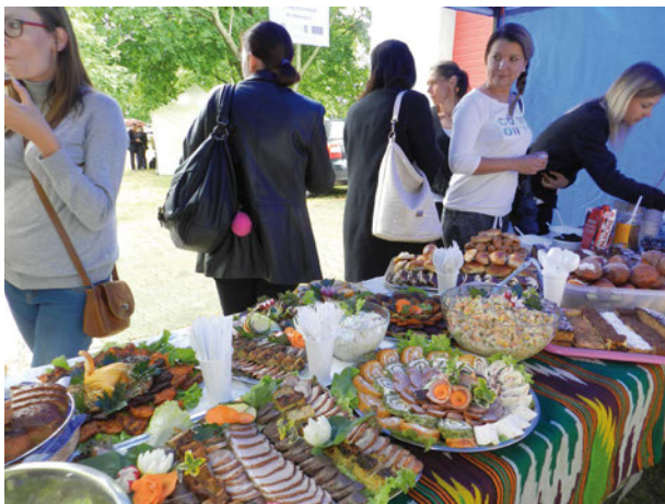
Stoiska gastronomiczne i konkursowe kusily odwiedzających