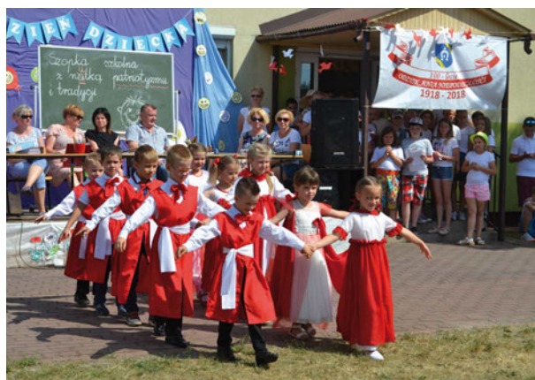
Gminny Dzień Dziecka „Radosna Niepodległa” – dzieci w barwach narodowych