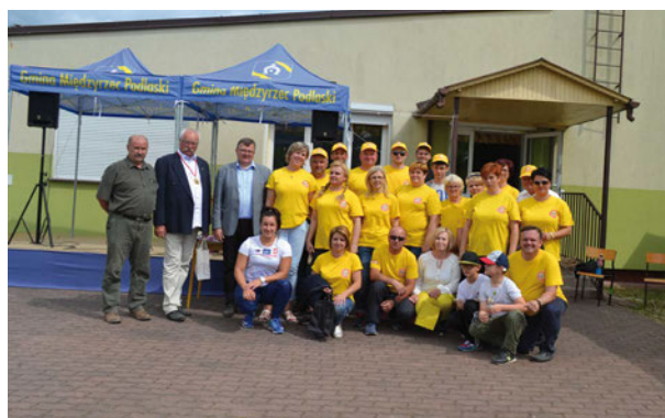
Pamiątkowe zdjęcie członków i sympatyków Stowarzyszenia Przyjazne Misie z Malwiną Kopron