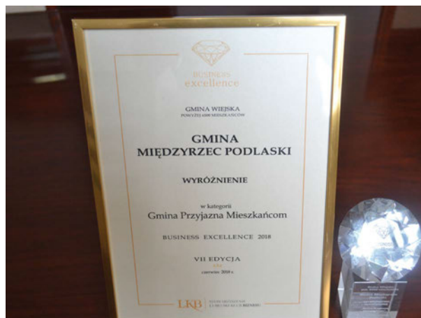
Certyfikat Gmina Przyjazna Mieszkańcom

- nagroda przyznana gminie przez Starostę Powiatu Białskiego za działania na rzecz upowszechniania kultury lokalnej w 2017 r.