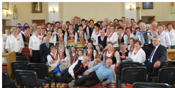
Uczestnicy Przeglądu Pieśni Maryjnych w Przychodach

Jednym z organizatorów i jednocześnie gospodarzem przeglądu był zespół ludowy „Echo” z Przychód działający we współpracy z Gminnym Ośrodkiem Kultury. W przeglądzie wzięło udział 12 zespołów ludowych - lokalnych oraz z gmin sąsiednich: „Echo” z Przychód, „Kalina” z Wygnanki, „Ale Baby” z kapelą z Berezy, „Leśne Echo” z Zaścianek, „Kwiaty Polne” z Kolembród, „Sami Swoi” z Tłuścica, „Wrzos” z Kąkolewnicy, „Jutrzenka” z kapelą z Rogoźnicy, „Tęcza” z Brzozowicy Małej, „Malwy” z Komarówki Podlaskiej, „Lubartowiaczy z Lubartowa” oraz „Bokińczanka” z Bokini Królewskiej.