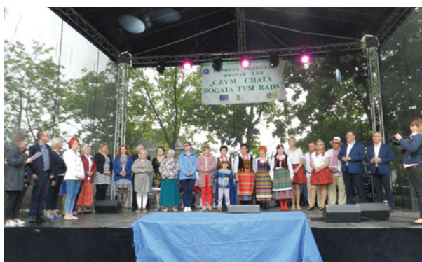
Wręczenie nagród w konkursach stoiskowych