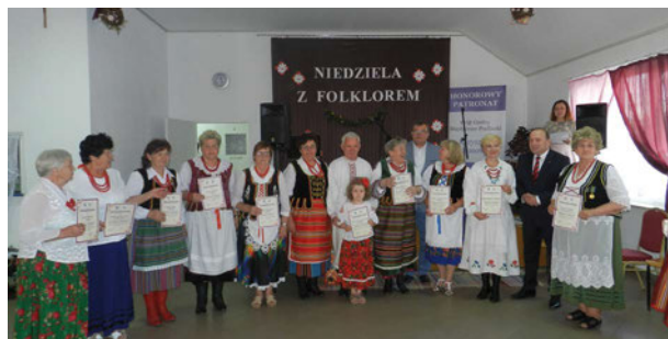
Niedziela z folklorem w Rogoźnicy