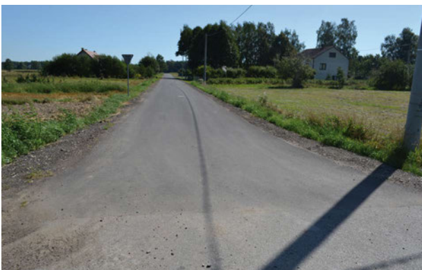
Nowy asfalt w Strzakłach