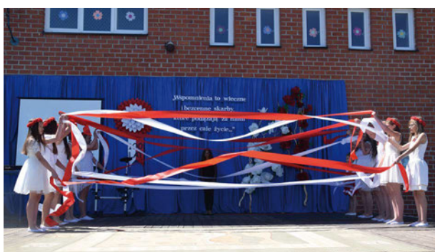
Jubileusz 100-lecia Publicznej Szkoły Podstawowej im. M. Kopernika w Tłuścću