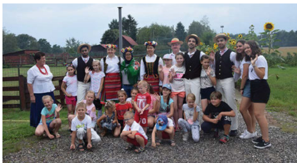
Młodzież z zagranicy w lokalnych polskich strojach ludowych

jemnie doświadczyć niezapomnianych chwil. W Wysokim Goście wykonali prezent, który na stałe zawisnie na ścianie biblioteki - parę ciepłych słów zapisane w ich ojczystych językach o pobycie w Gminie.