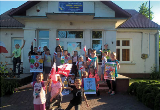
Noc bibliotek „Płomień Niepodległości” w filii w Tłuścicu