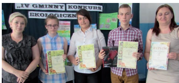
Publiczne Gimnazjum Nr 1 było organizatorem IV Gminnego Konkursu Ekologicznego -do współzawodnictwa przystąpiły wszystkie gimnazja z terenu gminy