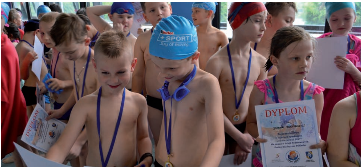
Nic tak nie świadczy o sukcesie inicjatywy, jak uśmiech zadowolonych dzieci