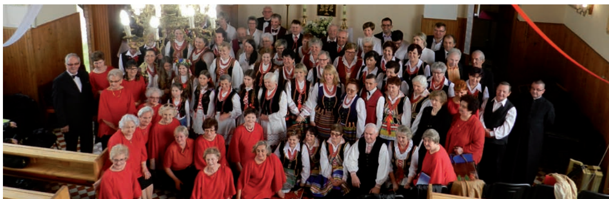
Kult pieśni maryjnych to ważny element przychodzkiej tożsamości lokalnej

Tegoroczny przegląd przyniósł uczestnikom wiele pozytywnych wrażeń. Każdego roku ma on na celu zachęcenie lokalnej społeczności do zawierzenia swojego życia Maryi Królowej Polski.