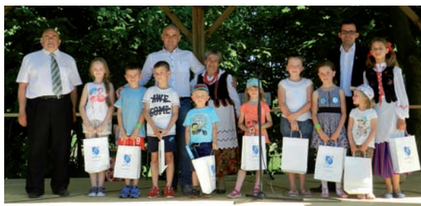
W losowaniu nagród wzięło udział wiele dzieci, które chętnie odbierały upominki z rąk Starosty Bialskiego

Do dyspozycji dzieci, młodzieży i całych rodzin były animatorki Gminnego Ośrodka Kultury w Międzyrzec Podlaskim. Dla najmłodszych przygotowały konkurencje sprawnościowe, zabawy z chustą i tunelem animacyjnym,