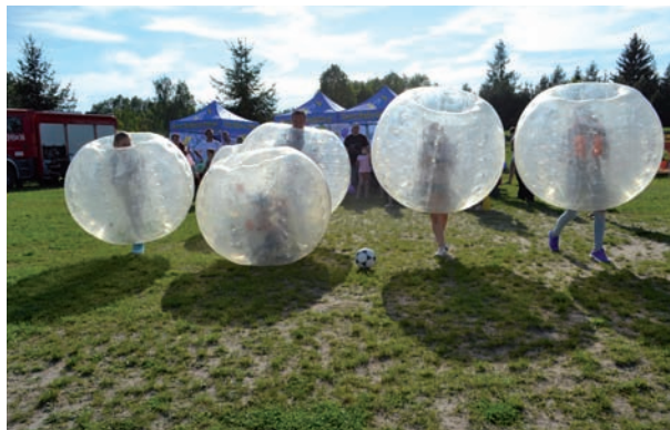
Do turniejów w bumper balls zawsze ustawiają się kolejki chętnych