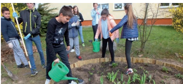
Od lutego do czerwca uczniowie klas IV- VI prowadzili szereg działań pod hasłem „Od nasionka do kwiatka”, mających na celu założenie szkolnej rabaty