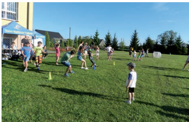
Przeciąganie liny to jedna z najbardziej widowiskowych konkurencji sportowych proponowanych przez Stowarzyszenie Moja Gmina