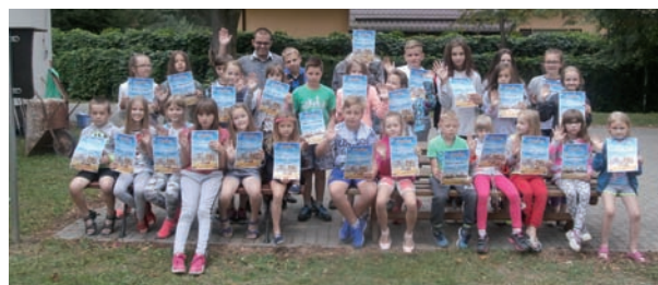
Na zakończenie wakacji z GOK-iem każdy uczestnik otrzymał pamiątkowy dyplom

nicy. Uczestnicy wakacji w Żabcach znaleźli też czas na gry planszowe, komputerowe oraz karaoke na PlayStation oraz rozegranie turnieju „Familiady”. Największą frajdę sprawiły dzieciom biwaki z noclegiem, podczas których mogły piec kiełbaski nad ogniskiem, śpiewać, tańczyć czy też wcielić się w rolę projektantów mody (pokaz „top model z recyklingu w Przychodach). Do grupy w Pościszach dołączyły podczas biwaku dzieci z Halas.