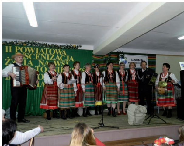
Na scenie współorganizatorzy – zespół ludowy „Leśne Echo” z Zaścianek

Zgromadzeni w Domu Ludowym mieszkańcy powiatu bialskiego mieli okazję zapoznać się z działalnością Ośrodka Doradztwa Rolniczego z siedzibą w Grabanowie, który przygotował stoisko informujące o swojej działalności oraz o uprawie owsa. Do dyspozycji osób przybyłych na wydarzenie czekał ponadto tradycyjny poczęstunek przygotowany przez gospodarzy z Zaścianek. Nie zabrakło również atrakcji dla dzieci i młodzieży - gry i zabawy prowadziły animatorki Gminnego Ośrodka Kultury w Międzyrzecu Podlaskim.