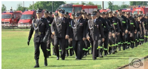
XIX Powiatowe zawody sportowo-pożarnicze dla jednostek OSP z terenu powiatu bialskiego odbyły się 18 czerwca 2017 r. w Międzyrzecu Podlaskim. Organizatorami zawodów byli Zarząd Oddziału Powiatowego ZOSP RP z Komendą Miejską PSP w Białej Podlaskiej a gospodarzem Gmina Międzyrzec Podlaski.