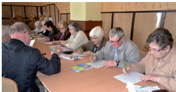
Seniorzy z Rzeczycy aktywnie włączyli się w warsztaty

Szkolenie trwało 3 godziny. Mieszkańcy Rzeczycy biorący udział w szkoleniu poznali sposoby bezpiecznego używania bezgotówkowych form płatniczych oraz dowiedzieli się jak mogą chronić swoją wiarygodność finansową, a także jak ustrzec się przed kradzieżą tożsamości. Zajęcia składały się z dwóch modułów: I moduł - formy bezgotówkowe, II moduł - wiarygodność finansowa. Uczestnicy wysłuchali wykładu i obejrzeni filmy obrazujące wybrane zagadnienia. Podczas warsztatu seniorzy otrzymali do wykonania ćwiczenia dotyczące wybranych zagadnień finansowych opar-