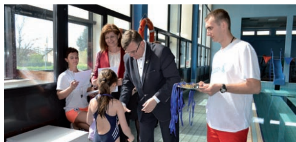
Wręczenie dyplomów i medali małym pływakom z ZSP w Rogoźnicy