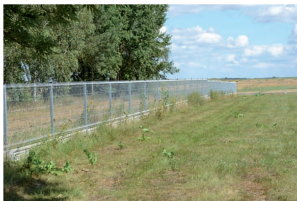
Ogrodzenie świetlicy w Łuniewie