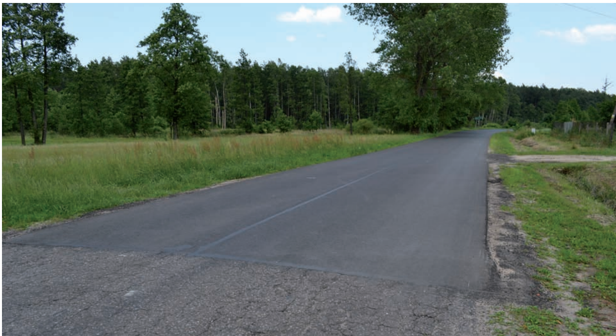
Odcinek drogi powiatowej Nr 1001L przebiegający przez teren Gminy Międzyrzec Podlaski został odnowiony w całości, aż do granicy gminy w Brzozowicy