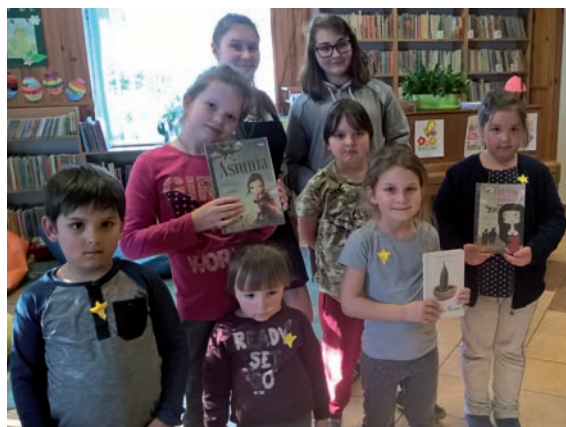
Dzieci biorące udział w akcji „Żonkile”