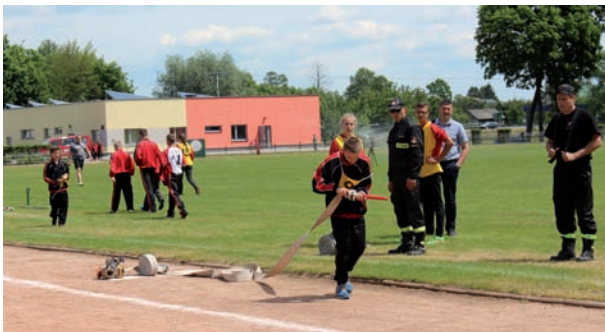
Młodzi strażacy zadziwiali wszystkich sprawnością fizyczną, szybkością i profesjonalizmem