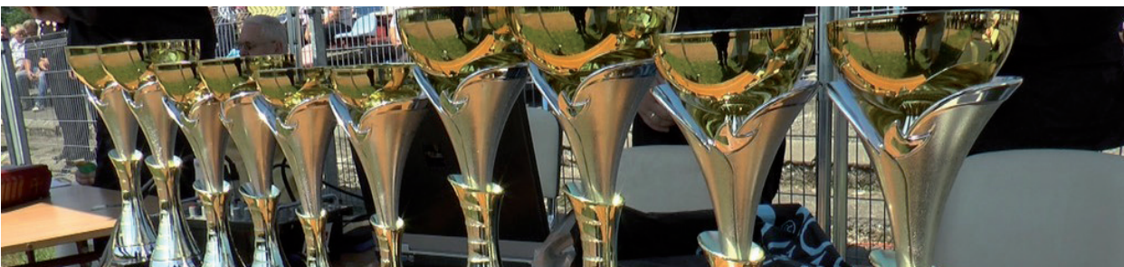
W zawodach składających się z dwóch dyscyplin: sztafety i bojówki udział wzięło 20 jednostek OSP męskich oraz 8 żeńskich jednostek. Wyniki przedstawiają się następująco: W grupie kobiecych drużyn pożarniczych: I miejsce – OSP Krzewica gm. Międzyrzec Podlaski (112,98 pkt), II miejsce – OSP Piszczac (113,32 pkt), III miejsce – OSP Horodyszczce gm. Wisznice (118,93 pkt). W grupie męskich drużyn pożarniczych: I miejsce – OSP Cicibór Duży gm. Biała Podlaska (97,84 pkt), II miejsce – OSP Sławatycze (98,60 pkt), III miejsce – OSP Horodyszczce gm. Wisznice (98,92 pkt).