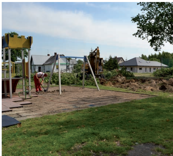
Roboty związane z budową pierwszego przedszkola w gminie ruszyły pełną parą