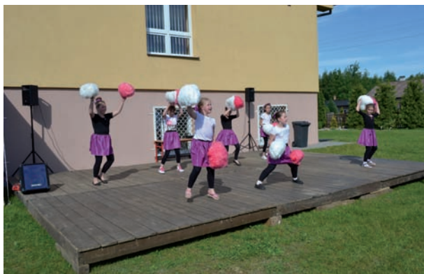
Podczas festynu każdy mógł wybrać coś dla siebie spośród atrakcji przygotowanych przez organizatorów

Stoisko z poczęstunkiem przygotowało Stowarzyszenie Społeczno-Oświatowe Gminy Międzyrzec, grill i zupę grochową przygotowali gospodarze z OSP Tuliłów i szkoła podstawowa w Tuliłowie. Słodki poczęstunek przygotowała firma dr Gerard.