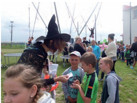
Bibliotekarki przebrane w bajkowe stroje zawsze budzą wiele uśmiechu, tak na twarzach dzieci, jak i dorosłych