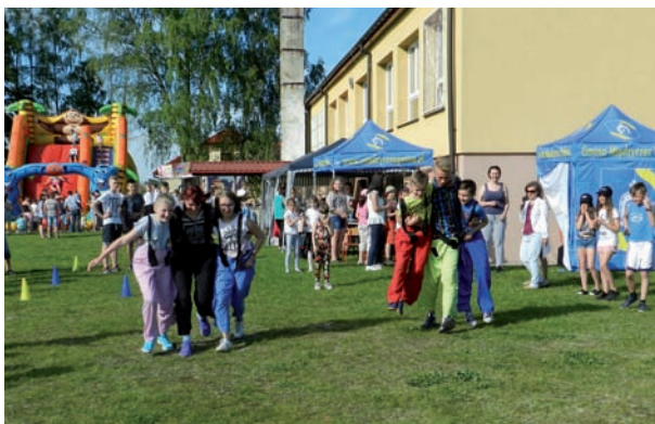
Festyny rodzinne „Rodzina sportem silna” od lat przyciągają rzesze amatorów rodzinnych zmagani sportowych