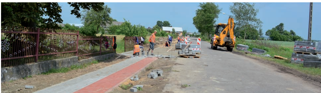
Chodnik w tak dużej miejscowości jak Krzewica jest konieczny w celu zapewnienia bezpieczeństwa mieszkańcom

P rzy drodze powiatowej nr 1006L w miejscowości Krzewica powstaje dalsza część chodnika wiodącego przez ruchliwą wieś. Nowa nić chodnika rozpoczyna się od kilometra 5+399 do km 6+220. Mieszkańcy Krzewicy już od końca sierpnia będą cieszyć się inwestycją o długości 821 m.