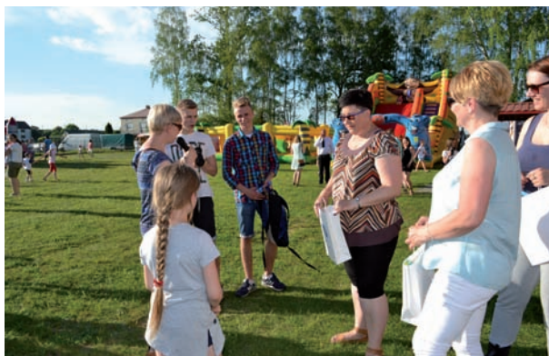
Animatory poruszali się po całym placu, by zachęcać do udziału w konkurencjach. Na zwycięzców czekały nagrody