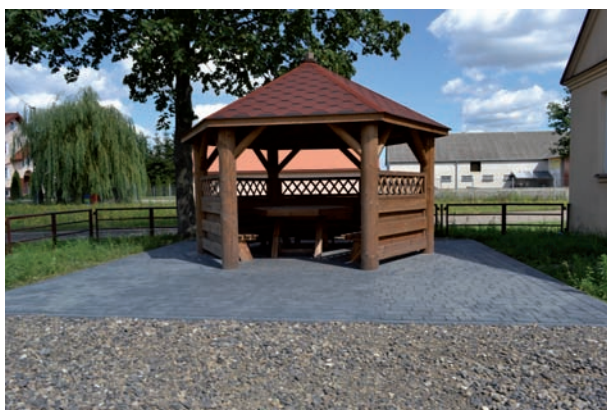
Altana w Wólce Krzymowskiej