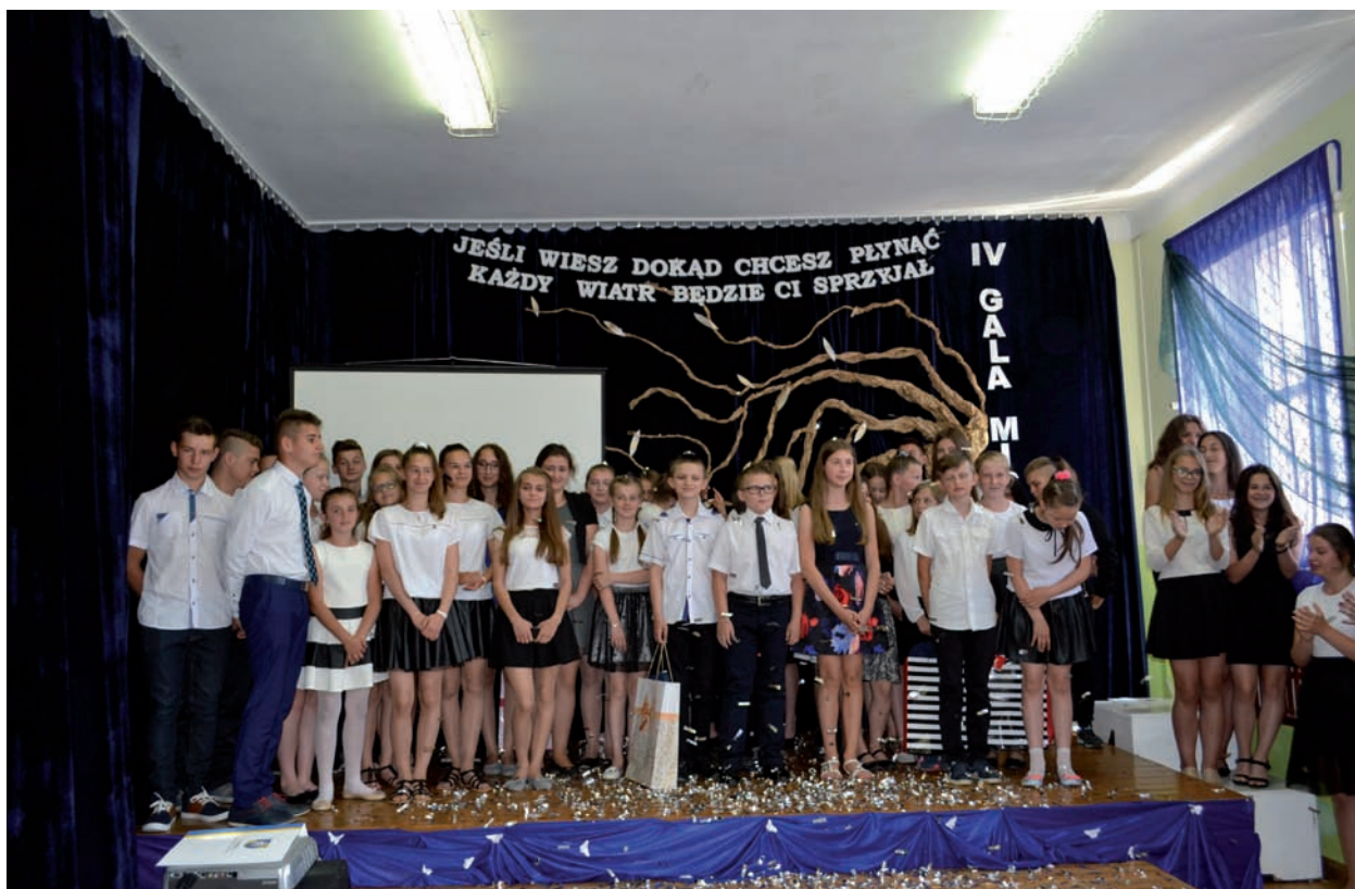
Oprawa IV Gali Mistrzów była bardzo uroczysta – laureaci zostali obsypani błyszczącym konfetti