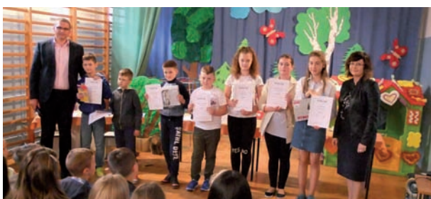
W SP w Kożuszkach laureatów konkursów ekologicznych nagrodzono podczas przedstawienia teatralnego pt.: „Jaś i Małgosia w krainie ekologii”