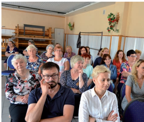
Spotkania organizowane przez SILT cieszą się dużym zainteresowaniem lokalnych liderów

Podczas zajęć uczestnicy biorą udział tak w warsztatach praktycznych jak i wykładach teoretycznych. Na przykład podczas zajęć z komunikacji uczestnicy ćwiczą wystąpienia