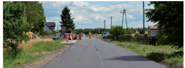
Nowa nawierzchnia na drodze w Puchaczach – skrzyżowanie Dołha-Szachy-Sitno

rządkowanie poboczy. Zaś na odcinku od skrzyżowania DK2 w kierunku wsi Rogoźnica został wykonany chodnik wraz ze zjazdami do posesji. Prace wciąż trwają.