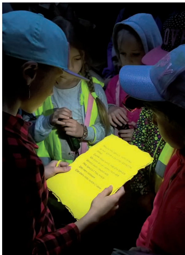
Uczestnicy „Baśnioboru” mieli wielką frajdę podczas zmagania w leśnej grze terenowej, szczególnie po zapadnięciu zmroku

Tuż przed północą drużyny powróciły do swoich bibliotek, gdzie do rana poprzez różne zaplanowane działania kontynuowano spotkanie z książką. Rano na dzieci czekał słodki poczęstunek.