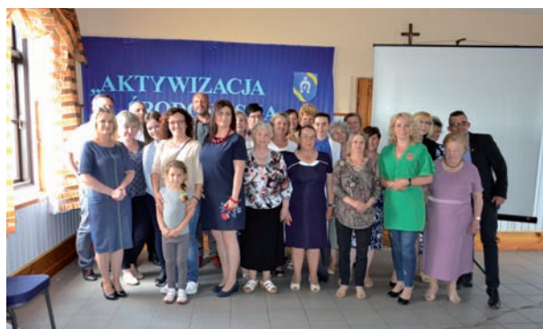
Na zdjęciu wszyscy uczestnicy konferencji wraz z prelegentami

ności lokalnej społeczności. W drugiej części skupiono się na sposobach finansowania i narzędziach niezbędnych do aktywizacji. Ostatnia część dotyczyła odbiorców i konsumentów podejmowanych działań. Zaprezentowane przez rozmówców sposoby aktywizacji środowiska miały za zadanie zmotywować mieszkańców naszej gminy do działania.