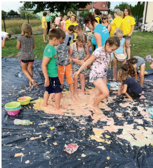
Tak wyglądały zajęcia z sensoplastyki prowadzone przez członków Stowarzyszenia Przyjazne Misie

Członkowie stowarzyszenia Przyjazne Misie, działając jeszcze jako grupa nieformalna mieli już okazję aktywnie włączać się w inicjatywy społeczne Gminy Międzyrzec Podlaski. Przygotowali oni stoisko Gminy Międzyrzec Podlaski podczas dożynek powiatowych w Zalesiu w 2016 r. oraz stoisko promujące sołectwo Misie podczas dożynek gminnych w Berezie w 2016.