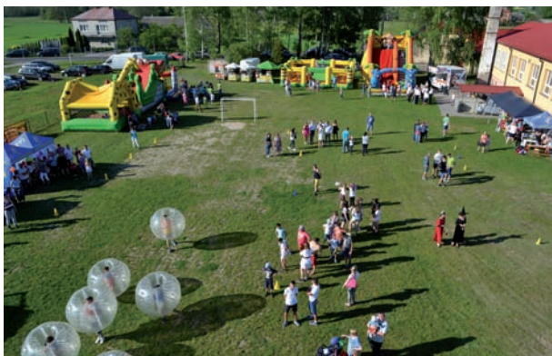
Widok na plac przy szkole podstawowej w Tuliłowie z podnośnika JRG w Międzyrzeczu Podlaskim