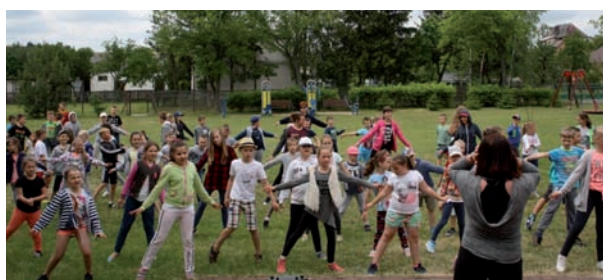
W SP w Misiach zorganizowano „Szkolny dzień sportu”, w ramach którego dzieci mogły wspólnie spędzić dzień na aktywności fizycznej

„Szkoła Odkrywców Talentów” – takie miano uzyskała w roku szkolnym 2016/2017 Publiczna Szkoła Podstawowa z oddziałem przedszkolnym im. Janusza Kusocińskiego oraz Publiczne Gimnazjum Nr 3 im. Janusza Kusocińskiego w Rogoźnicy. Tytuł ten jest świadectwem tego, iż placówki przyczyniają się do odkrywania, promocji i wspierania uzdolnień dzieci i młodzieży. Dzięki uzyskanemu wyróżnieniu rogoźnickie placówki znalazły się na polskiej mapie „Szkół Odkrywców Talentów” dostępnej na stronie internetowej www.ore.edu.pl .