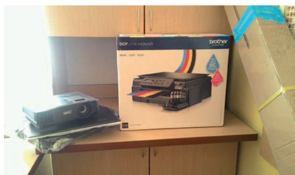
Nowy sprzęt na stanie Stowarzyszenia Społeczno-Oświatowego Gminy Międzyrzec