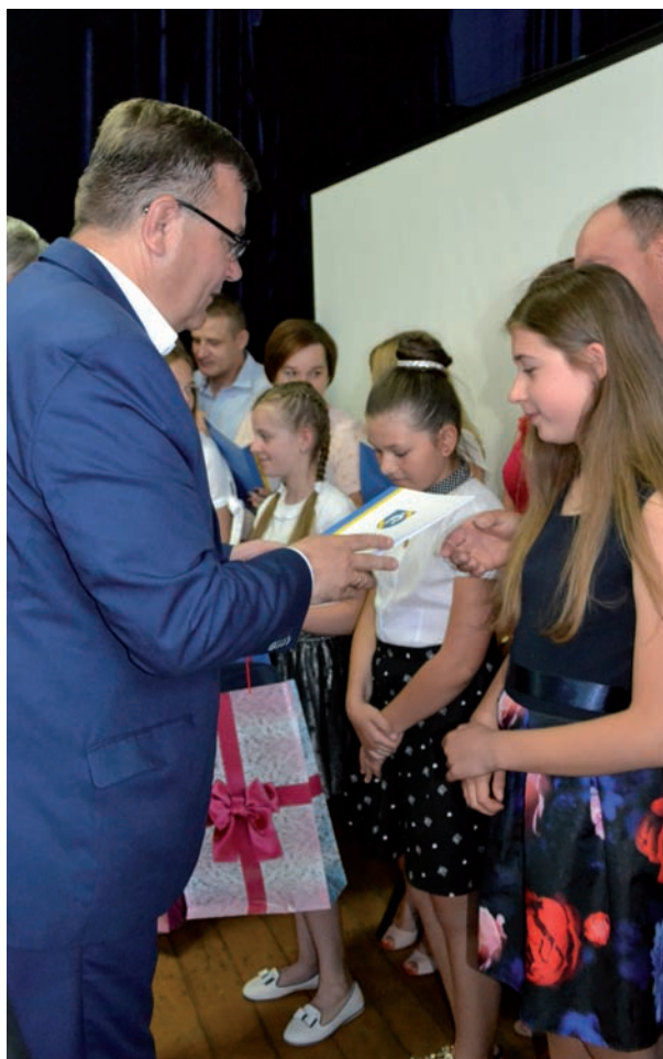
Wyodróżnieni uczniowie wraz z rodzicami dumnie odbierali dyplomy i nagrody