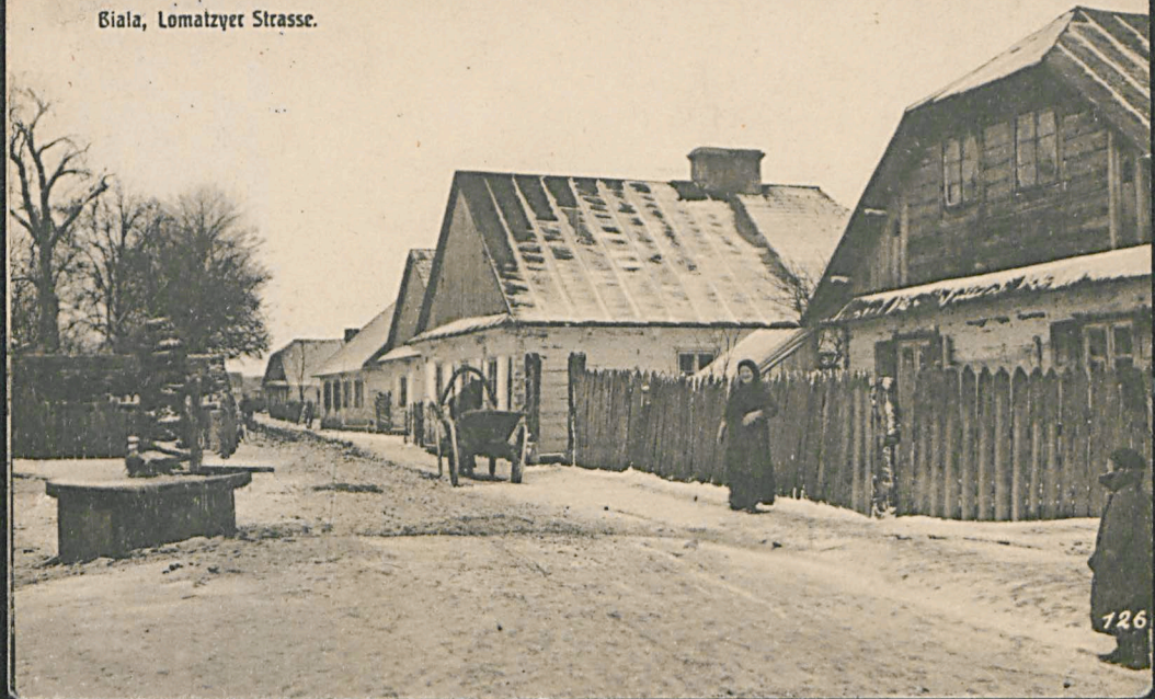
Biala, Lomazyer Strasse.