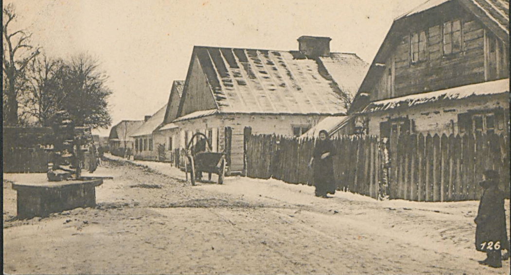
Biala, Lomazyer Strasse.