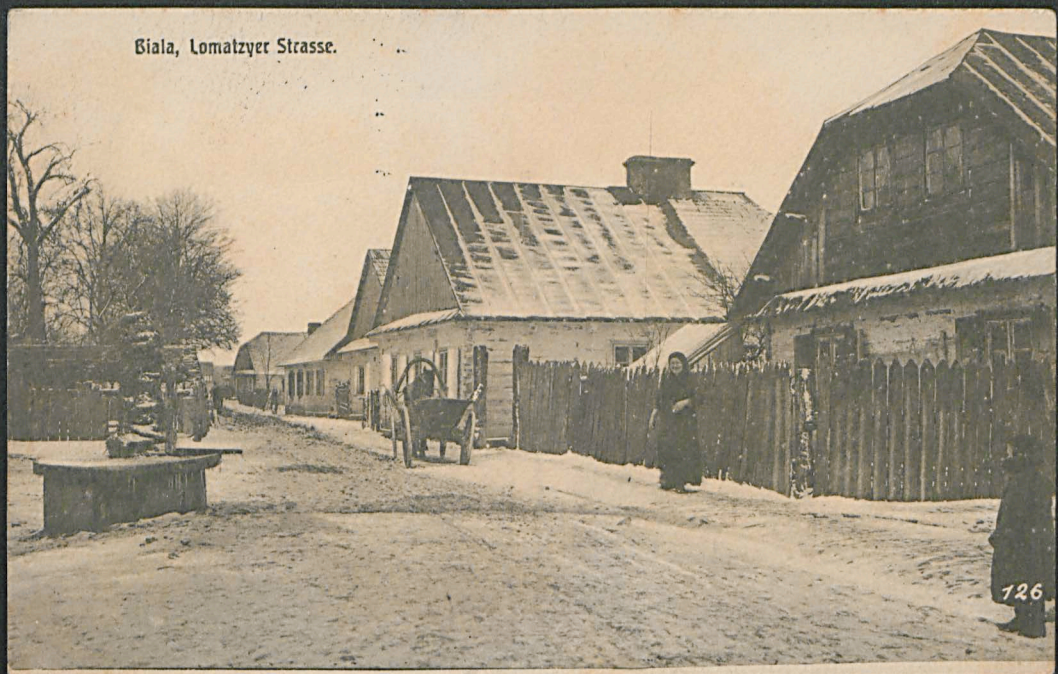
Biala, Lomatzyer Strasse.