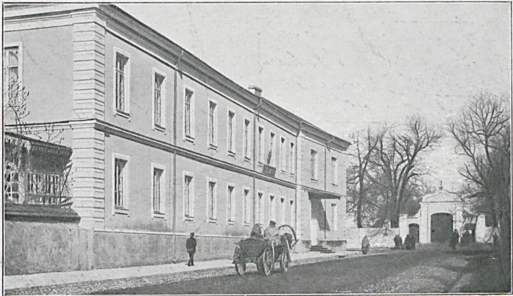
BIAŁA. Maennliches Gymnasium.