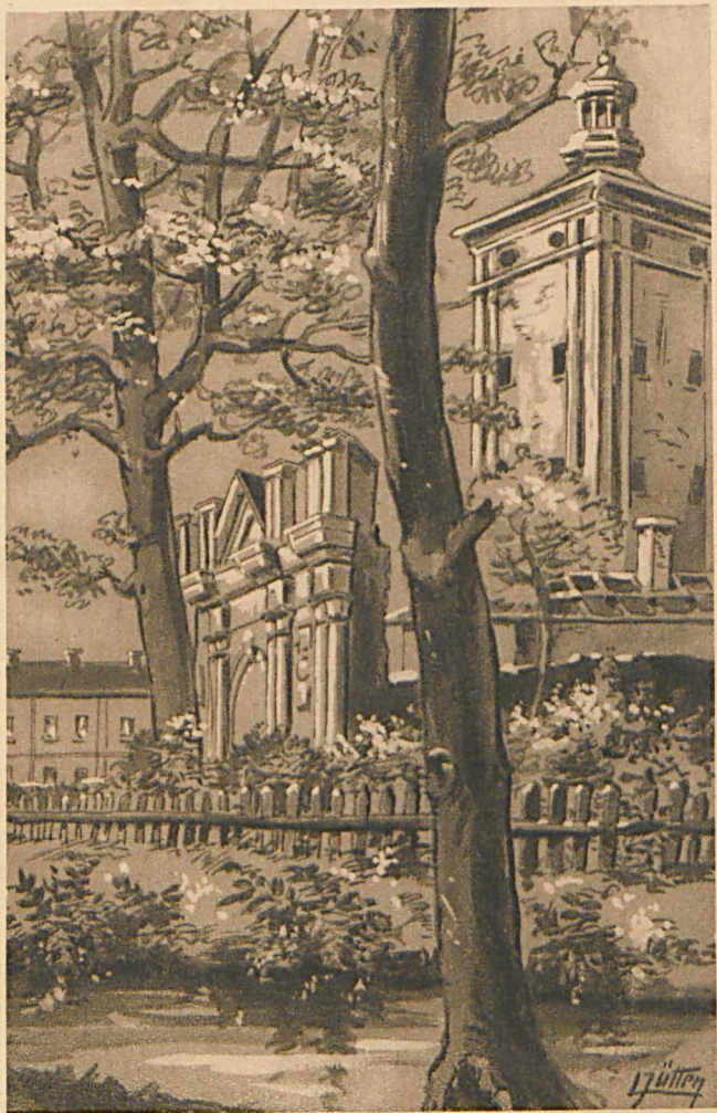
„Schloß in Biala“