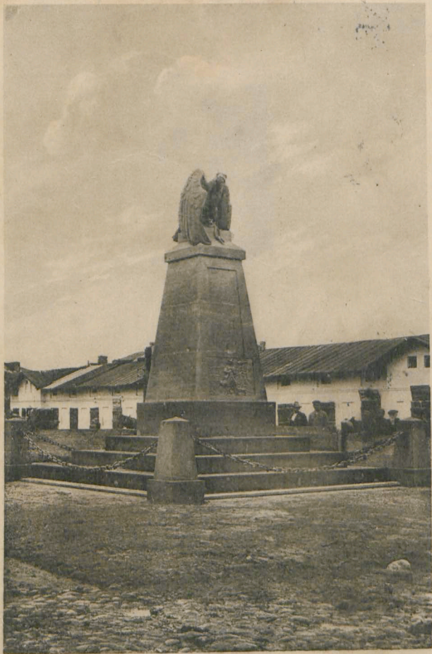
MIĘDZYRZEC. Pomnik poległych 16/XI. 1918 r.