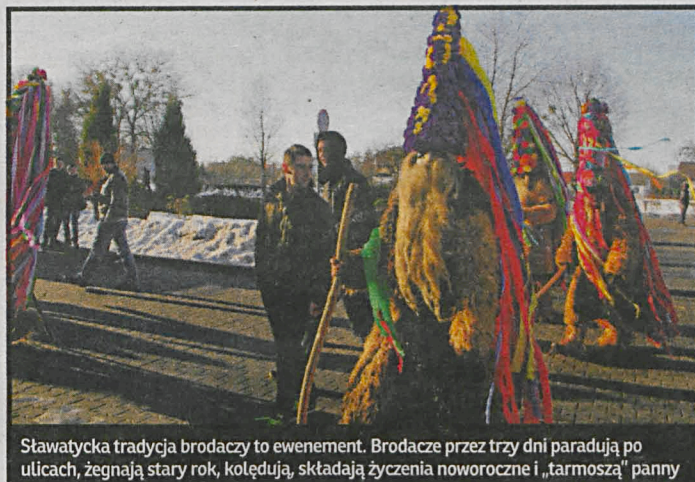
Sławatycka tradycja brodaczy to ewenement. Brodacze przez trzy dni paradyją po ulicach, żegnają stary rok, kołędują, składają życzenia noworoczne i „tarmoszą” panny