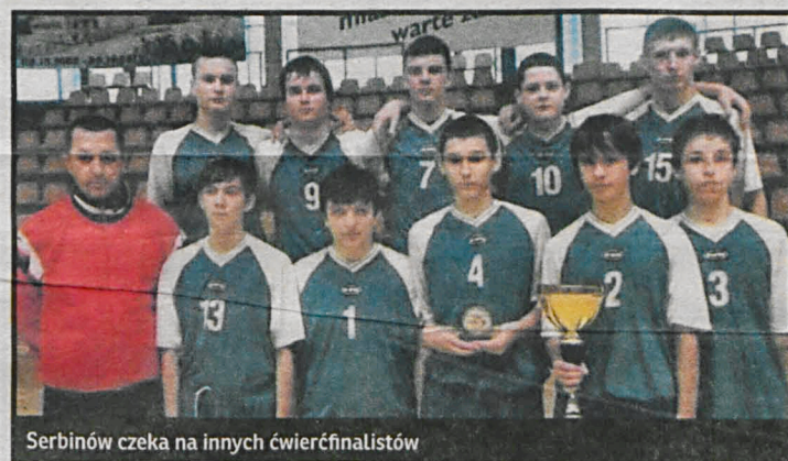
Serbinów czeka na innych ćwierćfinalistów