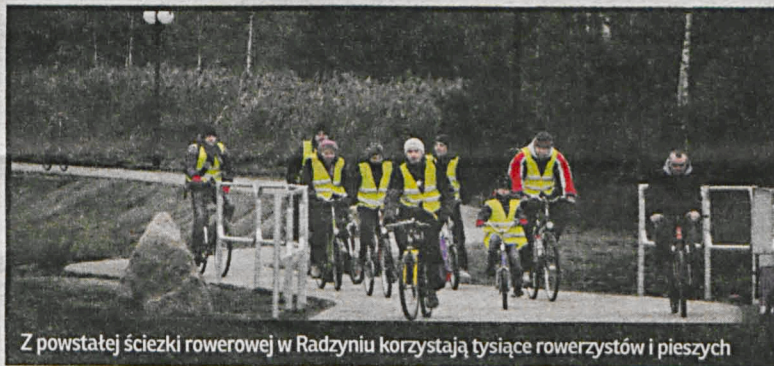
Z powstałej ścieżki rowerowej w Radzyniu korzystają tysiące rowerzystów i pieszych