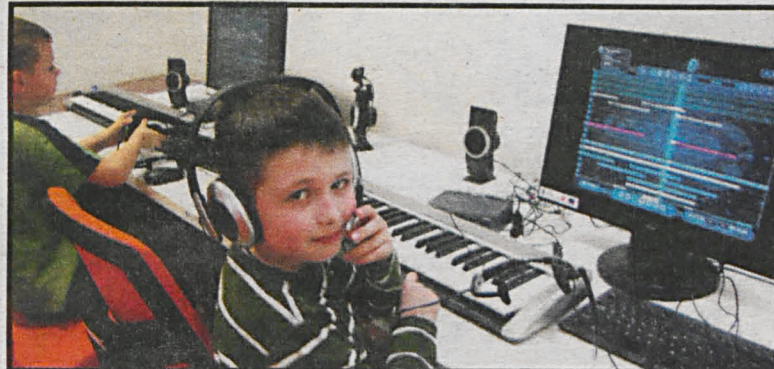
Bialska biblioteka multimedialna to najbardziej spektakularna inwestycja ostatnich lat