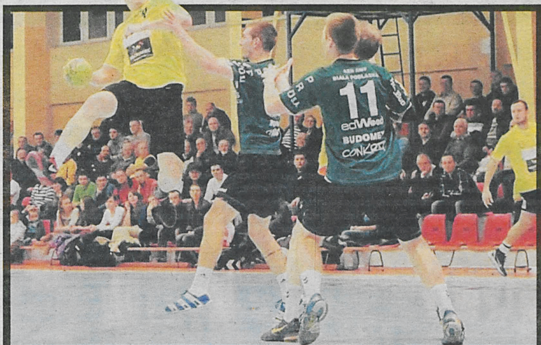
Dobra gra akademików w obronie to klucz do bytu w lidze