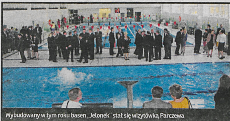
Wybudowany w tym roku basen „Jelonek” stał się wizytówką Parczewa

Inny sukces, to Zakład Zagospodarowania Odpadów „Adamki” w Białej, a kolejny, to rewitalizacja centrum miasta, Placu Wolności, ulicy Międzyrzeckiej, Lubelskiej oraz Jana Pawła II. Nie można też zapominać o ponad trzy kilometrowej ścieżce biegnącej wzdłuż rzeki Białki, która jest atrakcją