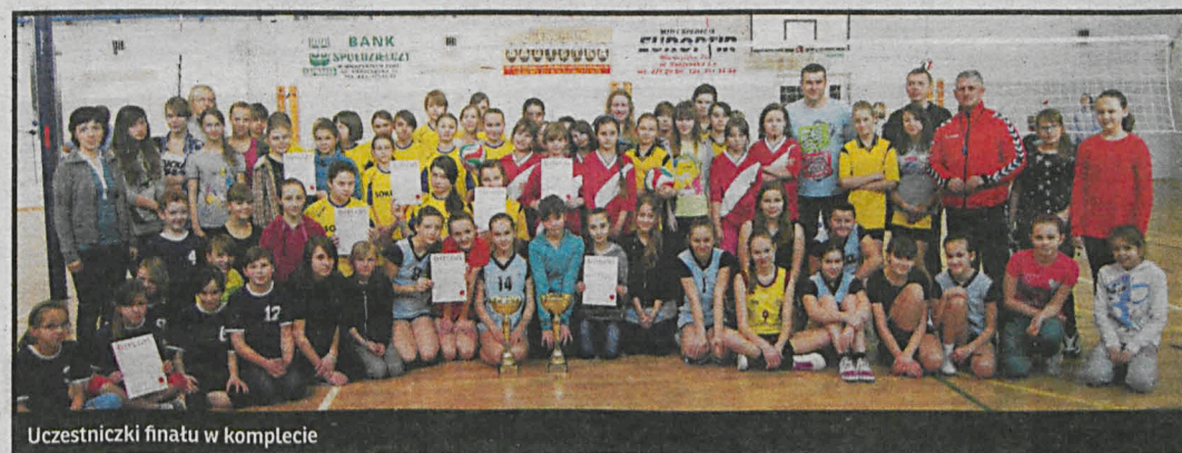
Uczestniczki finału w komplecie