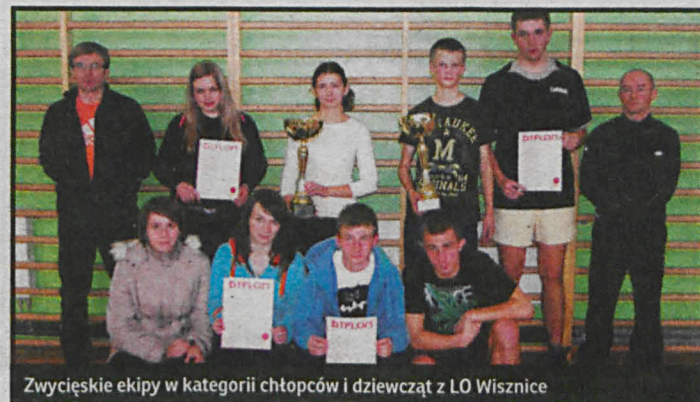
Zwycięskie ekipy w kategorii chłopców i dziewcząt z LO Wisznice