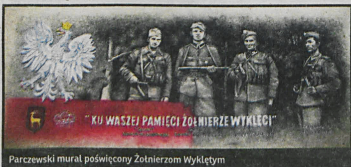
Parczewski mural poświęcony Żołnierzom Wyklętym