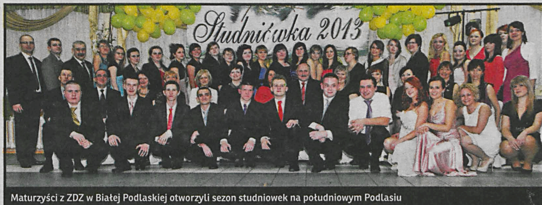
Maturzyści z ZDZ w Białej Podlaskiej otworzyli sezon studniówek na południowym Podlasiu

LO oraz ZDZ im. Krzysztofa Kamila Baczyńskiego otworzyły sezon studniówek na południowym Podlasiu