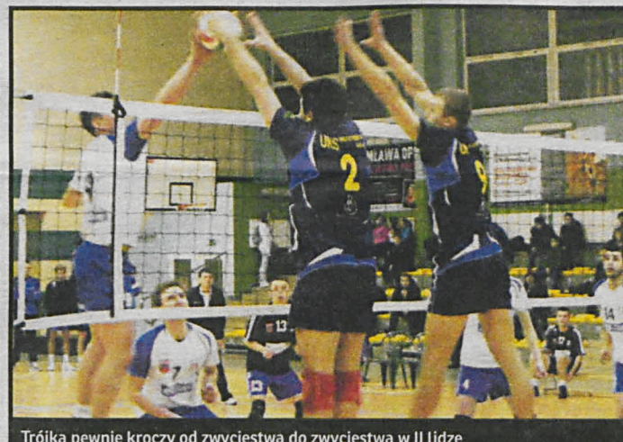
Trójka pewnie kroczy od zwycięstwa do zwycięstwa w II lidze