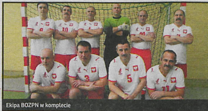
Ekipa BOZPN w komplecie

W Łosicach z okazji 35-lecia miejscowego Orła rozegrano halowy turniej piłki nożnej, w którym udział wzięli oldboye gospodarzy, działacze OZPN Siedlce i BOZPN Biała Podlaska. Ci ostatni wygrali turniej, pokonując rywali i zabierając nagrody indywidualne.