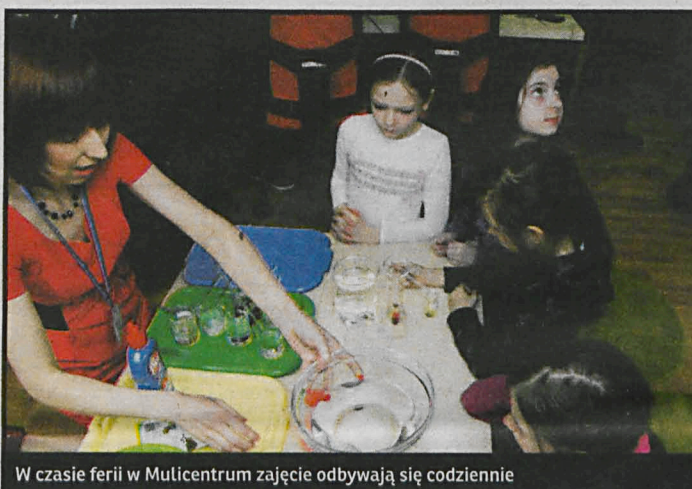
W czasie ferii w Multicentrum zajęcia odbywają się codziennie

tyki i robotyki, od 9 lat, Multimuzyka – warsztaty muzyczne z wykorzystaniem aplikacji komputerowych, od 7 lat, Multiszta – warsztaty plastyczne, praca na programach graficznych dla dzieci od 7 lat, Multinauka – eksperymenty i pokazy naukowe, od 7 lat, Multiśrodowisko – zajęcia z dziedziny ekologii, przyrody i biologii, od 4 lat oraz Multijęzyk – zajęcia edukacyjne z wykorzystaniem multimedialnych ćwiczeń interaktywnych, od 6 lat. Z myślą o młodzieży Multicentrum proponuje bezpłatne kursy dla gimnazjalistów z chemii oraz kurs przygotowujący do testów z j. angielskiego dla maturzystów. (szczegóły na stronie www.multicentrum.mbp.org.pl ). Inną „naukową” ofertę na czas ferii proponuje Państwowa Szkoła Wyższa. Od 11 do 15 lutego w PSW odbywać się będą zajęcia w ramach Akademii Maturzysty. Przez pierwszy tydzień ferii od 10 do 13.35 tegoroczni maturzyści mogą skorzystać z intensywnych zajęć z języka polskiego, matematyki oraz języków obcych prowadzonych przez pracowników dydaktycz-