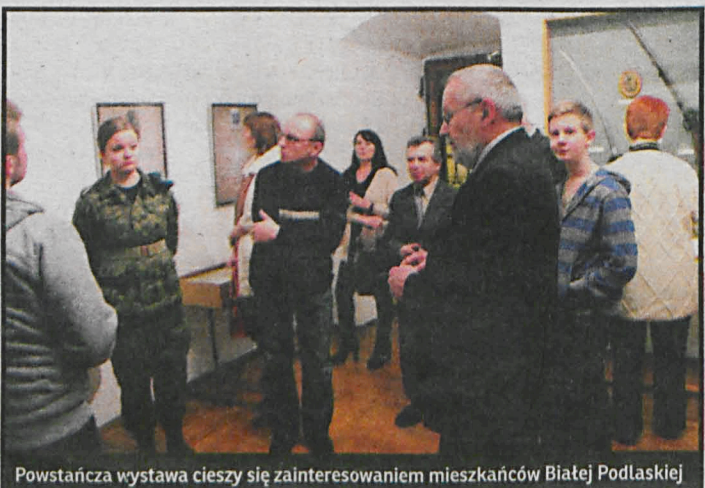
Powstańcza wystawa cieszy się zainteresowaniem mieszkańców Białej Podlaskiej