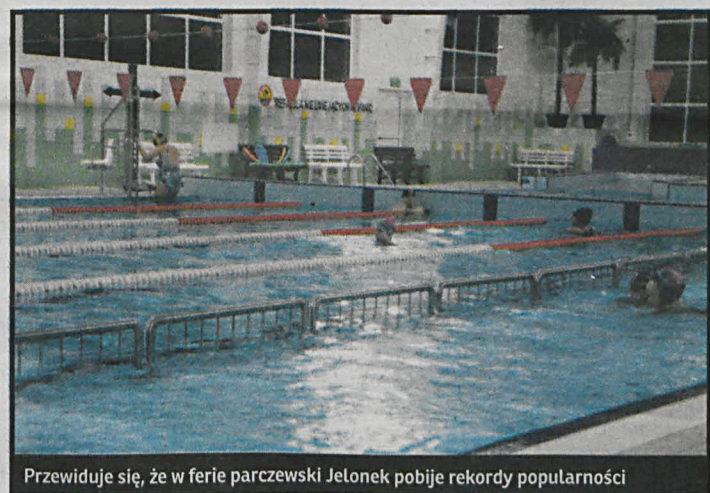
Przewiduje się, że w ferie parczewski Jelonek pobije rekordy popularności

EWELINA BURDA, ILONA GABRYLEWICZ, KAROL NIEWĘGŁOWSKI, WOJCIECH SUMLIŃSKI