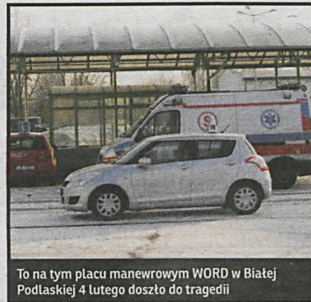
To na tym placu manewrowym WORD w Białej Podlaskiej 4 lutego doszło do tragedii