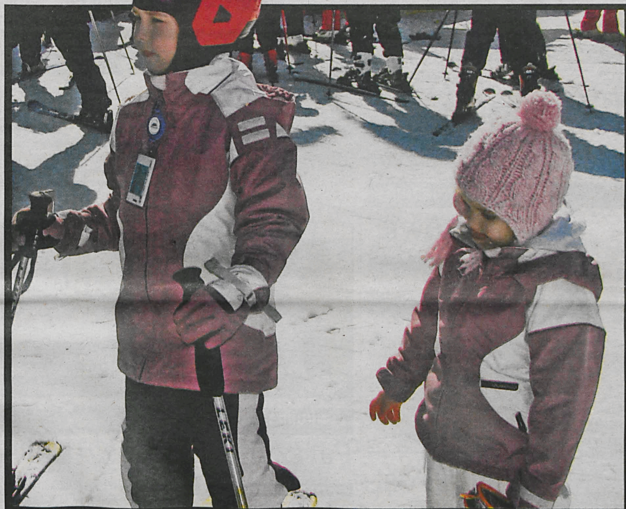
Zimowych ferii w naszym regionie nie trzeba spędzać przed ekranem telewizora