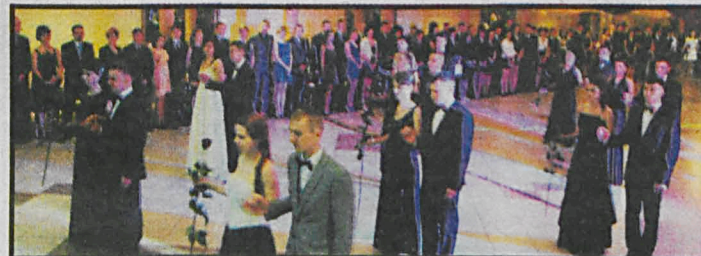
Ten niepowtarzalny wieczór pozostanie na zawsze w pamięci parczewskich maturzystów, tak jak na zawsze pozostają w pamięci lata młodości