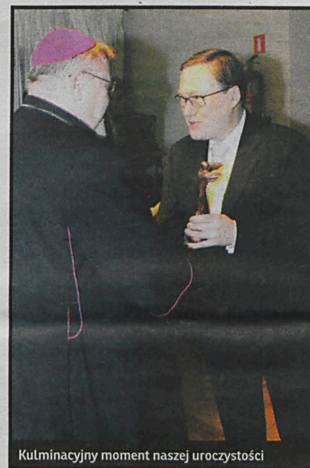
Kulminacyjny moment naszej uroczystości