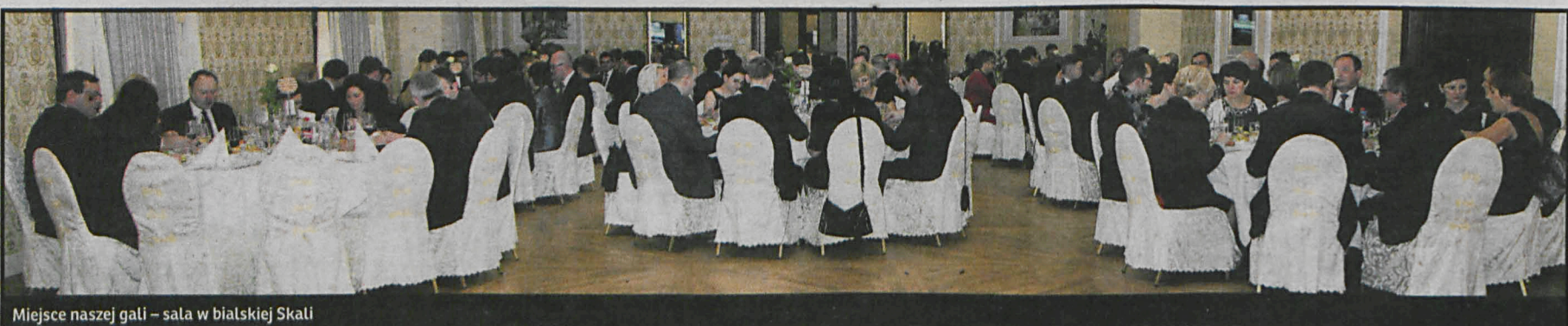
Miejsce naszej gali – sala w białskiej Skali