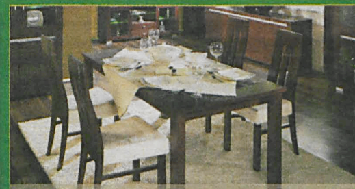
ROSSINI szer.90/dł.164-204/wys. 75 (cm)