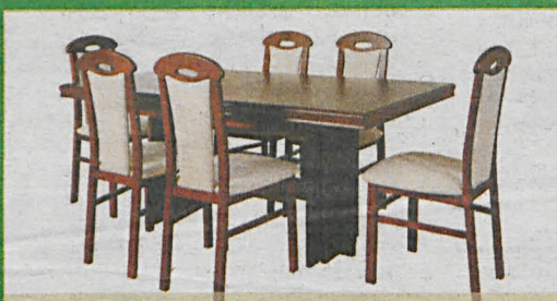
CAMPARI szer.95/dł.180-345/wys. 75,5 (cm)

HIT CENOWY! Cena 999 zł Rozkładany do 2.80 m Krzesła od 99 zł/szt.