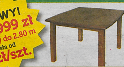
MALIBU szer.100/dł.100-280/wys. 75 (cm)