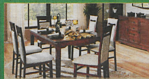
SANTORINI szer.95/dł.160-210/wys. 75 (cm)

stoły wykonane są z naturalnej okleiny: dąb, buk. Stoły i krzesła dostępne w różnych wybarwieniach.