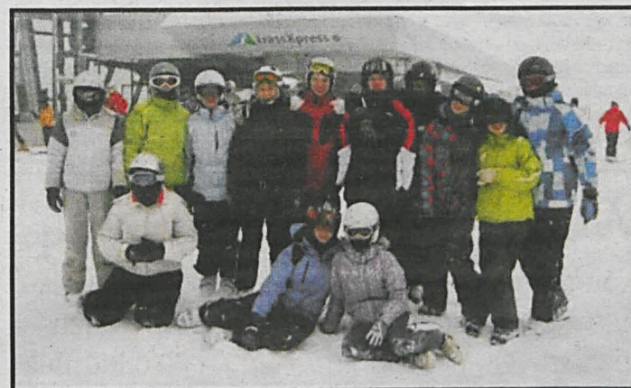
Zorganizowane formy spędzania wolnego czasu, to jeden ze znaków firmowych Katolickiego Gimnazjum i LO w Białej Podlaskiej

nie tylko w skali regionu. – Rozważamy taką ewentualność – mówi krótko. Przypomnijmy, że stale rosnąca liczba uczniów zainteresowanych edukacją w Katolickim Gimnazjum i LO im. Cypriana Kamila Norwida w dobie, gdy w wielu innych placówkach brakuje nowych adeptów, to nie jedyny sukces białskich szkół katolickich. W dorocznym rankingu Rzeczypospolitej najlepszych liceów w Polsce, opublikowanym kilka tygodni temu, białskie Katolickie LO im. C. K. Norwida znalazło się na 53 miejscu w kraju i zarazem na 2 miejscu w województwie lubelskim. Spośród wszystkich szkół trzech powiatów południowego Podlasia – białskiego, parczewskiego, radzyńskiego – w gronie dwustu najlepszych liceów w Polsce znalazło się jeszcze tylko białskie LO im. Jana Ignacego Kraszewskiego, które uplasowało się na 122 miejscu. Sukcesy osiąga także szkoła podstawowa o profilu katolickim w Sielczyku, pierwsza