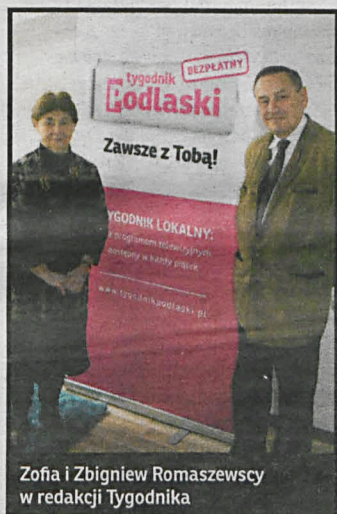
Zofia i Zbigniew Romaszewscy w redakcji Tygodnika