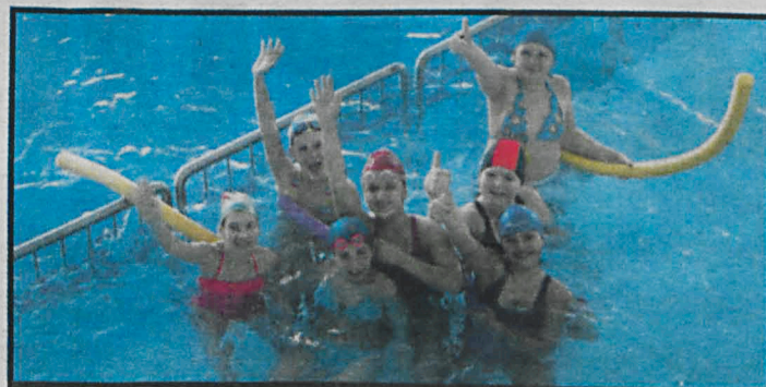
Codziennie z oferty „Jelonek” w ferie korzystało pół tysiąca osób

Skończyły się ferie, nadszedł czas podsumowań i oceny ich przebiegu. Naszym zdaniem najlepszym pomysłem wykazało się kierownictwo kompleksu sportowo-rekreacyjnego „Jelonek”, którego pomysłu na feryjną promocję okazał się strzałem w dziesiątkę. Promocja polegająca na tym, iż grupy szkolne oraz dwójki dzieci pod opieką osoby dorosłej mogły bezpłatnie korzystać ze wszystkich atrakcji na obiekcie, ściągająca na basen setki dzieci i młodzieży z gminy. – Frekwencja była wspaniała. Jesteśmy bardzo zadowoleni, że nasz pomysł spotkał się z tak dużym zainteresowaniem. Codziennie na basen przychodziło ponad 350 osób więcej, niż zazwyczaj. Nawet konserwatorzy przyjeżdżający z Lublina, mający pod opieką