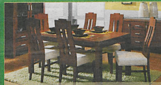
BELLINI szer.90/dł.160-200/wys. 75 (cm)