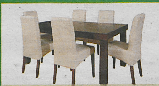
MARTINI szer.95/dł.170-260/wys. 73 (cm)