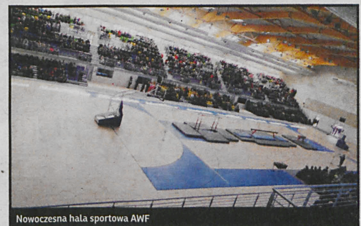
Nowoczesna hala sportowa AWF

Po co więc ta hala? Być może zadziała mobilizująco na naszych reprezentantów w halowych grach zespołowych i już niebawem będziemy cieszyć z wygranych – na najwyższym szczeblu krajowym – siatkarzy, siatkarek, piłkarzy ręcznych czy koszykarzy. Nim jednak z obecnych drugich i trzecich lig przebiją się wyżej, na organizowanych w hali widowiskach będzie można też zarabiać, gdyż skończy się karencja unijna. Tak czy inaczej, hala więc się przyda. Ale raczej z myślą o przyszłości.