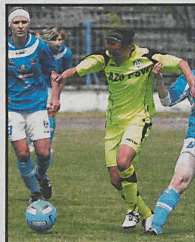
Piłkarki AZS PSW mają solidne wsparcie finansowe

ringu pomiędzy spółką Apella, przedstawicielem Kasy Stefczyka i Fundacji Stefczyka, a Państwową Szkołą Wyższą im. Papieża Jana Pawła II w Białej Podlaskiej. Przedmiotem umowy jest sponsorowanie działalności sportowej KU AZS PSW, w tym głównie drużyny piłki nożnej kobiet. Dzięki wsparciu Kasy białka ekipa będzie mogła dokonać realnych wzmocnień i już niebawem włączyć się do walki o medal mistrzostw Polski, co stanowiłoby zwieńczenie wieloletniej pracy wielu osób. W klubie w ostatnim czasie doszło do