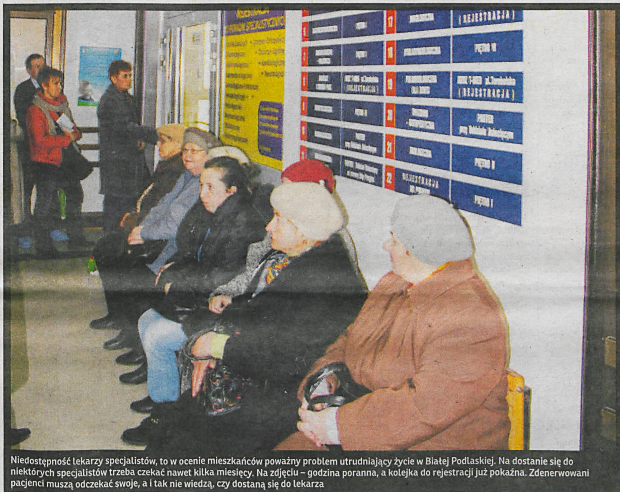
Niedostępność lekarzy specjalistów, to w ocenie mieszkańców poważny problem utrudniający życie w Białej Podlaskiej. Na dostanie się do niektórych specjalistów trzeba czekać nawet kilka miesięcy. Na zdjęciu – godzina poranna, a kolejka do rejestracji już pokaźna. Zdenerwowani pacjenci muszą odczekać swoje, a i tak nie wiedzą, czy dostaną się do lekarza