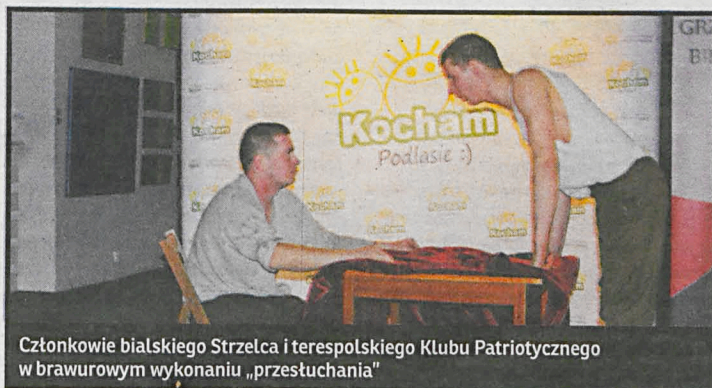
Członkowie bialskiego Strzelca i terespolskiego Klubu Patriotycznego w brawurowym wykonaniu „przesłuchania”