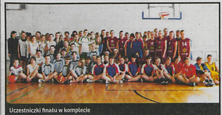
Uczestniczki finału w komplecie