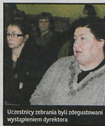
Uczestnicy zebrania byli zdeguowani wystąpieniem dyrektora