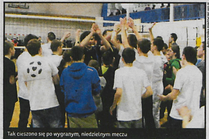
Tak cieszą się po wygranym, niedzielnym meczu

zegoś takiego nie pamiętają najstarsi kibice piłki nożnej w naszym regionie. Trzecia liga od miesiąca powinna grać, rozegrane powinny być cztery kolejki,