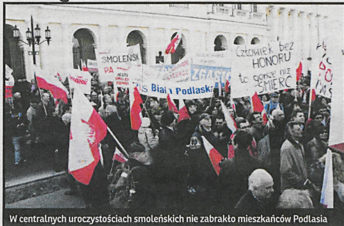
W centralnych uroczystościach smoleńskich nie zabrakło mieszkańców Podlasia