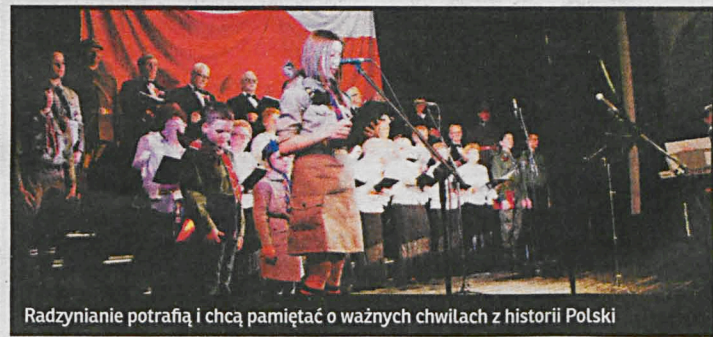
Radzynie potrafią i chcą pamiętać o ważnych chwilach z historii Polski