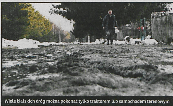
Wiele białskich dróg można pokonać tylko traktorem lub samochodem terenowym