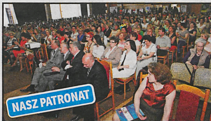
Zainteresowanie konferencją przerosło najśmielsze oczekiwania organizatorów