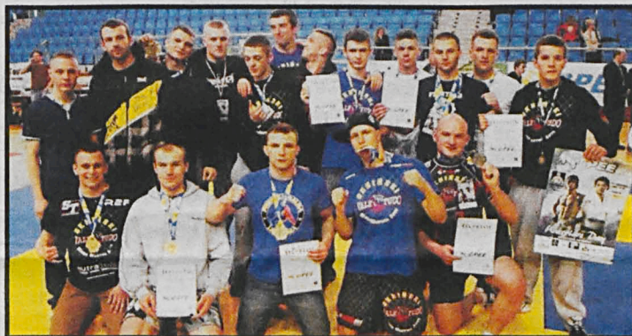
Zawodnicy Okniński Team