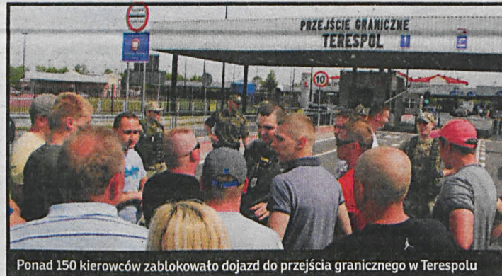
Ponad 150 kierowców zablokowało dojazd do przejścia granicznego w Terespole