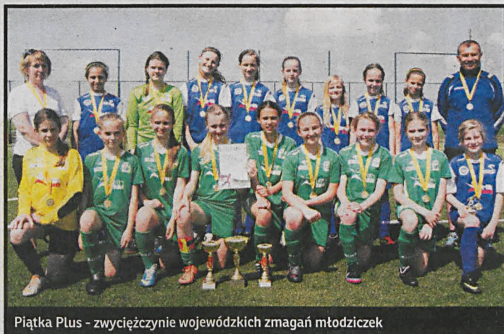
Piątka Plus - zwyciężczynie wojewódzkich zmagania młodzieżek