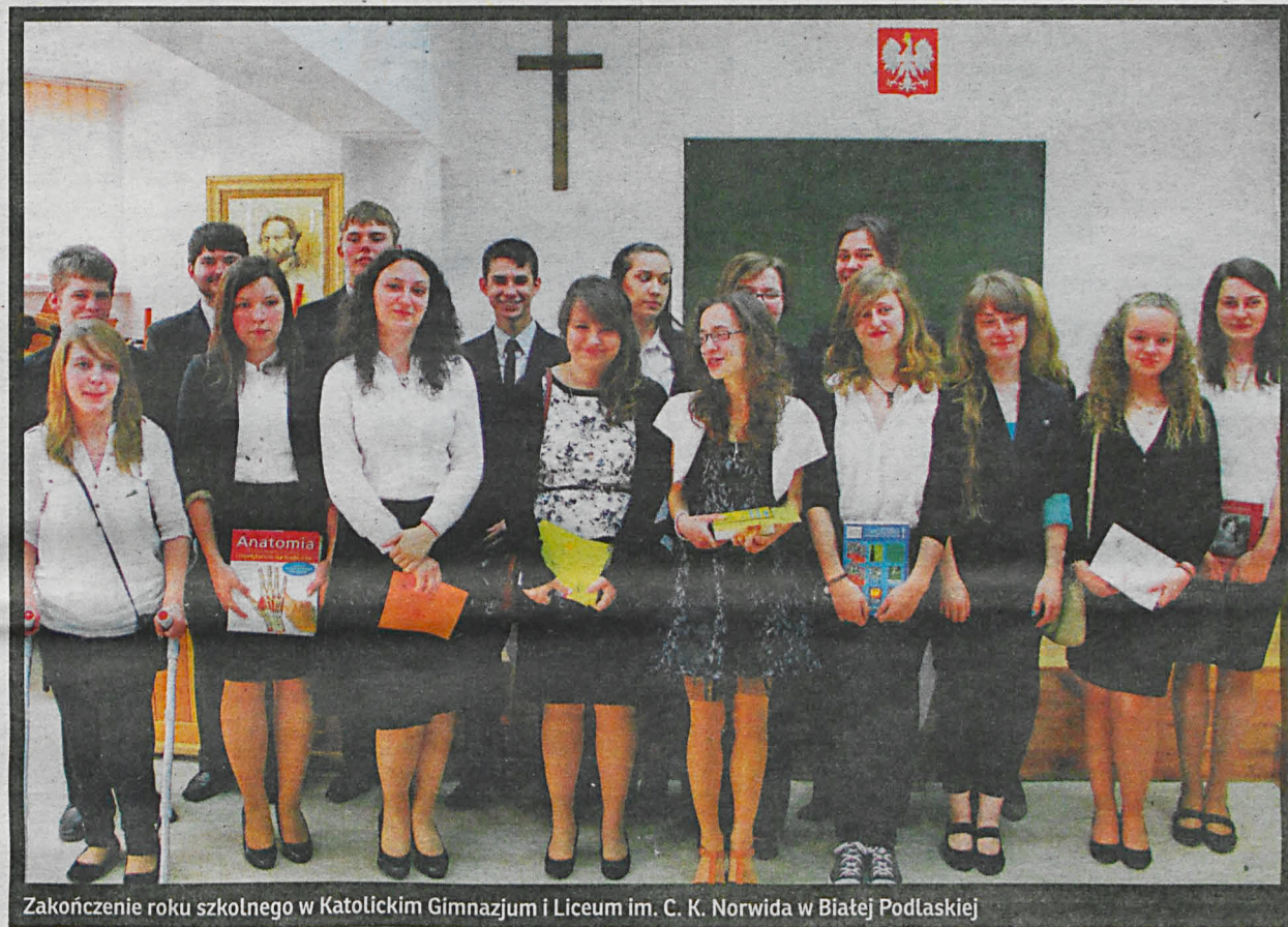
Zakończenie roku szkolnego w Katolickim Gimnazjum i Liceum im. C. K. Norwida w Białej Podlaskiej