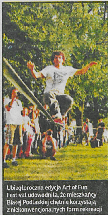
Ubiegłoroczna edycja Art of Fun Festival udowodniła, że mieszkańcy Białej Podlaskiej chętnie korzystają z niekonwencjonalnych form rekreacji