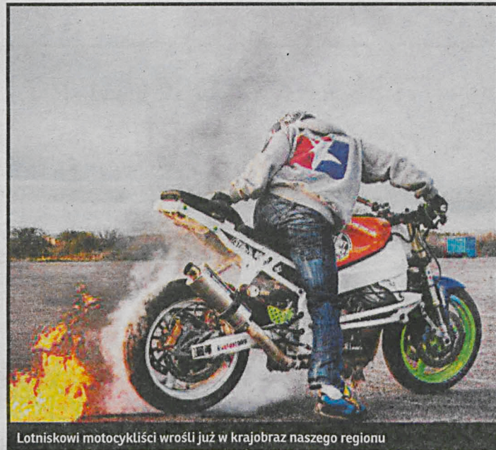
Lotniskowi motocykliści wrośli już w krajobraz naszego regionu

Podlaskiej. W niedzielę 21 lipca po treningach w godzinach od 16.00 do 16.30 odbędzie się wyścig dla 25 zawodników z najlepszymi czasami okrążenia toru w klasie do 600 cm. Od 16.30 do 17.00 wyścig dla 25 zawodników z najlepszymi czasami okrążenia toru w klasie powyżej 600 cm.