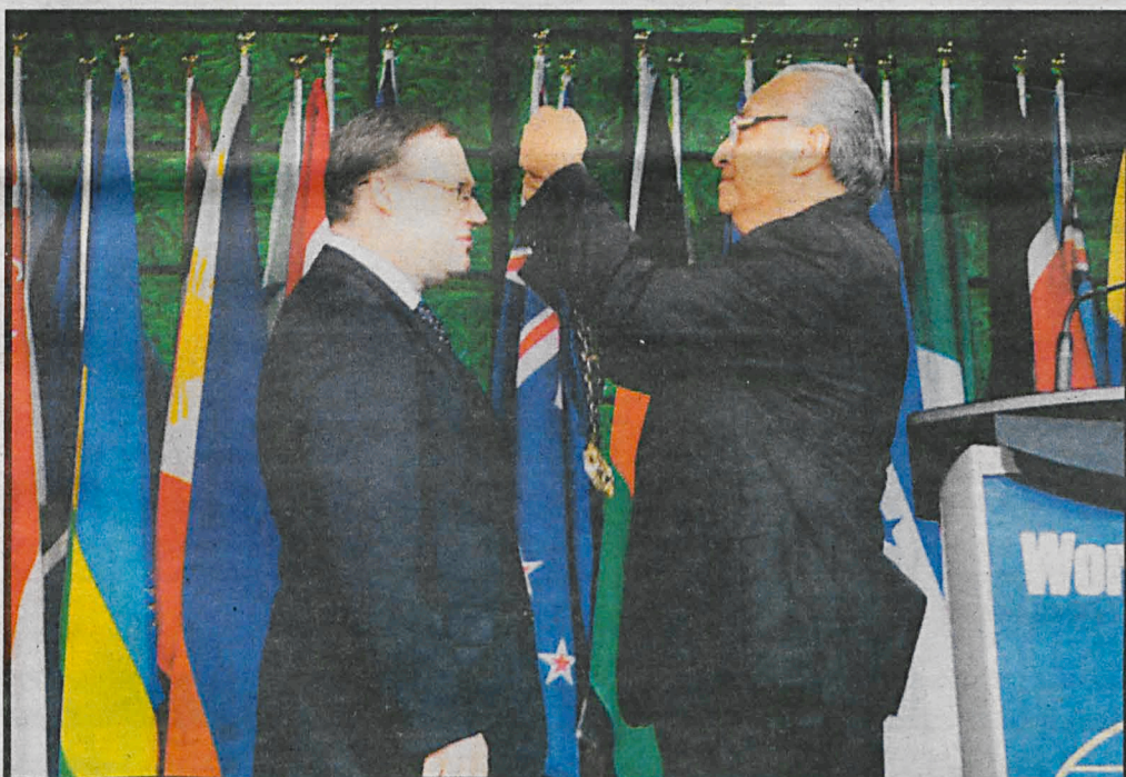
Stanowisko przewodniczącego WOCCU swoją rangą jest porównywalne do szefa MFW czy prezesa Banku Światowego

15 lipca w Ottawie Grzegorz Bierecki, senator z Podlasia, został wybrany na stanowisko przewodniczącego Światowej Rady Unii Kredytowych (WOCCU – World Council of Credit Unions). Wybór twórcy spółdzielczych kas oszczędnościowo-kredytowych w Polsce na stanowisko przewodniczącego jednego z największych zrzeszeń instytucji finansowych świata, to między innymi konsekwencja jego zaangażowania w rozwój ruchu spółdzielczości finansowej w Europie Środkowo-Wschodniej oraz doprowadzenia do dynamicznego rozwoju SKOK-ów w Polsce.