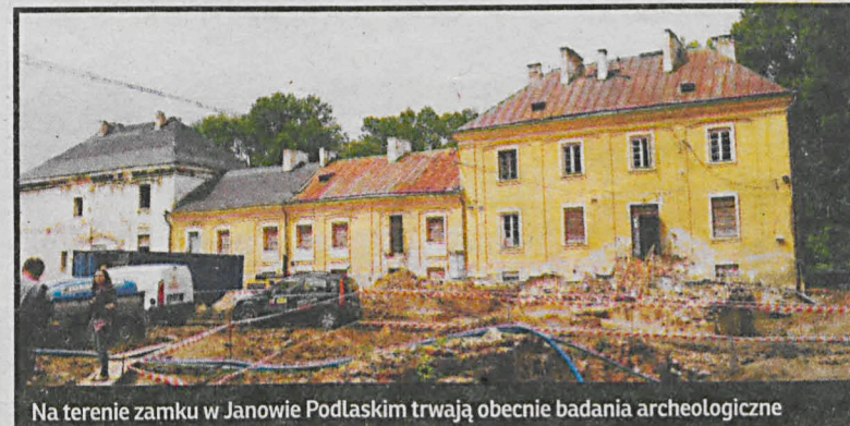
Na terenie zamku w Janowie Podlaskim trwają obecnie badania archeologiczne