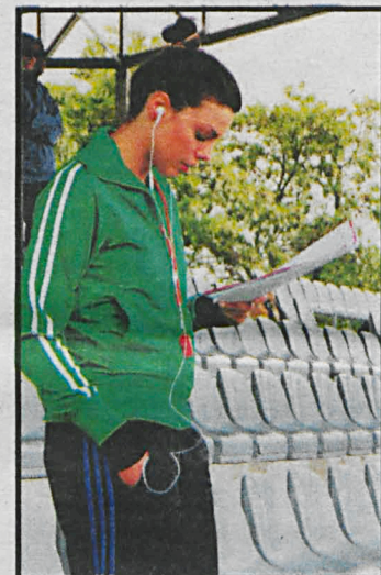
Ekipa filmowa ponownie przyjedzie do Białej 23 lipca. Tego dnia sceny będą kręcone m.in. na stadionie Podlasia