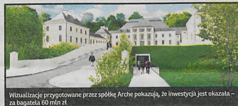
Wizualizacje przygotowane przez spółkę Arche pokazują, że inwestycja jest okazata – za bagatelę 60 mln zł

powstanie łącznie 70 pokoi hotelowych, w tym 10 apartamentów historycznych, zaś pod dziedzińcem mieścić się będzie podziemna sala konferencyjna o powierzchni ponad 800 m 2 – wylicza. Jak zapowiada, posiadłość zostanie nie tylko zmodernizowana, ale również rozbudowana m.in. o korpus główny który łączy oficyny. – Liczę, że z naszej oferty skorzystają firmy i klienci indywidualni, nie tylko z Polski. Zamierzamy mocno rozbudować usługi SPA, tak aby pobyt