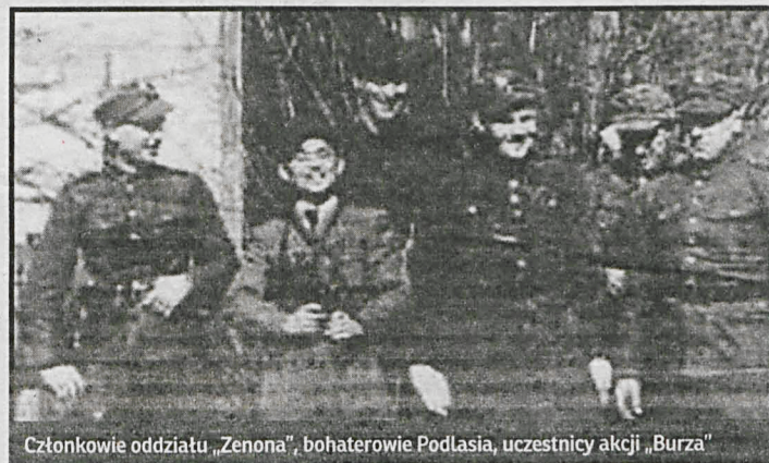
Członkowie oddziału „Zenona”, bohaterowie Podlasia, uczestnicy akcji „Burza”

Podlaska – Łomazy w rejonie Dubowa, a dzień później rozbił okupantów na trakcie Biała Podlaska – Parczew, zabijając 25 Niemców, 5 raniąc i 7 biorąc do niewoli. Dzień później część zgrupowania „Zenona” uderzyła na kolumnę artylerii, zdobywając 4 działa i biorąc do niewoli 10 Niemców, a w tym czasie druga część, zdobyła pod miastem 12 dział, zabijając 20 Niemców i biorąc do niewoli 80. Kolejną bitwę oddział „Zenona” stoczył 25 lipca, pod Janówką, gdzie Polacy zniszczyli samochód pancerny i 7 samochodów ciężarowych, zabijając 45 Niemców. Nie miały być też udział żołnierzy „Zenona” w zdobyciach terenowych. Między innymi 26 lipca podlascy żołnierze AK wzięli udział w wyzwoleniu Międzyrzecza Podlaskiego, zajęli Łuków i Radzyń Podlaski. Po wkroczeniu Rosjan na południowe Podlasie – po-