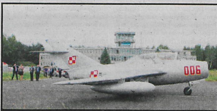
Czy białskie lotnisko ożyje wreszcie na stałe, a nie tylko przy okazji wyścigów motocyklowych