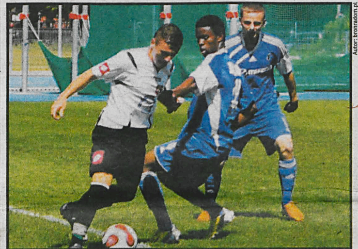
Orleńscy sparowali w Radomiu z tamtejszą Bronią

W Lutni pojawili się dwaj młodzi zawodnicy w okresie przygotowawczym. W obu uległo rywalom 0:1. Taki wynik, uzyskany z drugoligowym Motorem, napawa lekkim optymizmem, ale przegrana z Lutnią – nakazuje ostrożność.