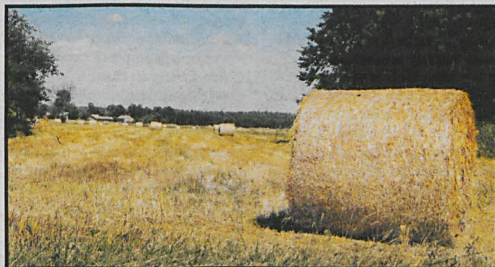
Żniwa, żniwa, i już po żniwach...

Uboższych rolników bulwersuje sprawa, przed którą nie tylko ogólnopolskie media chowają głowę w piasek. Chodzi o zasiłki rolnicze, i to nie o kwestie proceduralne, że kiedyś wypłacał je KRUS, a obecnie czynią to gminne ośrodki pomocy społecznej. Rząd z 2,2 tys. do 2,7 tys. podwyższył do-