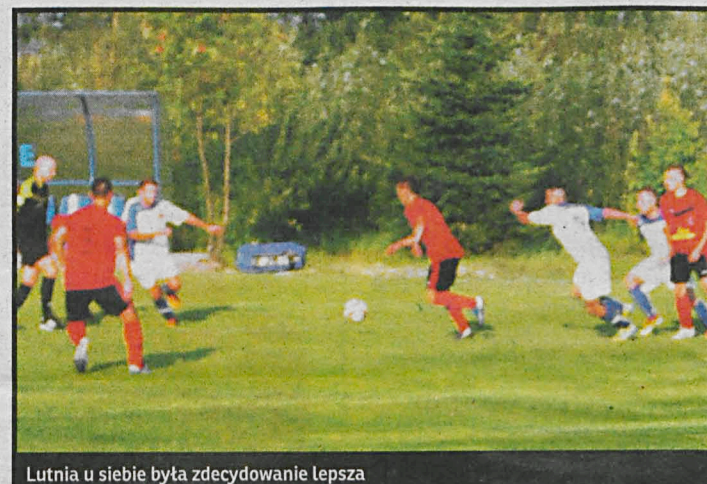
Lutnia u siebie była zdecydowanie lepsza