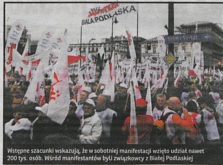
Wstępne szacunki wskazują, że w sobotniej manifestacji wzięto udział nawet 200 tys. osób. Wśród manifestantów byli związkowcy z Białej Podlaskiej

chód ciągnął się na kilka kilometrów – dodaje Pniewski. Przypomnijmy, że związki domagają się m.in. „rzeczywistego, a nie pozorowanego” dialogu społecznego w ramach Komisji Trójstronnej oraz odwołania ministra pracy i przewodniczącego komisji Władysława Kosiniaka-Kamysza. Kolejny postulat dotyczy wycofania zmian w kodeksie pracy, pozwalających na rozliczanie czasu pracy w okresie dwunastomiesięcznym, a nie czteromiesięcznym, jak było wcześniej. Związki chcą także skrócenia wieku emerytalnego, podniesienia minimalnej pensji, ograniczenia zatrudnienia na umowach cywilnoprawnych, zwiększenia wydatków na pomoc dla bezrobotnych, poprawy dostępu do bezpłatnej edukacji i służby zdrowia. Manifestanci złożyli petycję z postulatami w Pałacu Prezydenckim. EB