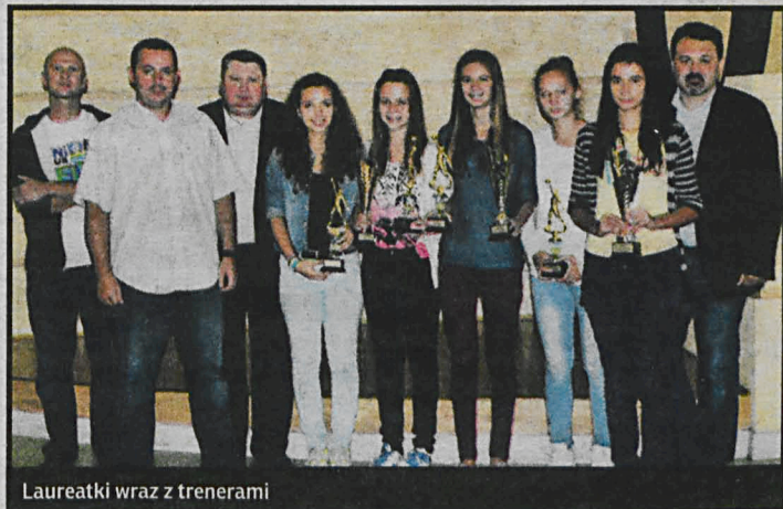
Laureatki wraz z trenerami