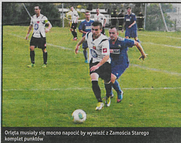
Orleża musiały się mocno napocić by wywieźć z Zamościa Starego komplet punktów

Wodnik Siemień – Grom Sosnowica, LZS Sielczyk – Lutnia II Piszczac, Kansas Konstantynów – Absolwent Domaszewnica. Wszystkie mecze w niedzielę o godz. 16.