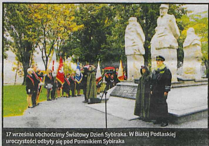
17 września obchodzimy Światowy Dzień Sybiraka. W Białej Podlaskiej uroczystości odbyły się pod Pomnikiem Sybiraka

Związku Sybiraków doskonale pamięta mroczną przeszłość. – Jechałem w pociągu towarowym, byłem bez ojca i matki, byłem sierotą. Na Sybir trafiłem po trzytygodniowej podróży wspomina – wspomina. Na okolicznościowym spotkaniu przy pomniku odczytano Apel Poległych i złożono kwiaty. Członkowie Związku Sybiraków ze smutkiem przyznają, że z roku na rok ich grono się kurczy. Jednak ci, którzy zostali z niesłabnącym poruszeniem opowiadają o czasie spędzonym na obcej ziemi. – Trafiłem do Kazachstanu w 1940 roku jako siedmiomiesięczne dziecko razem z rodzicami, siostrą i dziadkiem. Po wycieńczającej kilkutygodniowej podróży pociągami byłem poważnie chora, rodzice myśleli, że umrę. Skierowano mnie do polikliniki, której szefową okazała się Polka. Dostałam od niej elementarz do nauki polskiego. Mieszkaliśmy w ziemiance. Ojciec pracował w Kazachstanie jako fryzjer, siostra zatrudniła się w kopalni złota. W międzyczasie mama