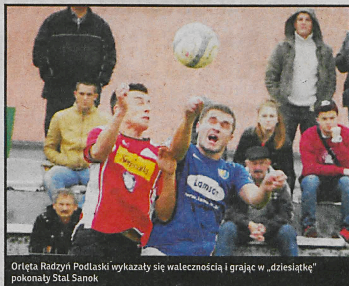
Orlęta Radzyn Podlaski wykazały się walecznością i grając w „dziesiątkę” pokonały Stal Sanok