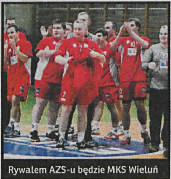
Rywalem AZS-u będzie MKS Wieluń

Po dwóch wygranych na wyjeździe z Włóknierzem i u siebie z Prusem, podopieczni Sławomira Bodasińskiego jadą do Wielunia. Tam w sobotę zagrają z miejscowym MKS. Rywal niełatwy i o komplecie punktów trzeba będzie mocno powalczyć. Nasi rywale do tej pory przegrali z Sierpcu z Mazurem 27:30 i wygrali u siebie ze Szczypiornikiem 31:13.