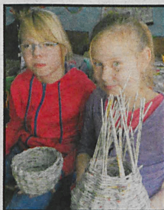
Niedzielną prezentacją przedmiotów