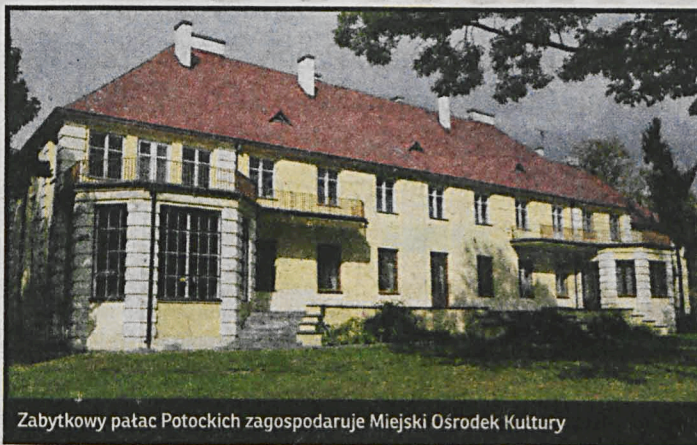
Zabytkowy pałac Potockich zagospodaruje Miejski Ośrodek Kultury

Lokalne podatki i opłaty pošty w górę Trzeba było dotożyć do utrzymania białego Orlika, który ostatniej zimy w celu przyciągnięcia chętnych przeniesiono z obrzeży miasta do centrum. Rozczarowuje liczba osób korzystających ze stoku narciarskiego. Ponadto wystawiane na sprzedaż działki w „Strefie inwestycji” nie cieszą się nadmierną popularnością – dotychczas udało się sprzedać jedną. – Niestety, inwestorzy nie pchają się do nas drzwiami i oknami, więc musimy