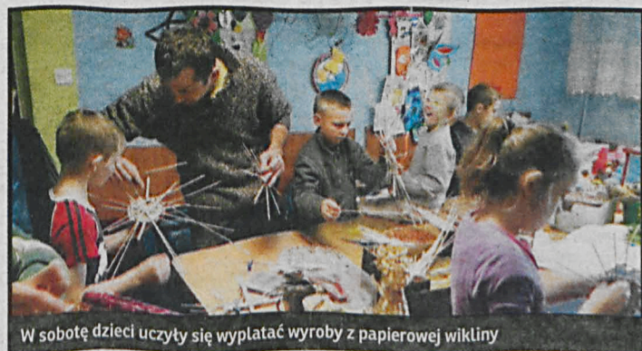
W sobotę dzieci uczyły się wyplatać wyroby z papierowej wikliny

Pozostali poznawali techniki wyplatania choinki, królika oraz serduszka z papierowej wikliny. Warsztaty stanowiły również okazję do wzajemnego poznania się. Obie strony już cieszą się na kolejne spotkanie.