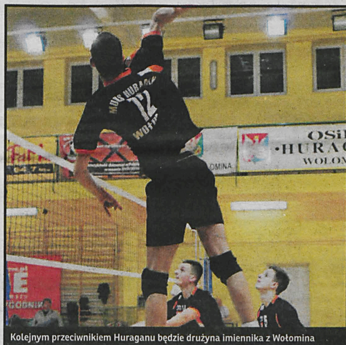
Kolejnym przeciwnikiem Huraganu będzie drużyna imiennika z Wołominą