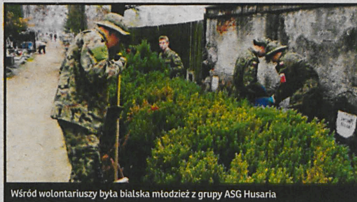
Wśród wolontariuszy była białska młodzież z grupy ASG Husaria