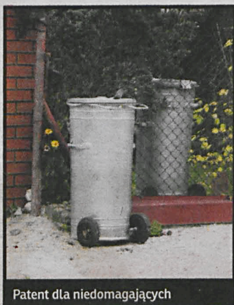
Patent dla niedomagających

Dla ludzi zdrowych i silnych wystawianie pojemników ze śmieciami za bramę posesji w dniach ich odbioru przez służby „Komunalnika” nie nastręcza większych trudności. Problem mają ludzie w podeszłym wieku lub chorzy, którzy sobie z tym nie radzą. Za bramę ogrodzeń pracownicy przedsiębiorstwa wchodzić nie chcą w obawie przed psami, biegającymi samopas po ogrodzie. – Kto przy zdrowych zmysłach nie zamyka wówczas psa: przecież to nasz interes, inaczej pojemniki nie zostaną opróżnione – skarżą się starsi właściciele domków. – Ale służby i tak nie wchodzi, a my nie mamy siły wystawiać pojemników i nie zawsze ktoś pomocny znajdzie się pod ręką... Osoby, znajdujące się w takiej sytuacji, mogą próbować ją zmienić. W Referacie Gospodarowania Odpadami urzędu miej-