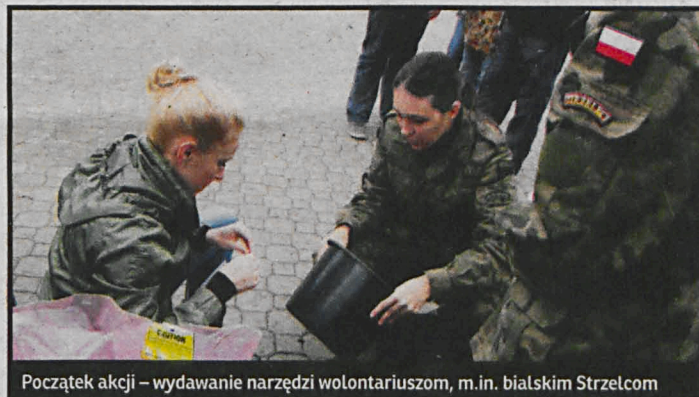
Początek akcji – wydawanie narzędzi wolontariuszom, m.in. białskim Strzelcom