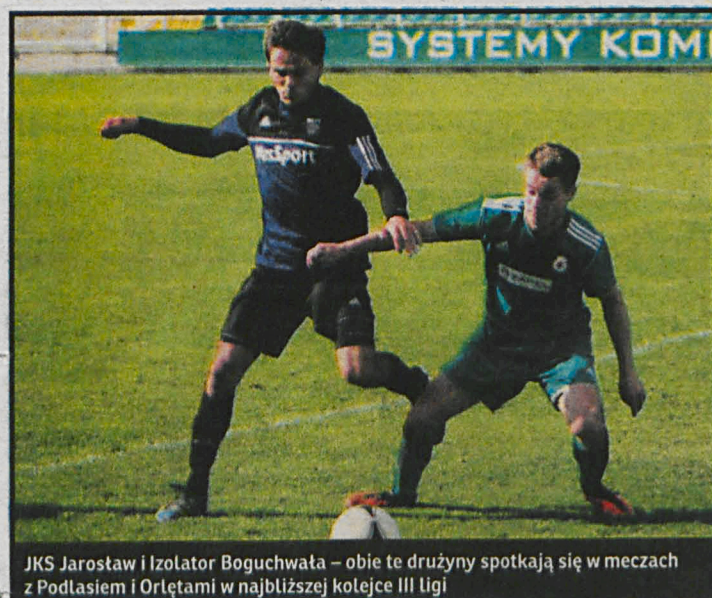
JKS Jarosław i Izolator Boguchwała – obie te drużyny spotkają się w meczach z Podlasiem i Orłętami w najbliższej kolejce III ligi