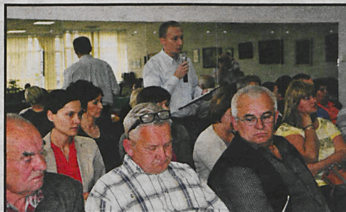
Podczas sesji rady miasta mieszkańcy przypominają władzom o swoich problemach

Odczytaną przez niego petycję poparły swoimi podpisami 144 osoby. Tego, czy znajdą się pieniądze, dowiemy się po zakończeniu prac nad przyszłorocznym budżetem. Jak na razie jest nadzieja na rozpoczęcie w przyszłym roku budowy kanalizacji deszczowej w ul. Pułaskiego. Ponadto część placu dworcowego oraz zlokalizowana w pobliżu ul. Kolejowa zo-