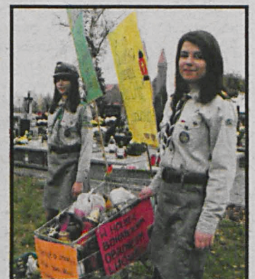
Mieszkańcy Radzyna z dużą zycielnością odnieśli się do akcji prowadzonej przez harcerzy

się z żyjącymi tam Polakami – świadkami wielu historycznych wydarzeń. Wiele osób przy tej okazji odkrywało, że ich korzenie tkwią po drugiej stronie granicy, teraz już białoruskiej. O poległych na kresach polskich patriotach pamiętają harcerze z 1 Szczępu ZHP Infinity im. hm.