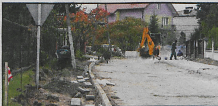
Mieszkańcy „Osiedla za szpitalem” wkrótce korzystać będą z nowych chodników i ulic

rodowego programu przebudowy dróg lokalnych – Etap II Bezpieczeństwo – Dostępność – Rozwój”. Mieszkańcy tzw. „Osiedla za szpitalem” już pod koniec listopada będą korzystać z nowych chodników i ulic. W ramach prac zostaną wykonane ponadto zjazdy do działek. Połączenie „Osiedla za szpitalem” z „Osiedlem przed szpitalem” znacząco poprawi lokalną komunikację. Całkowita wartość inwestycji to 1 180 tys. zł. IG