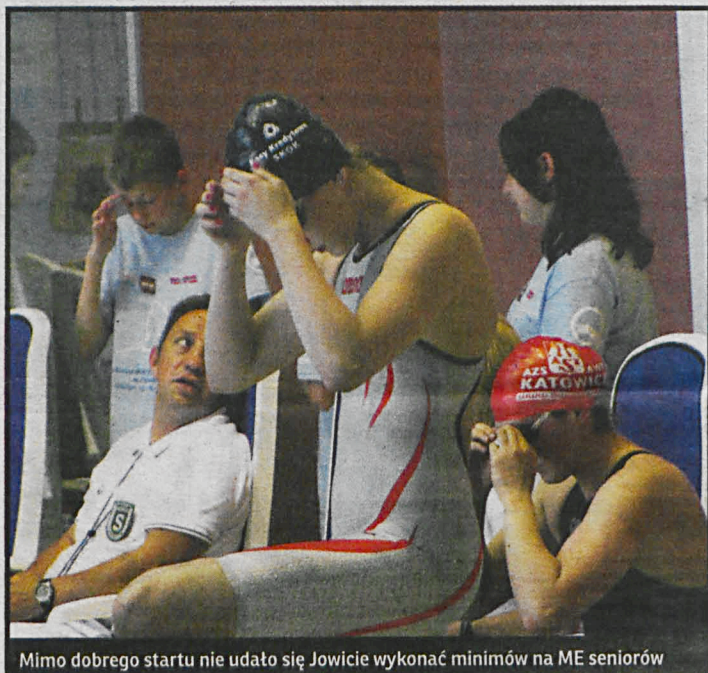
Mimo dobrego startu nie udało się Jowicie wykonać minimów na ME seniorów

W połowie grudnia bialska pływaczka wystartuje w Zimowych Mistrzostwach Polski Seniorów i Młodzieżowców, które odbędą się w Ostrowcu Świętokrzyskim.