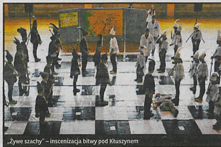
„Żywe szachy” – inscenizacja bitwy pod Kłuszynem