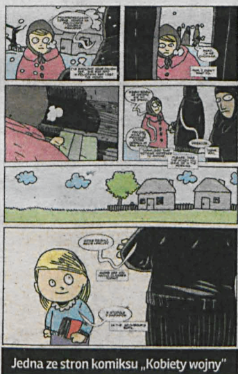
Jedna ze stron komiksu „Kobiety wojny”

Planowany nakład „Kobiet Wojny” będzie liczył 1000 sztuk. Trafi do szkół i bibliotek. Wybrane plansze, wydrukowane w dużych formatach, będą pokazywane w lubelskich szkołach, bibliotekach i ośrodkach kultury. W Terespolu będzie je można zobaczyć już 8 grudnia