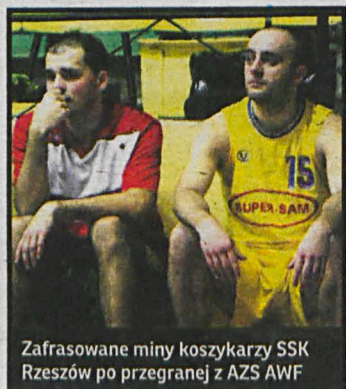
Zafrasowane miny koszykarzy SSK Rzeszów po przegranej z AZS AWF

Wygrywając w Rzeszowie 93:84, koszykarze AZS AWF Biała Podlaska awansowali na trzecie miejsce w tabeli III ligi. W najbliższą niedzielę akademicy zagrają towarzysko z OSSM PZKosz Stalowa Wola. Spotkanie rozegrane zostanie na hali przy ul. Akademickiej 2 o godz. 16.