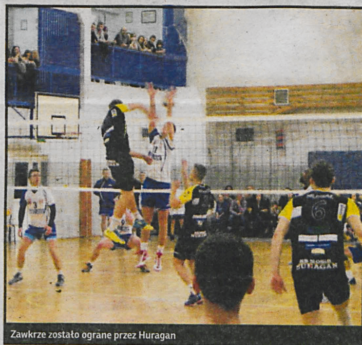
Zawkrze zostało ograńe przez Huragan