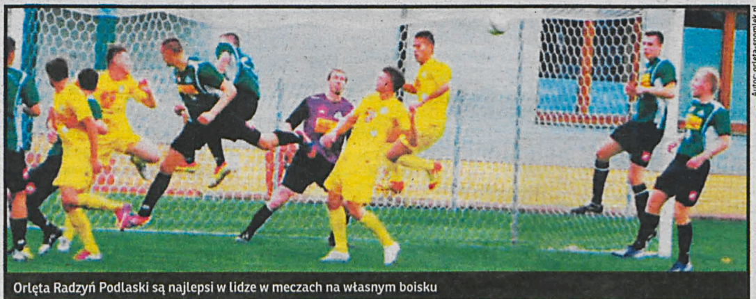
Orłęta Radzyń Podlaski są najlepsi w lidze w meczach na własnym boisku