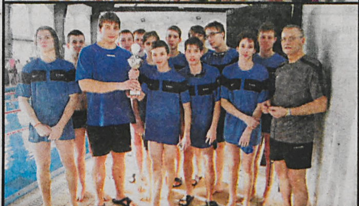
Zwycięskie bialskie sztafety