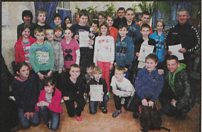
Uczestnicy obu finałów