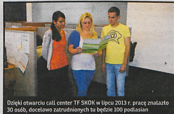
Dzięki otwarciu call center TF SKOK w lipcu 2013 r. pracę znalazło 30 osób, docelowo zatrudnionych tu będzie 100 podlasiaków