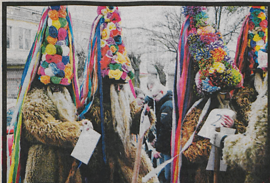
Zwyczaj pożegnania starego roku przez brodacze od wielu lat kulturywują mieszkańcy gminy Stawiatyce

Zdecydowana większość podlaskich domów podczas świąt gościła grupę kołodników, przebranych za Świętą Rodzinę, anioła, diabła i króla Heroda. Ten zwyczaj podtrzymują dzieci i młodzież. Odwiedzają domy, śpiewają kolędy, składają życzenia domownikom i zbierają datki. W Sławatyczach życzenia mieszkańcom składają brodacze.