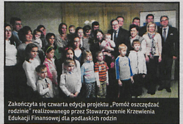
Zakończyła się czwarta edycja projektu „Pomóż oszczędzać rodzinie” realizowanego przez Stowarzyszenie Krzewienia Edukacji Finansowej dla podlaskich rodzin

◆ Prawie 14 mln zł straci województwo lubelskie w wyniku zmian w ustawie o tzw. Janosikowym. Nowelizację uchwalili Sejm głosami posłów koalicji PO-PSL.