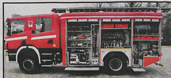
Dwa nowe samochody ratowniczo-gaśnicze z kompletnym wyposażeniem otrzymali białscy strażacy

Strażacy z białskiej Komendy Miejskiej Państwowej Straży Pożarnej najwyraźniej byli grzeczni, gdyż w grudniu otrzymali cenne prezenty – samochody i sprzęt. Te nowe cacka techniczne dają większe poczucie bezpieczeństwa mieszkańcom. Strażacy otrzymali dwa ciężkie samochody ratowniczo-gaśnicze GCBA-Rt 5/32 SCANIA P360 CB 4X4 oraz GCBA 5/36 MAN typ TGM 4X4 z kompletnym wyposażeniem. Głównym jego elementem jest kontener proszkowy przeznaczony do działań gaśniczych, używany do gaszenia pożarów głównie urządzeń elektrycznych pod napięciem oraz specjalistyczny kontener ze sprzętem ochrony dróg oddechowych. Wyposażenie takiego konteneru to 25 kompletnych aparatów nadciśnieniowych wraz z maskami oraz butlami, wentylatory oddymowe, agregat prądotwórczy jako zasilanie kontenera, sprężarka do napełniania butli, wyposażone stanowi-