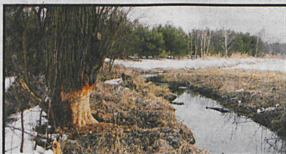
Podtopienia gruntów, których w tym roku nie oszczędziła nam aura rozpoczęły bobry koło wsi Sycyna