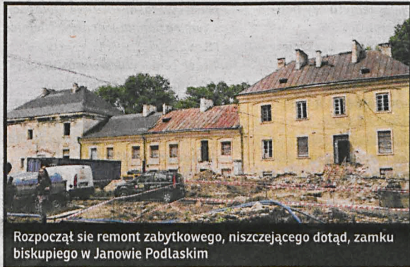
Rozpoczął się remont zabytkowego, niszczonego dotąd, zamku biskupiego w Janowie Podlaskim

◆ Rozpoczęła się modernizacja XVIII-wiecznego zamku biskupiego w Janowie Podlaskim, po zakończeniu której zabytkowy i niszczący do tej pory obiekt stanie się czterogwiazdkowym kompleksem hotelowo-konferencyjnym.