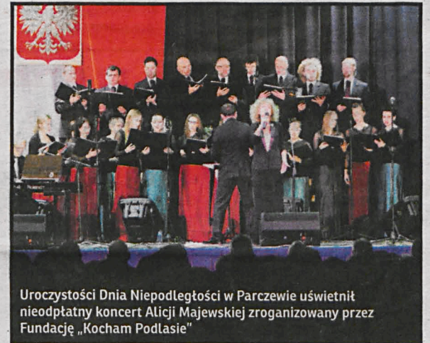
Uroczystości Dnia Niepodległości w Parczewie uświetnił nieodpłatny koncert Alicji Majewskiej zorganizowany przez Fundację „Kocham Podlasie”

◆ W Radzynie Podlaskim powstał komitet budowy pomnika bł. Ks. Jerzego Popiełuszki, który stanie na placu przy kościele św. Trójcy i sfinansowany zostanie z publicznej zbiórki..