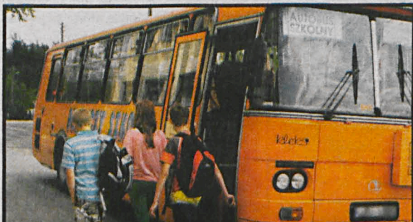
Szkolnym autobusem dzieci podróżowały w towarzystwie więźniów z ZK w Zabłociu

nie może funkcjonować, gdy panuje ujemna temperatura, a nie ma śniegu.