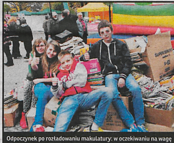
Odpozynek po rozładowaniu makulatury: w oczekiwaniu na wagę

◆ Sukcesem zakończyła się kolejna edycja naszej akcji „Makulatura na drzewo”. Podobnie jak przed rokiem wygrała klasa 3 A z SP nr 4 w Białej Podlaskiej. Jej uczniowie zebrali 3212 kg makulatury, tylko 141 kg mniej niż cała SP nr 3, która zwyciężyła w kategorii szkół.