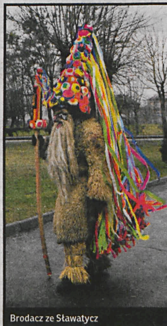
Brodacz ze Stawatycz

Ciekawy i oryginalny zwyczaj kultywuje gmina Stawatycz – pożegnanie starego roku przez brodaczy. Brodacz to lokalna nazwa przebierańców, którzy w ostatnich 3 dniach grudnia, nakładają specjalne stroje i paradują w nich po ulicach Stawatycz, aby pożegnać odchodzący rok. Niezwykle ważny jest strój brodacza. Jego twarz skrywa pomarszczona maska ze skóry oraz długa broda i wąsy. Usta i otwory na oczy oblamowane są czerwonym płótnem. Na głowie brodacza znajduje się wysoki kapelusz ozdobiony