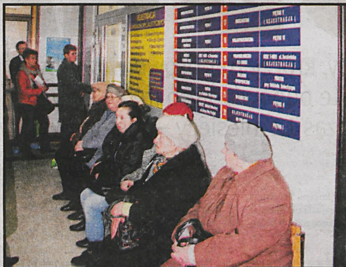
Nie maleją kolejki w podlaskich przychodniach, nie lepiej jest w szpitalach

Na oddziałach szpitalnych, też trzeba być cierpliwym i czekać na zabieg. Na