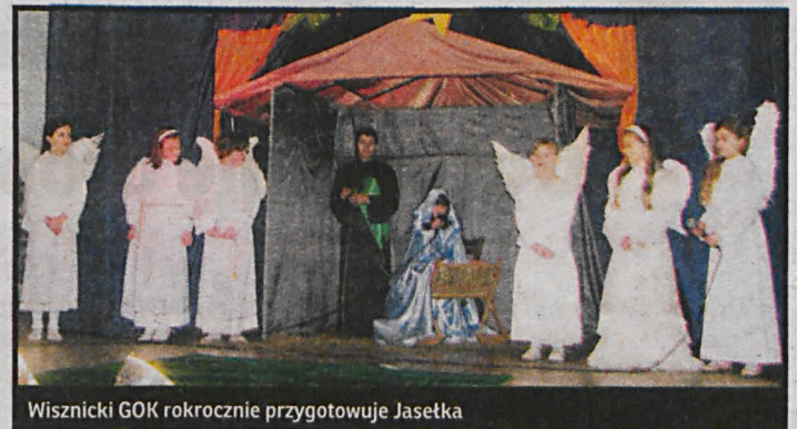
Wisznicki GOK rokrocznie przygotowuje Jasełka

kolorowymi kwiatami z bibuły i bardzo długimi wstążkami. Okrycie wierzchnie stanowi długi kozuch barani, odwrócony futrem na zewnątrz. Garb i długi kij w rękę są oznakami starości, wielkiego wysiłku, jaki trzeba było znieść w ustępującym roku. Ręce i nogi brodacza owinięte są słomą. Przygotowywania strojów rozpoczęły się z początkiem adwentu. Zwyczaj ten jest bardzo stary. Najstarsi dziewięć-