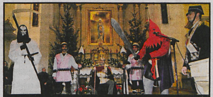
Jasełkowy spektakl w kościołach i białskich szkołach prezentowali więźniowie ZK w Białej Podlaskiej

dziesięcioletni mieszkańcy Stawatycz mówią, że o brodaczach odpowiadali im dziadkowie. Zwyczaje i tradycje powinniśmy pieczołowicie pielęgnować. Tym bardziej, że