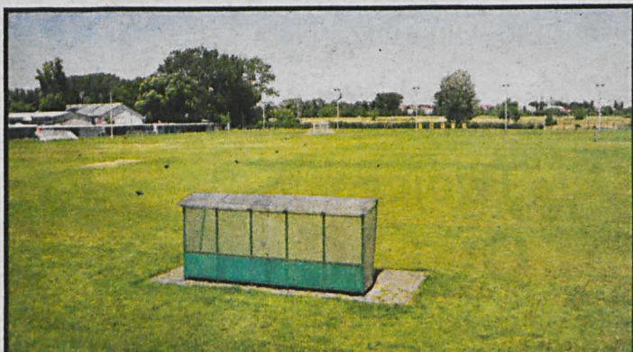
192 800 zł – tyle na utrzymanie obiektów otrzymała Akademia Piłkarska TOP-54 i MKS Podlasie

nych emocji, jakie przeżywali do tej pory i wypełnienia hali do ostatniego miejsca, sponsorom zaś – zadowolenia i wytrwałości we wspieraniu naprawdę fajnie zapowiadającej się drużyny.