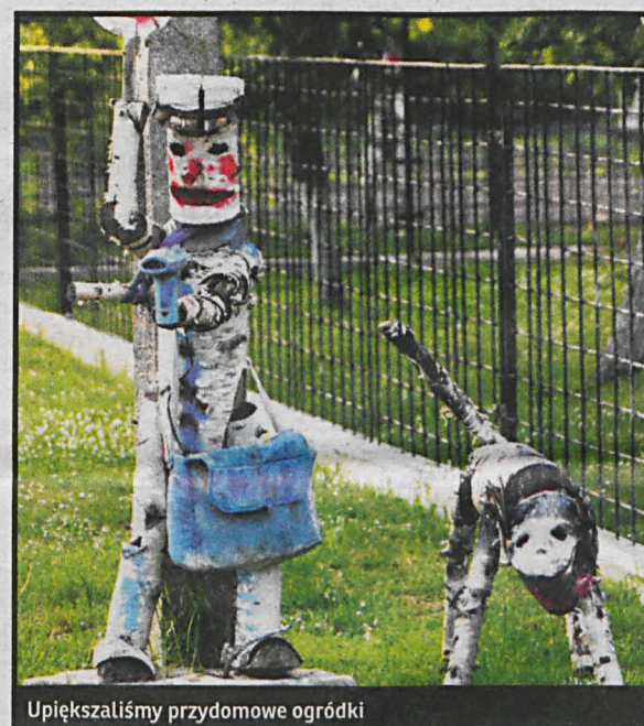
Upiększaliśmy przydomowe ogródki

i wyrządzały ogromne szkody na polach, zwłaszcza w uprawach zbóż jarych. Straty mogłyby zmniejszyć opryski, ale przemoknięta gleba uniemożliwiała wjazd ciężkiego sprzętu.