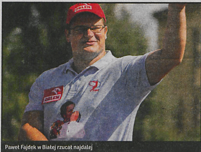
Paweł Fajdek w Białej rzucił najdalej

ska impreza została uznana za siódmą w Polsce. Warto przypomnieć, że podczas tych zawodów Paweł Fajdek rzucił młot na odległość 79,26 metrów, co jest najlepszym wynikiem, uzyskanym w naszym kraju w 2013 r. Należy mieć nadzieję, że w tym roku będzie jeszcze lepiej.