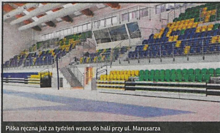
Piłka ręczna już za tydzień wraca do hali przy ul. Marusarza

18.01.2014 – Włókniarz Konstantynów Łódzki 01.02.2014 – MKS Wieluń 22.02.2014 – Mazur Sierpc 01.03.2014 – Orlen Wisła II Płock 22.03.2014 – AZS AWF Warszawa 14.04.2014 – Warszawianka Warszawa