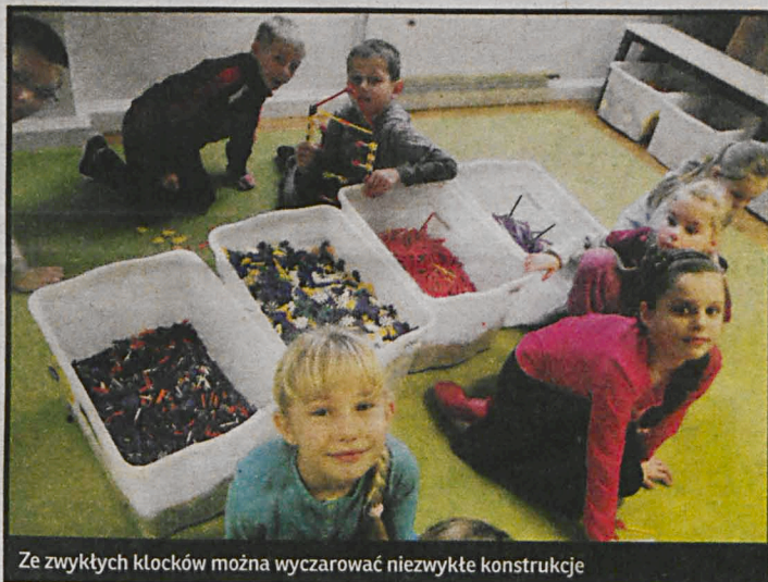
Ze zwykłych klocków można wyczarować niezwykle konstrukcje