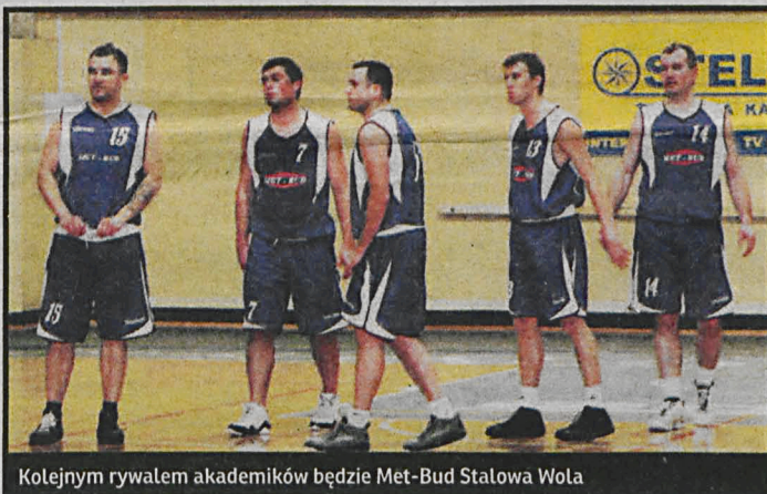
Kolejnym rywalem akademików będzie Met-Bud Stalowa Wola