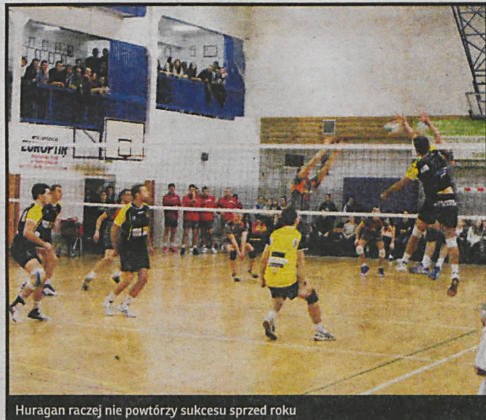
Huragan raczej nie powtórzy sukcesu sprzed roku