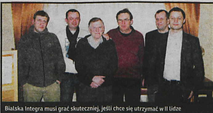
Białska Integra musi grać skuteczniej, jeśli chce się utrzymać w II lidze