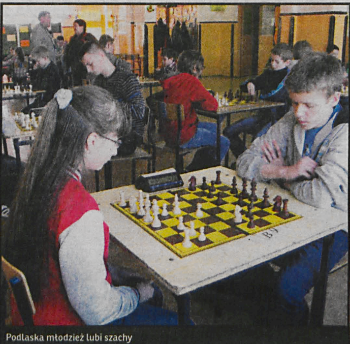
Podlaska młodzież lubi szachy