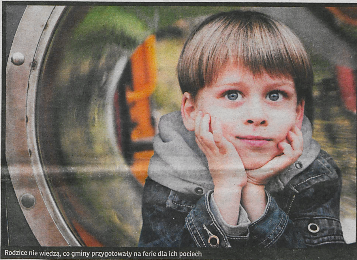
Rodzice nie wiedzą, co gminy przygotowały na ferie dla ich pociech