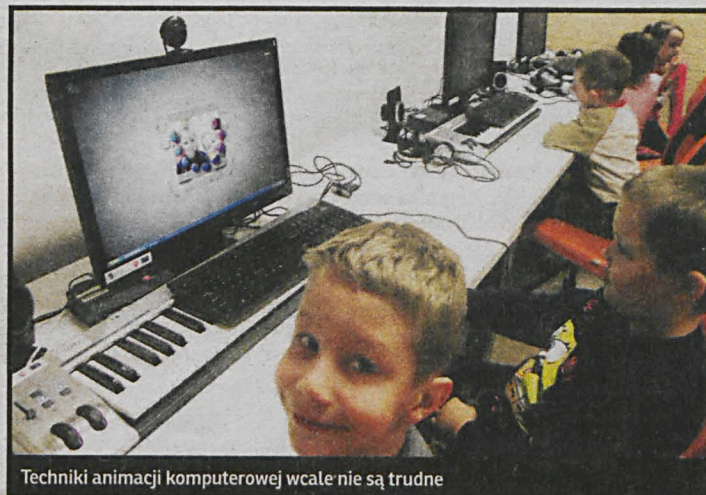
Techniki animacji komputerowej wcale nie są trudne