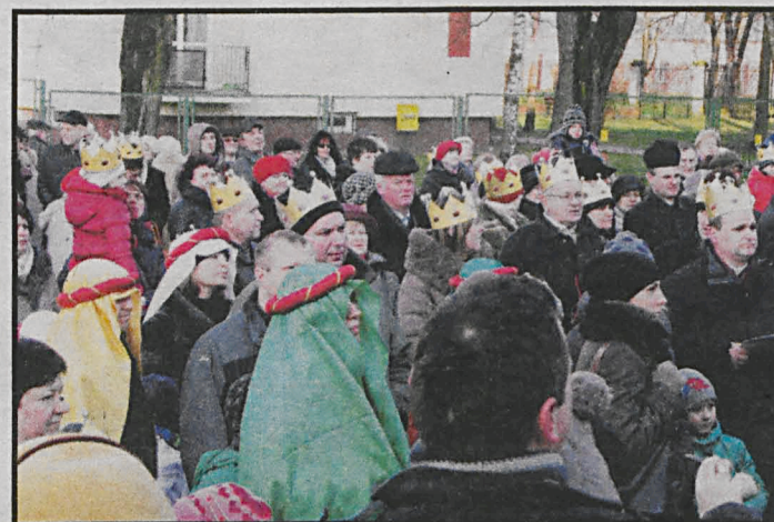
Uroczystości Pokłonu Trzech Mędrców zgromadziły w Białej Podlaskiej i Radzynie Podlaskim ponad 4 tysiące osób

Radzyński przemarsz wyruszył po południowej mszy św. w kościele Świętej Trójcy na Plac Potockiego gdzie znajdowała się ufundowana przez Fundację