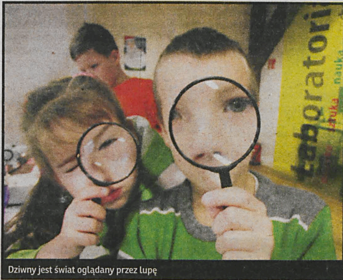
Dziwny jest świat oglądany przez lupę

MultiCentrum to multimedialne, wielofunkcyjne, interaktywne centrum edukacji i rozrywki. Inne ośrodki w Polsce