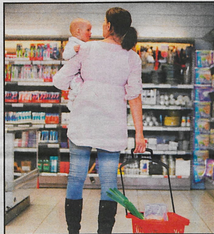
W tym roku, wobec czekających nas podwyżek, portfele będą chudsze a zakupy skromniejsze

laskiej – młode małżeństwo posiadające dwójkę dzieci i własne mieszkanie. Oboje pracują, nie posiadają nałogów, ale za to kredyt hipoteczny. Ich domowy budżet jest misternie zaplanowany, liczy się każda złotówka. Jedną pensję przeznaczają na spłatę kredytu, czynsz, wywóz śmieci, rachunki za energię elektryczną. Z drugiej musi wystarczyć na żywność oraz pozostałe opłaty – przedszkole, koszty utrzymania samochodu, abonament RTV i inne.