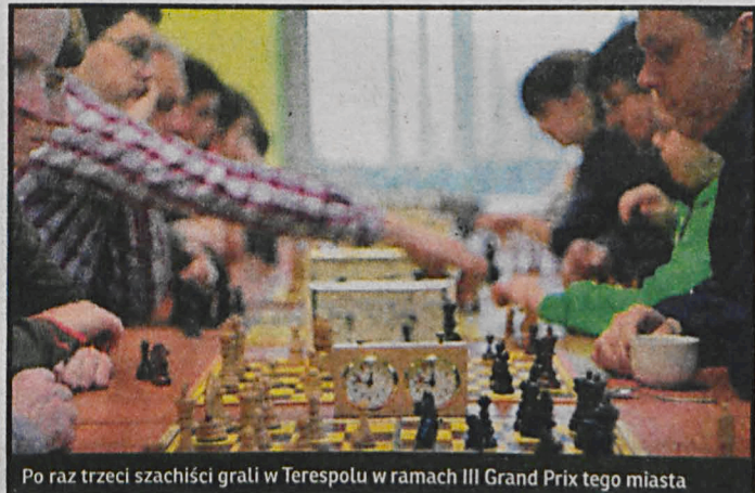
Po raz trzeci szachiści grali w Terespole w ramach III Grand Prix tego miasta