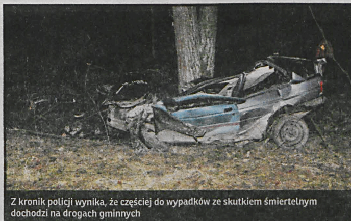
Z kronik policji wynika, że częściej do wypadków ze skutkiem śmiertelnym dochodzi na drogach gminnych