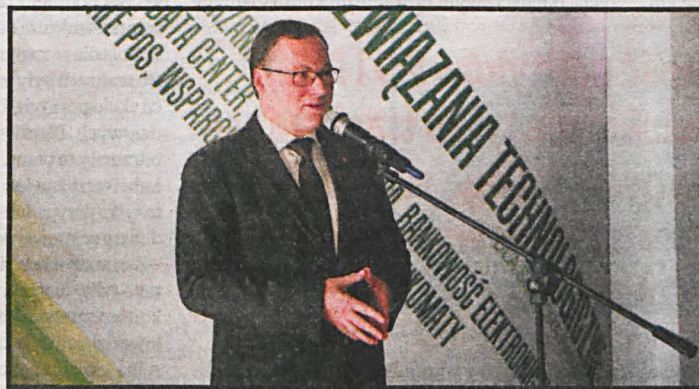
Senator Grzegorz Bierecki: - W Białej Podlaskiej jest ogromny potencjał