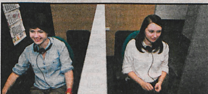
Załoga Call Center to w większości młodzi ludzie