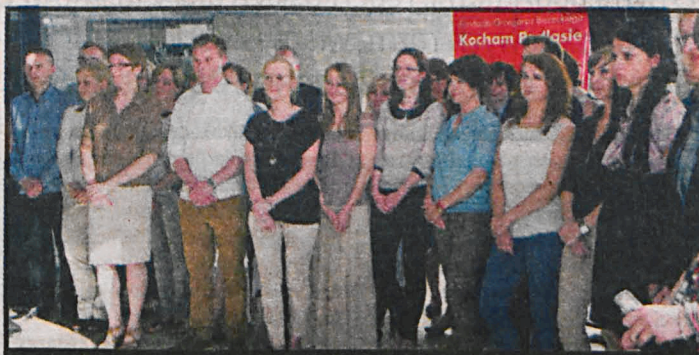
W uroczystości uczestniczyli również pracownicy bialskiego Call Center