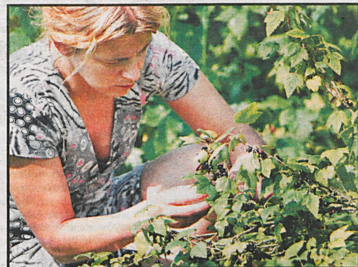
Porzeczki zbierane są ręcznie lub za pomocą kombajnu

Krajowe Stowarzyszenie Plantatorów Czarnych Porzeczek stoi na stanowisku, że cena za owoce oferowana przez przemysł producentom powinna zawierać się w przedziale od 2,60 do 3,50 zł za 1 kg w zależności od wielkości podaży w danym roku.