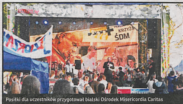
Posiłki dla uczestników przygotował białski Ośrodek Misericordia Caritas

W nawiązaniu do meksykańskiego bohatera bł. Jose Luis Sanchez del Rio, 13-let-