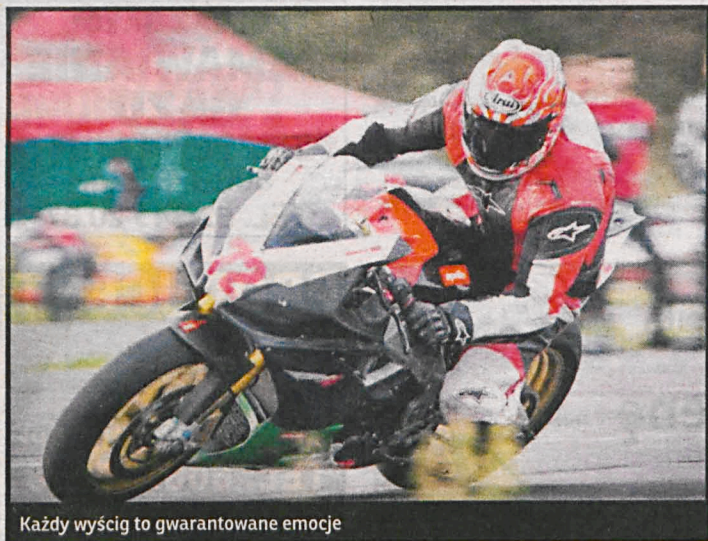
Każdy wyścig to gwarantowane emocje

się tradycyjnie pod naszym patronatem. Wszystkich fanów wyścigów motorów zapraszamy na gwarantowane emocje.