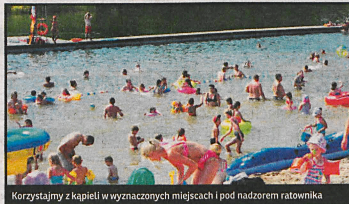
Korzystajmy z kąpielni w wyznaczonych miejscach i pod nadzorem ratownika