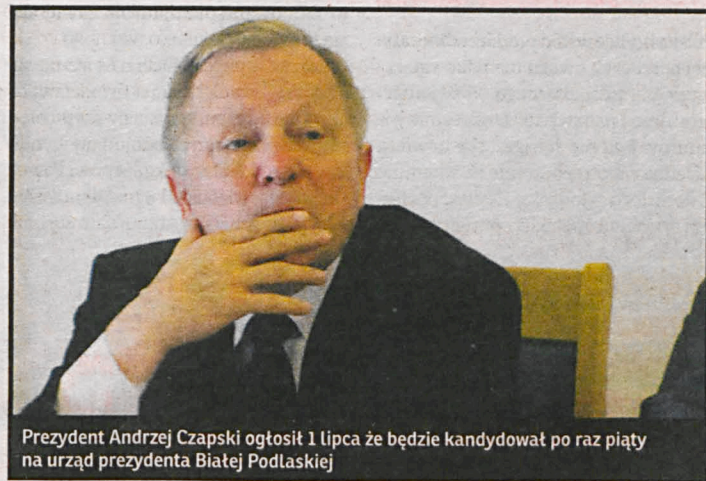
Prezydent Andrzej Czapski ogłosił 1 lipca że będzie kandydował po raz piątą na urząd prezydenta Białej Podlaskiej

każde płatne zajęcie. W gronie moich rówieśników, dwudziestoparolatków posiadających różne wykształcenie, nie znam nikogo, kto zarabiałby