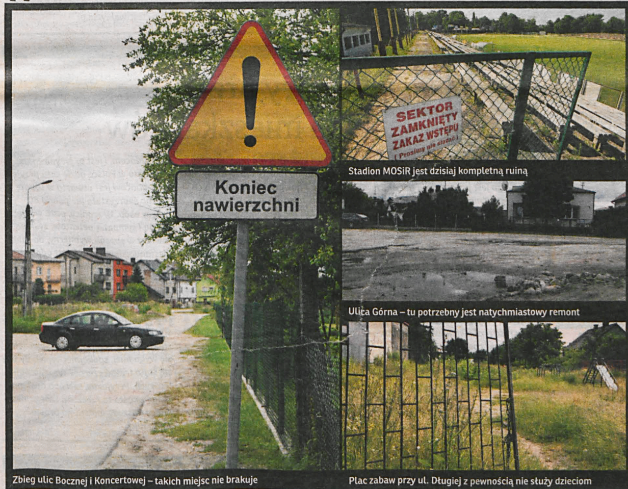
Zbieg ulic Bocznej i Koncertowej – takich miejsc nie brakuje