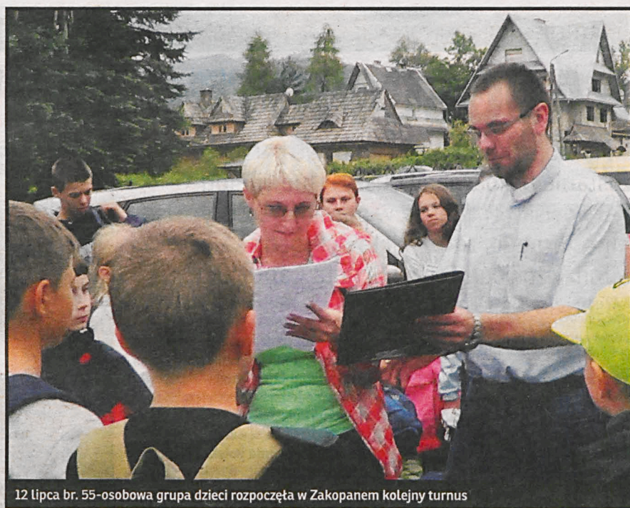
12 lipca br. 55-osobowa grupa dzieci rozpoczęła w Zakopanem kolejny turnus