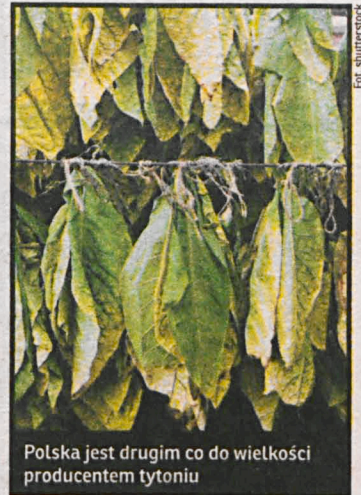
Polska jest drugim co do wielkości producentem tytoniu

Przypomnijmy – nowelizacja dyrektywy tytoniowej idzie zgodnie z ideologicznymi prądami UE. Uniokracy chcąc za wszelką cenę (i wbrew naszej woli) chronić włącznie zdrowie narodów UE postanowili na branżę tytoniową nałożyć daleko idące ograniczenia. Zakaz produkcji i sprzedaży papierosów mentolowych i slim to te najbardziej drastyczne. Kraje członkowskie UE odrzuciły kwestię zakazu slimów, lecz „na wokandzie” wciąż jest kwestia papierosów smakowych. KE szacuje, że dzięki zmianom w dyrektywie konsumpcja tytoniu może spaść o 2 proc. w ciągu pięciu lat. To oznacza znaczne straty producentów, które szczególnie odczuwają rolnicy z województwa lubelskiego, będącego prawdziwym polskim zagłębiem tytoniowym. Zgodnie z dyrektywą od 2016 r. mają być zakazane papierosy z dodatkami smakowymi; listę tych dodatków opracować ma Komisja Europejska. Wyjątkiem objęto papierosy mentolowe, dla których wprowadzony zostanie 4-letni okres przejściowy. To oznacza, że zakaz wejdzie w życie dopiero latem 2020 r. Rząd PO-PSL zamierza skarżyć więc dyrektywę do Europejskiego Trybunału Sprawiedliwości. Problem w tym, że podczas lutowego głosowania w PE cała delegacja posłów Platformy i PSL-u głosowała za szkodliwą dyrektywą. Jedynym,