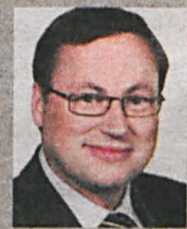
Senator Grzegorz Bierecki

Zadłużanie się za granicą, niezależnie od formy, niesie ze sobą wielkie ryzyko. Jeśli polskie państwo jest dłużnikiem, zagraniczny wierzyciel ma potężne narzędzie wpływu na decyzje podejmowane przez rządzących. Powiększanie tego długu prowadzi do ograniczenia niezależności naszej Ojczyzny. Moim zdaniem powinniśmy iść w zupełnie innym kierunku. Obligacje mogą przecież być nabywane przez polskie podmioty a odsetki od nich – wypłacane Polakom. Dzięki temu nie tylko państwo będzie bezpieczniejsze, ale też pobudzimy rodzimą gospodarkę, stworzymy nowe miejsca pracy. Na tym właśnie polega patriotyzm gospodarczy, którego tak bardzo potrzebujemy. Szkoda, że obecny rząd tego nie rozumie.