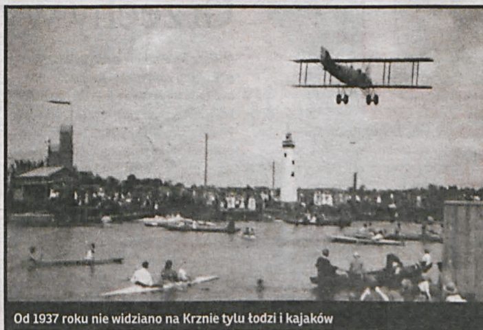
Od 1937 roku nie widziano na Krznie tyłu łodzi i kajaków