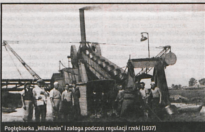
Pogłębiarka „Wilnianin” i załoga podczas regulacji rzeki (1937)