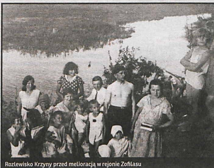
Rozlewisko Krzny przed melioracją w rejonie Zofitasu