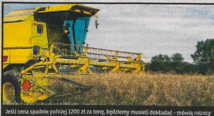
Jeśli cena spadnie poniżej 1200 zł za tonę, będziemy musieli dokładać - mówią rolnicy