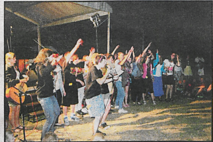
W ubiegłym roku Misjonarze Oblaci gościli 550 młodych ludzi

ników Festiwalu – w poniedziałek 21 lipca w Kodniu od godz. 9.00. Więcej informacji można znaleźć na stronie: www.festiwalzycia.pl