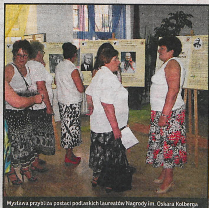
Wystawa przybliżyła postaci podlaskich laureatów Nagrody im. Oskara Kolberga