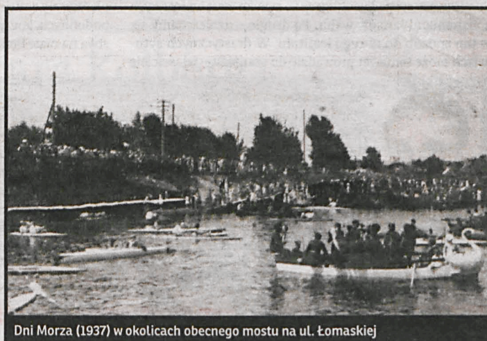
Dni Morza (1937) w okolicach obecnego mostu na ul. Łomaskiej