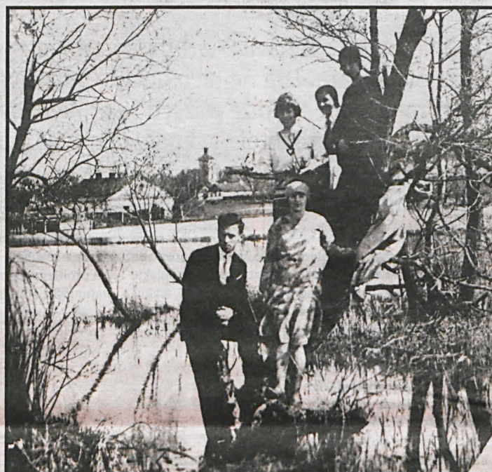
Rozlewisko Krzny przed regulacją; widok na wieżę zamkową z dzielnicy Wola