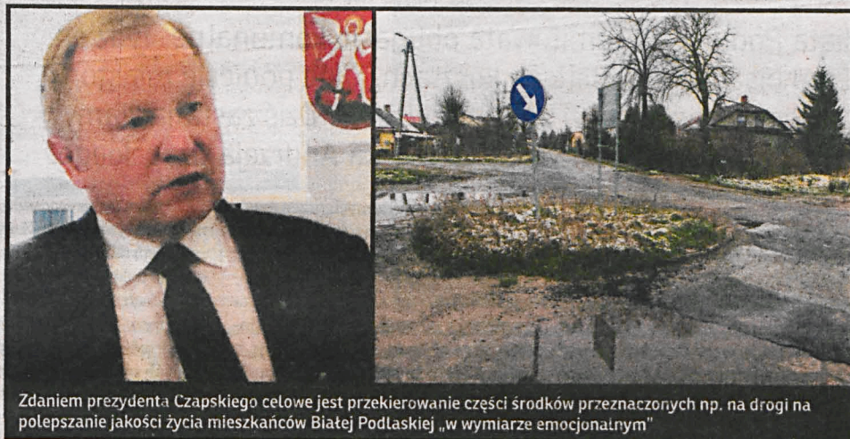
Zdaniem prezydenta Czapskiego celowe jest przekierowanie części środków przeznaczonych np. na drogi na polepszenie jakości życia mieszkańców Białej Podlaskiej „w wymiarze emocjonalnym”

Czy rzeczywistość Białej Podlaskiej można rzeczywiście kreślić w tak różowych barwach? Czy jedynym problemem miasta jest dziś brak miejsc do spacerów?