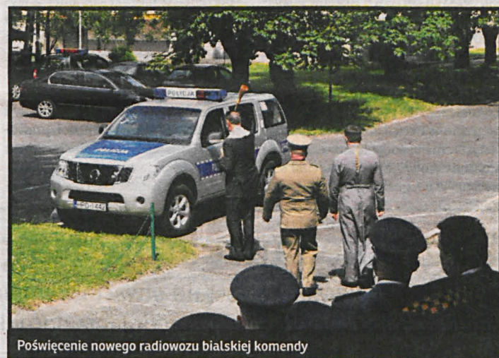
Poświęcenie nowego radiowozu białskiej komendy