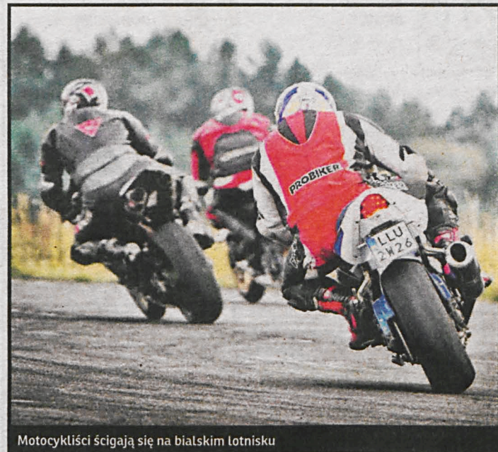
Motorcykliści ścigają się na białskim lotnisku

szym patronatem. Wszystkich fanów wyścigów motorów zapraszamy o godz. 16 na białskie lotnisko.