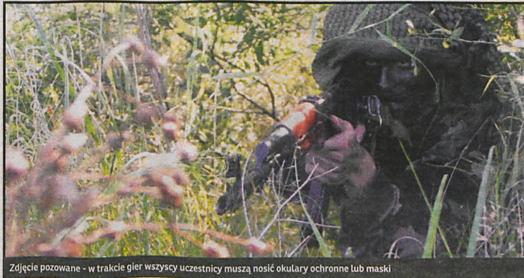
Zdjęcie pozowane – w trakcie gier wszyscy uczestnicy muszą nosić okulary ochronne lub maski