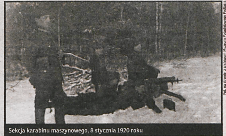
Sekcja karabinu maszynowego, 8 stycznia 1920 roku

W kraju wobec realnego zagrożenia powołano Radę Obrony Państwa, Rząd Obrony Narodowej i Armię Ochotni-