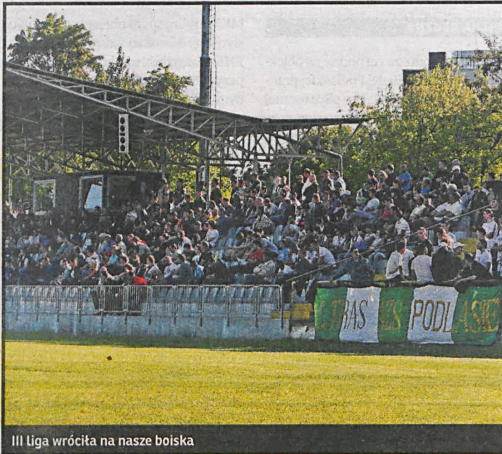
Fot. Andrzej Jędrzejkowski