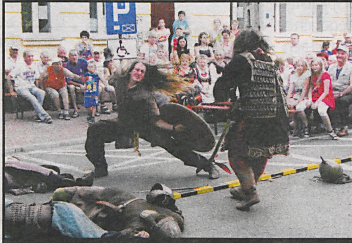
Turniej rycerski uświetnił obchody 450-lecia przyjęcia uchwał Soboru Trydenckiego

Na Placu Wolności odbył się festyn historyczny „Parczew – historia i tradycja” połączony z Jarmarkiem Jagiellońskim. Ponad dwudziestu wystawców w królewskim mieście prezentowało swoje wyroby m.in. tkackie, gamcarskie i wikliniarskie. Każdy mógł spróbować swoich sił w strzelaniu z łuku bądź wybić wła-