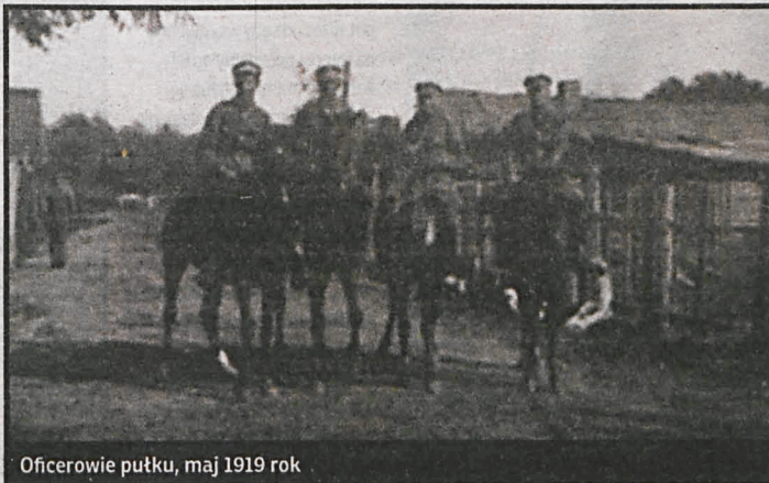
Oficerowie pułku, maj 1919 rok

Polska od momentu odzyskania Niepodległości w listopadzie 1918 roku, musiała bronić swoich granic. Początkiem polsko-sowieckich działań wojennych było zajmowanie przez sowieków kolejnych miejscowości. W grudniu 1918 roku weszli oni do Mińska, a w grudniu opanowali Wilno. Niewypowiedziana wojna polsko-bolszewicka rozpoczęła się od pierwszych starć Wojska Polskiego z Armią Czerwoną w połowie lutego 1919 pod Mostami nad Niemnem i pod Maniewiczami na Wołyniu. Na początku marca formacje zgrupowań polskich przeszły do akcji zaczepnej, opanowały Słonim i Pińsk, a na północy dotarły pod Lidę.