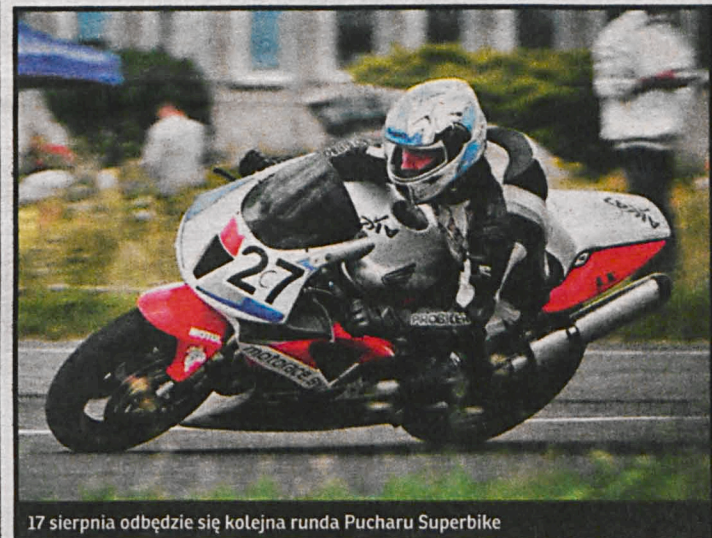
17 sierpnia odbędzie się kolejna runda Pucharu Superbike

natem. Wszystkich fanów wyścigów motorów zapraszamy w niedzielne popołudnie na białskie lotnisko.