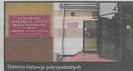
Ostatnia instancja pokrzywdzonych

Grzegorz Domański po 5 tygodniach od zgłoszenia się in-