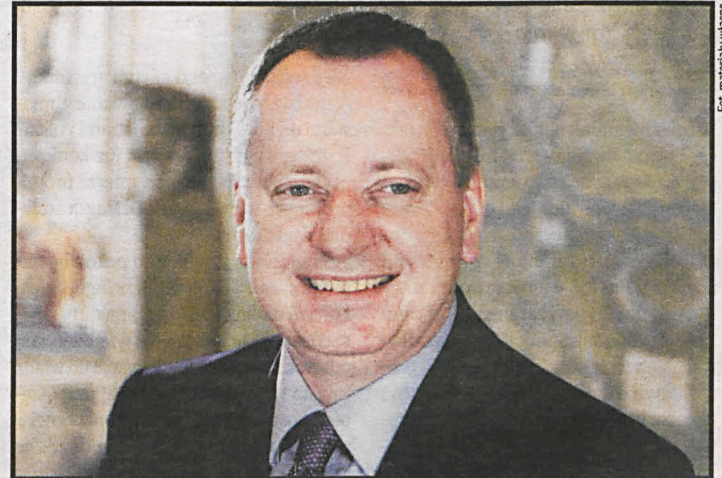
Przemysław Häuser - reżyser, scenarzysta, producent filmowy

cone będą jesienią w pokrzyżackim zamku w Gniewie nad Wisłą – niestety, zamek sapieżyński nie dotrwał do naszych czasów. Jeszcze nie wiadomo, kto wystąpi w głównych rolach.