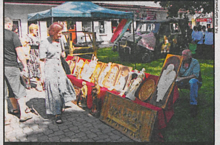
Częścią festynu historycznego był również „Jarmark Jagielloński”