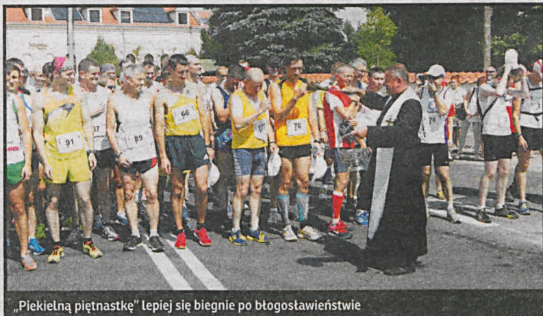
„Piekielną piętnastkę” lepiej się biegnie po błogosławieństwie

„Piekielna piętnastka” – taki nieoficjalny przydomek ma kodeński bieg – służy również popularyzacji czynnego wypoczynku wśród dzieci i dorosłych, połączonego z poznawaniem bogatej kultury regionu pogranicza, wspaniałych zabytków, a nade wszystko – nieskażonej nadbużańskiej przyrody. W przyszłym roku na pewno spotkamy się po raz szesnasty, bo w Kodniu już szykują kolejną edycję tych zawodów.