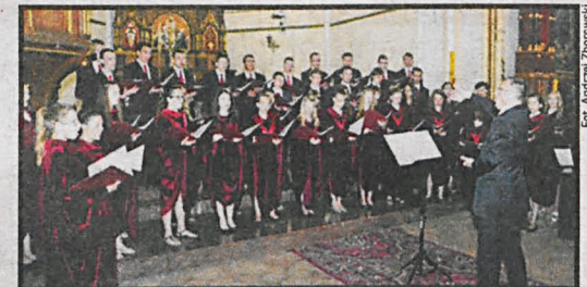
Udział w dwóch festiwalach to lipcowy plon chóru SCMC

Ta niezwykła liczba utworów przygotowanych do zaśpiewania w każdej chwili, wzbudziła ogromny podziw organizatorów i publiczności. No i przede wszystkim jakość wykonania! Idealnie czysta intonacja, różnicowanie barw w zależności od