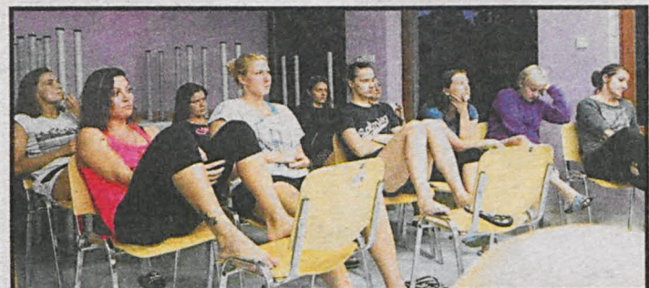
Zawodniczki MKS Lublin podczas zajęć teoretycznych na obiektach białskiej uczelni sportowej

MKS Lublin, spadkobierczynie tradycji słynnego Montexu (zdobywcy Pucharu EHF). Szczyptornistki pracowały nad przygotowaniem fizycznym, taktycznym oraz mentalnym do nowego sezonu.