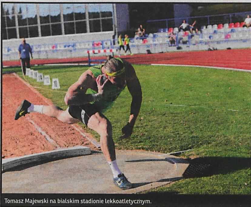
Tomasz Majewski na białskim stadionie lekkoatletycznym.