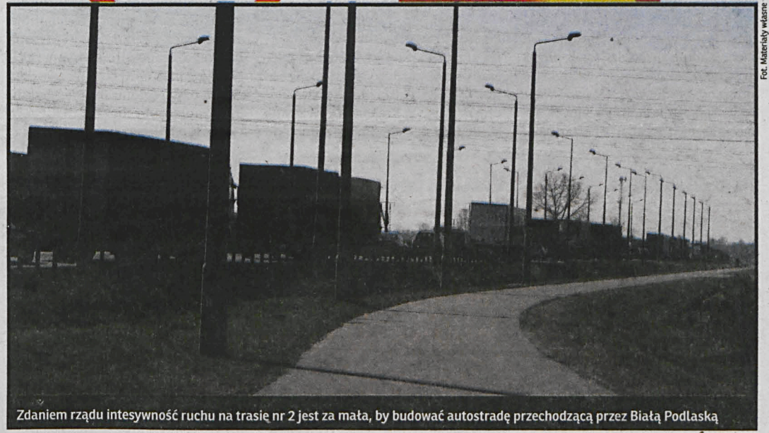
Zdaniem rządu intensywność ruchu na trasie nr 2 jest za małą, by budować autostradę przechodzącą przez Białą Podlaską