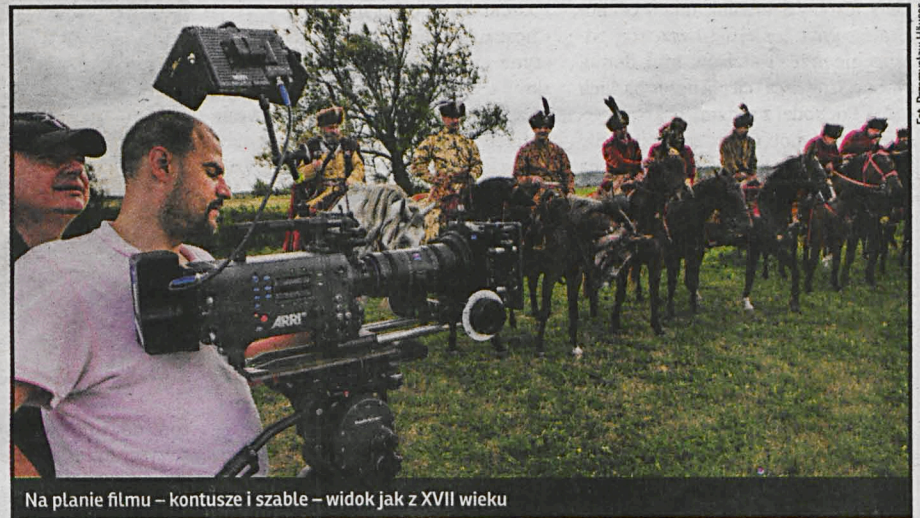
Na planie filmu – kontusze i szable – widok jak z XVII wieku