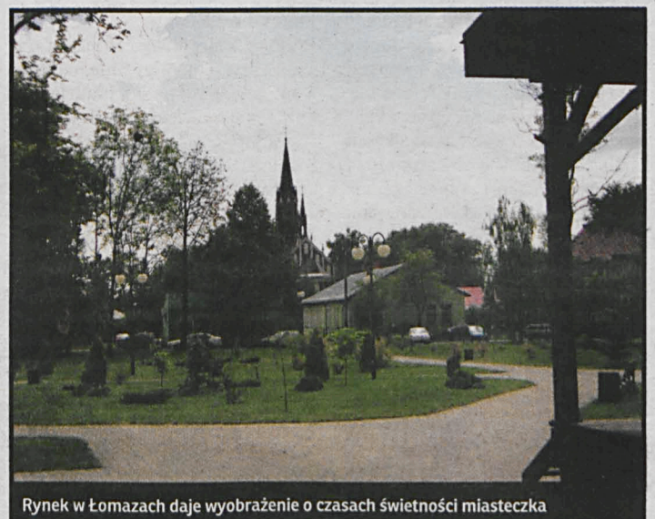
Rynek w Łomazach daje wyobrażenie o czasach świetności miasteczka

rynki w Parczewie, Łomazach i Piszczacu, które do dzisiaj zadziwiają swoimi rozmiarami.