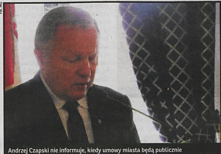
Andrzej Czapski nie informuje, kiedy umowy miasta będą publicznie

Prezydent Białej Podlaskiej Andrzej Czapski nie chce zdradzić, kiedy zostaną ujawnione wszystkie umowy zawierane przez magistrat. Przyzwoitość nakazuje, by stało się to przed wyborami, by każdy wyborca mógł sam ocenić, czy obecne władze dobrze prowadzą interesy miasta.