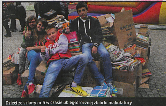
Dzieci ze szkoły nr 5 w czasie ubiegłorocznej zbiórki makulatury