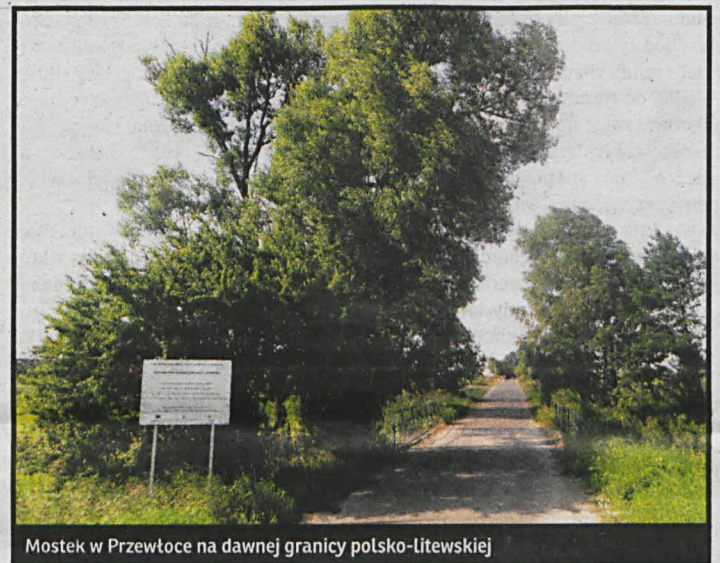
Mostek w Przewłocze na dawnej granicy polsko-litewskiej

rad reprezentantów obu narodów. Liczne osady z niewielkich miejscowości szybko stały się dużymi ośrodkami miejskimi. Parczew szczycił się wówczas kilkoma kościołami i dworem królewskim. Rozwijały się również Łomazy i Piszczac. Ostatnim akordem świetności Południowego Podlasia – zarazem największym – stało się ogłoszenie i przyjęcie przez króla Zygmunta Augusta na sejmie w Parczewie w roku 1564 postanowienia Soboru Trydenckiego, którego 350. rocznicę obchodzimy w tym roku. Tu też zaplanowano obrady dotyczące unii obu państw. Niestety, zdarzenie losowe, jakim był pożar miasta i – prawdopodobnie zbyt mała liczba posłów – spowodowały, że unię zawarto w Lublinie. Po przeniesieniu w 1611 roku stolicy Polski z Krakowa do Warszawy Trakt Jagielloński stał się lokalnym szlakiem handlowym. Niegdyś duże i bogate miasta zaczęły podupadać, a dowodem ich świetnej przeszłości pozostały tylko założenia urbanizacyjne: