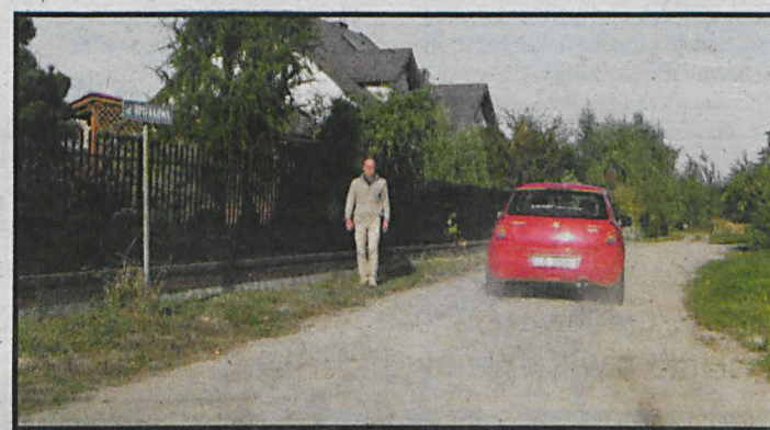
Ulica Opieńkowa ma zyskać utwardzoną nawierzchnię i oświetlenie

Mieszkańcy osiedla Grzybowa zapowiedź rychłej inwestycji przyjmują z ra-