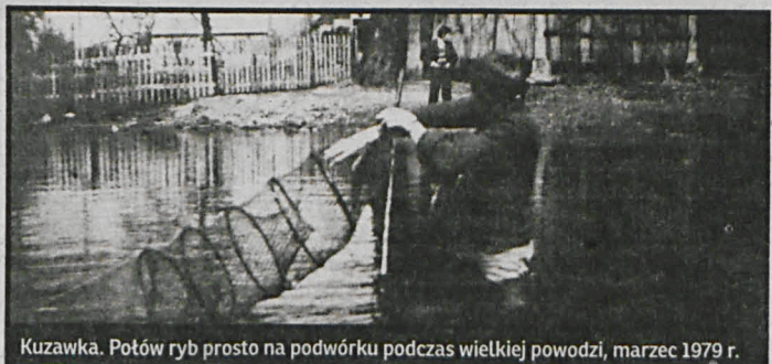
Kuzawka. Potów ryb prosto na podwórku podczas wielkiej powodzi, marzec 1979 r.

rowi, aby jego bezinteresowna praca kronikarza znalazła wsparcie wójta czy starosty, by kolejnej publikacji nie musiał