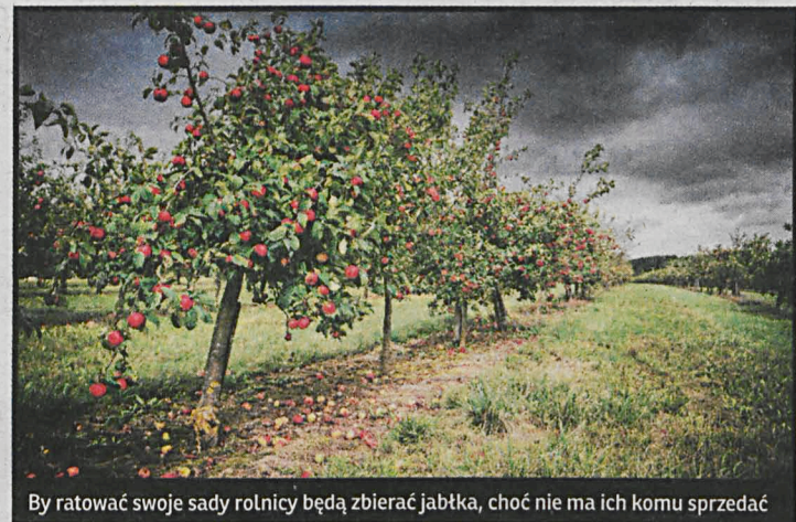
By ratować swoje sady rolnicy będą zbierać jabłka, choć nie ma ich komu sprzedać

Oczywiście, wciąż można jeszcze szukać alternatywnego źródła zbytu owoców. – Nastawiliśmy się głównie na rynek wschodni, a władze nie zadbały o to, żeby eksportować też nasze produkty do