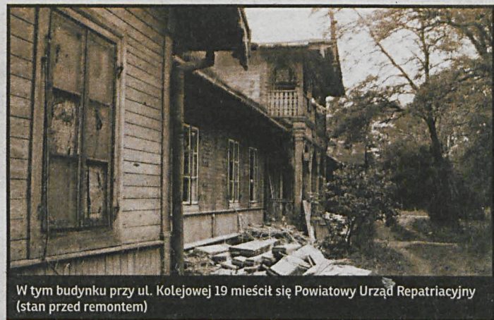
W tym budynku przy ul. Kolejowej 19 mieścił się Powiatowy Urząd Repatriacyjny (stan przed remontem)

Tylko części z zesłanych – ok. 115 tys. – dorosłych oraz dzieci – udało się trafić do armii gen. Andersa i przejść z nią na Bliski Wschód, również nieliczni z tej ogromnej rzeszy, bo ok. 30 tys., wstąpili