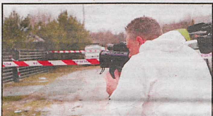
Rakowiska zagościły nie tylko w lokalnych mediach

Dziennikarze budowali medialną historię.