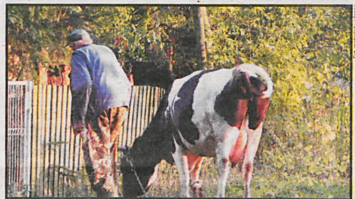
Krasula wraca z pastwiska – taki widok nawet na Podlasiu widać coraz rzadziej

Można powiedzieć: a cóż takiego się stanie, mięsa przecież nie zabraknie? Otóż nie! Bezlitosna logika prawa i ekonomii może uruchomić czarny scenariusz. Drobne, rodzinne gospodarstwa cały czas są kluczowym ogniwem lokalnego rynku żywnościowego i ekonomii Południowego Podlasia. Jeśli na masową skalę rolnicy odstąpią od przyzgodowej hodowli świń, zabraknie dostaw i pracy dla drobnych ubojni i mięsa dla lokalnych masarni. Załamię się rynek dla miejscowych pro-