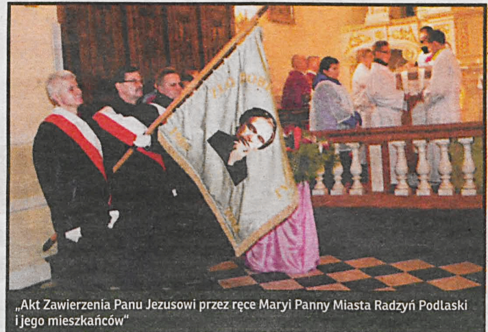
„Akt Zawierzenia Panu Jezusowi przez ręce Maryi Panny Miasta Radzyń Podlaski i jego mieszkańców”

W Radzynie Podlaskiej 12 grudnia o godz. 18 w kościele Trójcy Świętej została odprawiona msza święta z okazji 33. rocznicy wprowadzenia stanu wojennego oraz inauguracji VII kadencji samorządu. Podczas eucharystii został dokonany „Akt Zawierzenia Panu Jezusowi przez ręce Maryi Panny Miasta Radzyń Podlaski i jego mieszkańców”. Na zakończenie delegacje Urzędu Miasta, NSZZ „Solidarność” oraz harcerzy złożyły wieńce i zapaliły znicze przed pomnikiem bł. ks. Jerzego Popiełuszki. Rocznicowa msza odprawiona została również w Międzyrzeczu Podlaskim. Międzyrzeczka świątynia św. Józefa jest dla związkowców miejscem szczególnym. Znajdują się w niej relikwie bł. ks. Jerzego Popiełuszki, patrona „Solidarności”. Ponadto na parafialnym placu od 2006 r. stoi pomnik bł. ks. Jerzego,