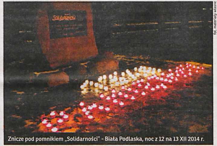
for. materiały własne