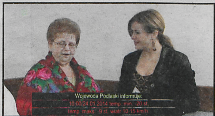
Takie jak ten komunikaty o zagrożeniu będą automatycznie widoczne na ekranie TV

Od 1 stycznia możemy dowiedzieć się, korzystając z ekranu telewizora odbierającego regionalny program publicznej TVP Lublin lub TVP Warszawa, czy Podlasiu grozi np. nawalnica, czy opady grożą wyłaniem wód Krzny lub o innym zdarzeniu, np. katastrofie ciężarówki z niebezpiecznym ładunkiem na drodze nr 2. Umożliwia to Regionalny System Ostrzegania (RSO), czyli usługa powiadamiania obywateli o lokalnych zagrożeniach. Komunikaty pojawiają się na ekranie telewizora w formie napisów. W zwięzły sposób poinformują i odesłają do szczegółów, np. umieszczonych na konkretnej stronie telegazety. W telewizorach dostosowanych do telewizji hybrydowej (tj. łączącej telewizję z internetem) istnieje możliwość przejścia na stronę oferującą np. filmową