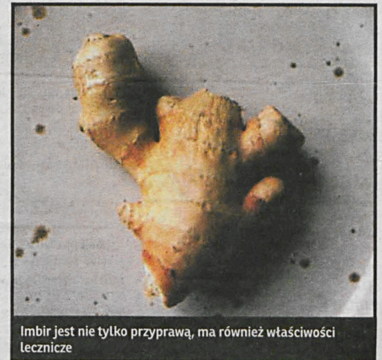
Imbir jest nie tylko przyprawą, ma również właściwości lecznicze

Przy pierwszych symptomach przeziębienia