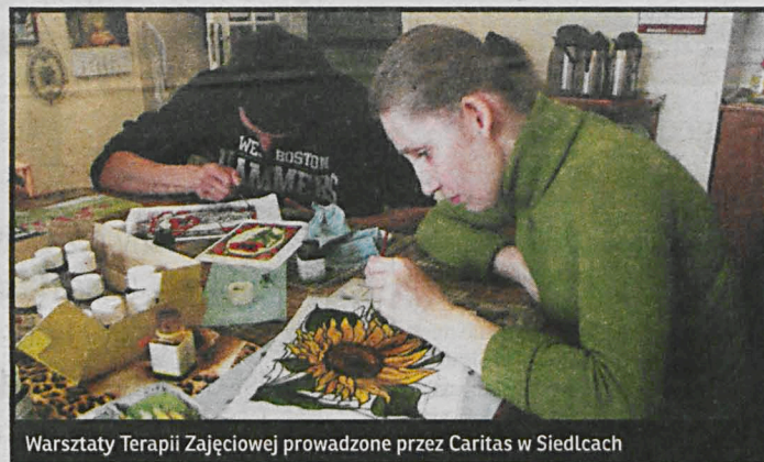
Warsztaty Terapii Zajęciowej prowadzone przez Caritas w Siedlcach

– Caritas Diecezji Siedleckiej jako pierwsza włączyła się w obchody jubileuszu Caritas Polska. W jego ramach pokazaliśmy wiele działań siedleckiej Caritas na rzecz osób niepełnosprawnych, ponieważ mamy bogatą ofertę zorganizowanych działań dla osób z niepełnosprawnością, jak warsztaty terapii zajęciowej, Zakład Aktywności Zawodowej oraz projekty „miękkie”, w tym wyjazdy i obozy dla niepełnosprawnych. Przy okazji jubileuszu chcemy pokazać, co