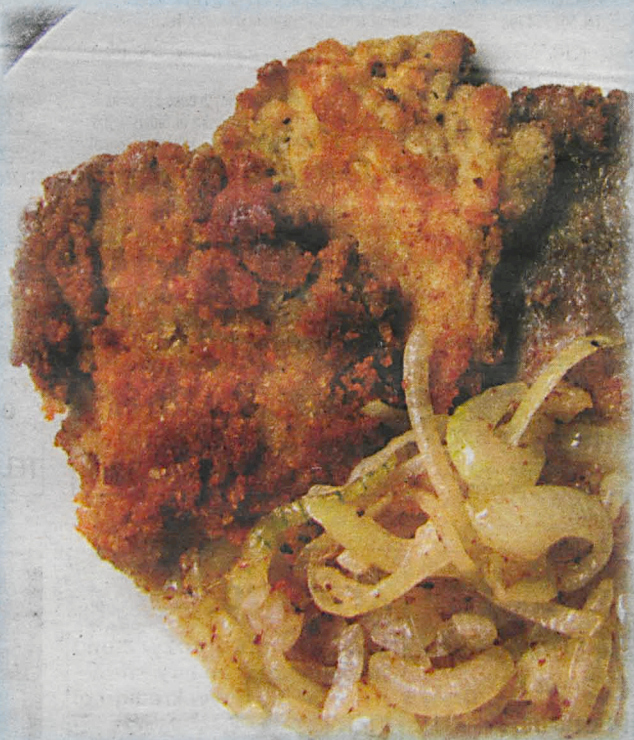
MG (tekst i foto)

Z bocznikami postępujemy podobnie jak z kotletem schabowym. Myjemy grzyby pod bieżącą wodą (ostrożnie, ze względu na ich kruchą strukturę) i dokładnie osuszamy papierowym ręcznikiem. Obtaczamy kapelusze w mące, rozmąconym jajku i w bułce tartej. Smażymy na niewielkiej ilości rozgrzanego oleju. Solimy i pieprzymy według upodobań już na talerzu. W ten sposób w kilka minut uzyskujemy pyszne i zdrowe danie.