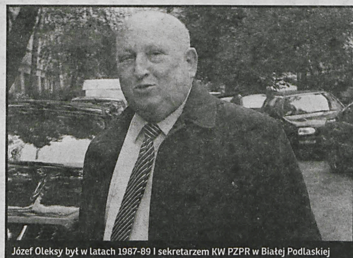
Józef Oleksy był w latach 1987-89 I sekretarzem KW PZPR w Białej Podlaskiej

Taka postawa ówczesnego I sekretarza KW PZPR nie była oczywiście improwizacją, ale świadomym eksperymentem w ramach strategii przygotowań elit PZPR do kontrolowanej zmiany systemu władzy, która znalazła kulminację przy okrągłym stole. Ale też Józef Oleksy znalazł na Podlasiu – sam pochodził z nowosądeckiego – wielu sympatyków, bo otwartość naturalnie harmonizowała z jego przyrodzonym charakterem i temperamentem. Te cechy ujawniał wiele razy później, zdobywając sympatyków po wszystkich stronach sceny politycznej.