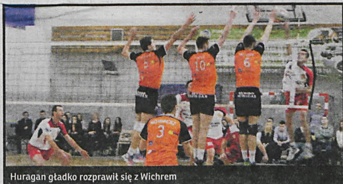
Huragan gładko rozprawił się z Wichrem