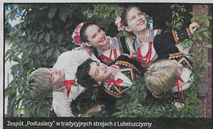
Zespół „Podlasiacy” w tradycyjnych strojach z Lubelszczyzny