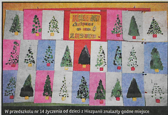
W przedszkolu nr 14 życzenia od dzieci z Hiszpanii znalazły godne miejsce

towały dla swoich kolegów i koleżanek z Colegio dei Salvador w Saragossie piękne kartki z życzeniami „Feliz Navidad”, czyli „Wesołych Świąt Bożego Narodzenia” po hiszpańsku. Tuż przed świętami dotarła do przedszkola wyjątkowa przesyłka. To dzieci z Hiszpanii przysłały dzieciakom z Białej własnoręcznie wykonane prace wraz ze słodkimi upominkami. Dziękujemy bardzo – Muchas gracias! SEK