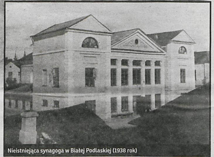
Nieistniejąca synagoga w Białej Podlaskiej (1938 rok)

Trudno obecnie – z powodu braku źródeł – opisać jak funkcjonowała społeczność żydowska na Południowym Podlasiu. Jedyne dostępne dane dotyczą liczby synagog czy domów modlitwy. Gminy żydowskie – kahały – podlegały początkowo większym ośrodkom, i tak: Międzyrzec Tykocinowi, a Biała Podlaska i Łomazy – Brześciowi. Nie była to jednak społeczność tak jednorodna, jak się nam obecnie wydaje. Żydzi, jak całe społeczeństwo, dzielili się na biednych i bo-