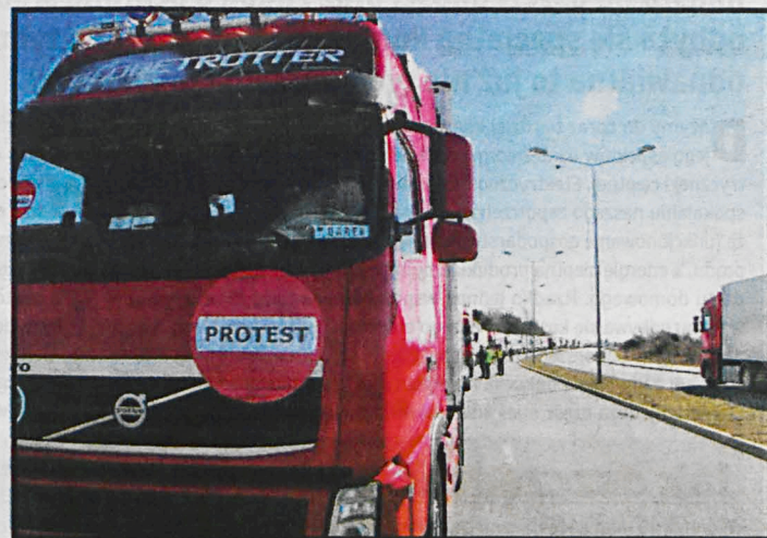
W drogowym proteście przy przejściu granicznym w Koroszczynie wzięto udział 250 tirów blokując wjazd na terminal odpraw dla samochodów ciężarowych

– Naszym firmom grozi bankructwo, ludzie są zdesperowani. Boję się, że przy następnym proteście jego przebieg może wymknąć się spod kontroli. Wiele osób nie zamierzało ukończyć protestu o wyznaczonym czasie. Mówili: »możemy