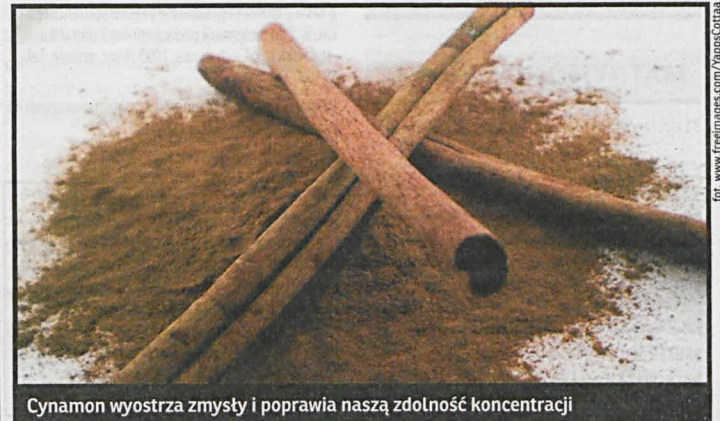
Cynamon wyostża zmysły i poprawia naszą zdolność koncentracji