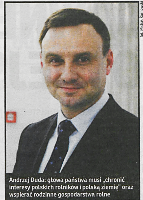
Andrzej Duda: głowa państwa musi „chronić interesy polskich rolników i polską ziemię” oraz wspierać rodzinne gospodarstwa rolne

Zdaniem Andrzeja Dudy, polscy rolnicy nie potrze-