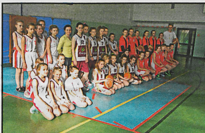
Uczestniczki finału dziewcząt (zdjęcie powyżej) i ekipa SP nr 9 z Białej Podlaskiej

Na kolejnych miejscach uplasowały się SP Okrzeja i SP 3 Biała Podlaska.