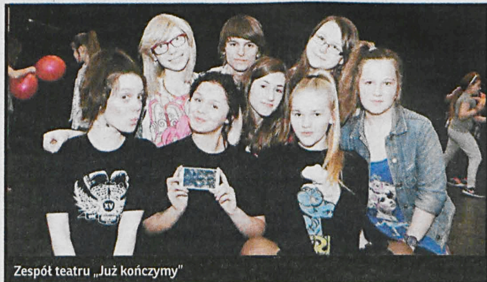
Zespół teatru „Już kończymy”