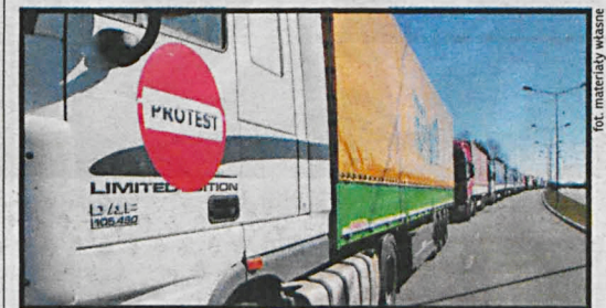
fol. materiały własne

Polskie firmy transportowe, w tym liczne przedsiębiorstwa z Południowego Podlasie, znajdują się na granicy finansowej zapaści. Dzieje się tak na skutek działań Rosji i Niemiec, które dyskryminują polskich przewoźników. Nasz rząd nie działa skutecznie. Dlatego w poniedziałek 23 marca ok. 250 samochodów ciężarowych z Białej Podlaskiej, Radzyna, Międzyrzecza i Łukowa w ramach protestu przejechało krajową „dwójką” w stronę granicy, aż do przejścia granicznego w Koroszczynie. Na razie nie doszło do blokady, ale do pokazania publicznie problemów branży. Podobne manifestacje odbyły się w kilkudziesięciu miejscach w całej Polsce.