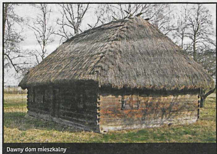
Dawny dom mieszkalny

nerała i naczelnego kapelana Powstania Styczniowego, ujętego i zamordowanego przez Rosjan w 1865 roku. Walka unitów, choć nie tak spektakularna, była bardzo długa. Gdy w 1905 roku pozwolono wybrać unitom na wybór religii między katolicyzmem a prawosławiem, większość wybrała katolicyzm. Nie dotyczyło to jednak mieszkańców Dokudowa. Ich upór trwał dalej.