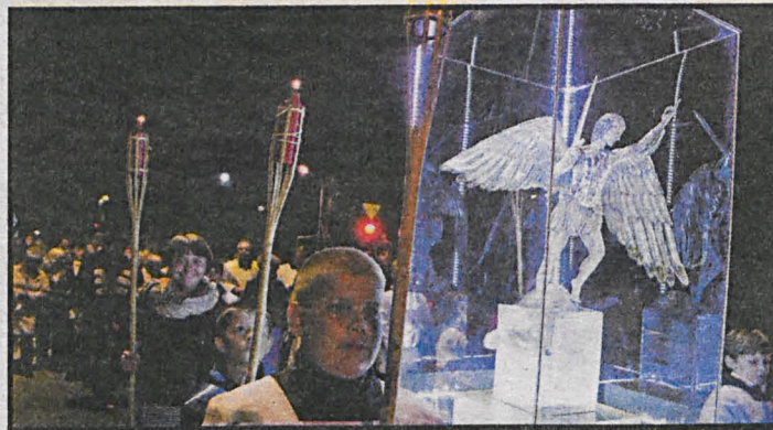
Obchody wrześniowego oficjalnego święta Białej Podlaskiej, zwłaszcza w 490. rocznicę narodzin miasta nie mogły się obyć bez złożenia na hołdu patronowi św. Michałowi Archaniołowi