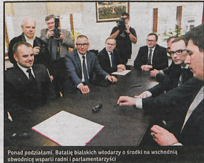
Ponad podziatami. Batalię białskich wódatarzy o środki na wschodnią obwodnicę wsparli radni i parlamentarzyści