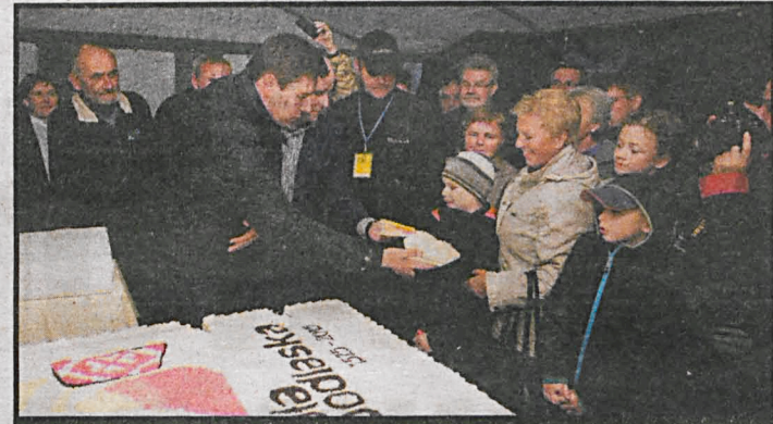
Białczanie, którzy nie przestraszyli się ulewnego deszczu, doczekali się wieczorem podwójnej nagrody. Najpierw pojawił się olbrzymi, urodzinowy tort, a potem rozeszły się ciemne chmury i przestało padać

Wileńskiej Brygady AK, zamordowanej przez UB). Białczanie, którzy mimo ulewnego deszczu stawili się na koncert mieli podwójną nagrodę. Koncert był znakomity, a w jego trakcie – przestało padać. Temperamentem estradowym impono-