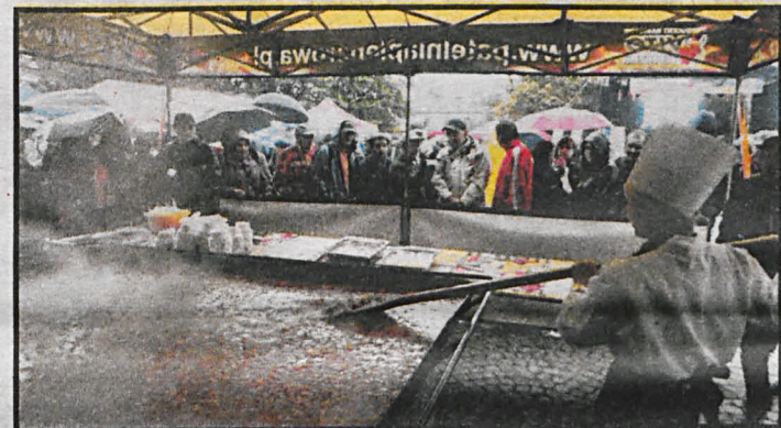
Do spróbowania gorącego forszmaku podawanego wprost z gigantycznej patelni ustawia się na Placu Wolności długa kolejka chętnych. Ufundowaną przez SKEF potrawą, którą przyrządziła trójka kucharzy, nasycili się wszyscy chętni