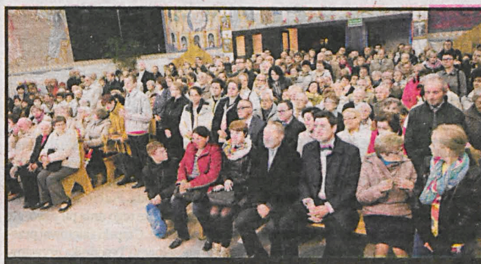
Pierwszy publiczny pokaz filmu miał miejsce tuż po premierze, w białkim kościele pw. św. Michała Archanioła