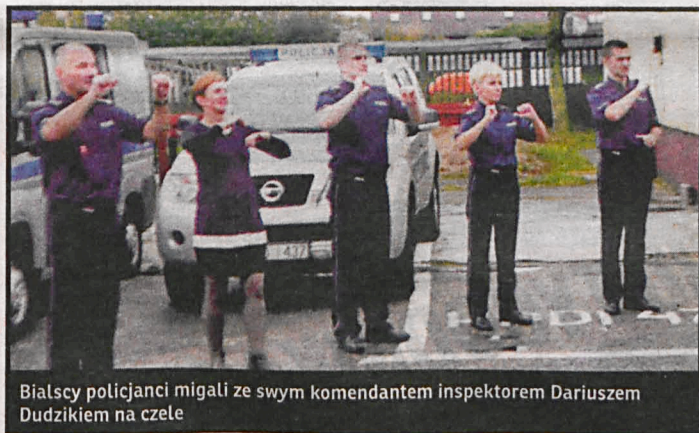
Białscy policjanci migali ze swym komendantem inspektorem Dariuszem Dudziakiem na czele