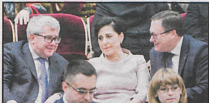
Ryszard Czarnecki po premierowym pokazie „Błogostawionej winy”: „Powstał ważny, potrzebny, a co najważniejsze dobry film o tematyce religijnej”

– Jako historyk muszę przypomnieć, że Polska podobnie jak kraje bałtyckie i kraje Grupy Wyszehradzkiej nigdy nie miała żadnych kolonii. Tymczasem państwa, które dzisiaj nas szantażują przez wieki budowały swoją potęgę ekonomiczną na wyzysku kolonialnym. Jeżeli dzisiaj historia każe im płacić odsetki od tych zysków, to jest to problem tych państw, a nie Polski. Tu objawia się hipokryzja Zachodu a także potworna słabość naszej władzy, która godzi się na wszystko, co jest zgodne z interesem