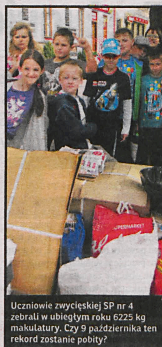
Uczniowie zwiąskiej SP nr 4 zebrali w ubiegłym roku 6225 kg makulatury. Czy 9 października ten rekord zostanie pobity?

Drobną formą rekompensaty najmłodszym za poniesiony trud będzie – jak zwykle – plac zabaw. Nie zabraknie dmuchanego zamku i zjeżdżalni, przejażdżek bryczką oraz konkursów i zabaw z Wróżką. Dla przedszkoli i szkół, które makulatury dostarczą najwięcej, przewidzieliśmy wartościowe nagrody. Do zobaczenia 9 października na Placu Wolności!