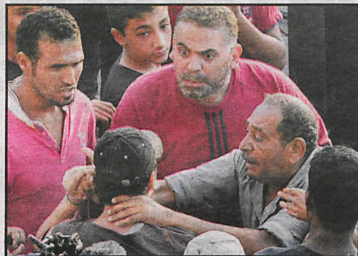
Mieszkańcy regionu obawiają się fali imigrantów i zagrożeń z tym związanych

Senator Grzegorz Bierecki jest też w kontakcie z samorządowcami z Parczewa, Radzyna Podlaskiego, Terespoła, Kłodnia czy Dębowej Kłody. Tam również