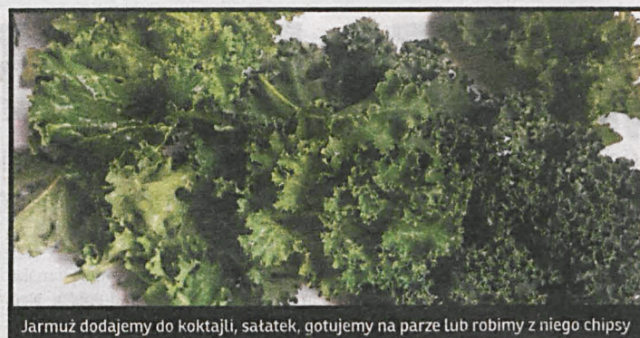
Jarmuż dodajemy do koktajli, sałatek, gotujemy na parze lub robimy z niego chipsy