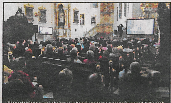
„Błogostawioną winę” obejrzało w Kodniu podczas 4 seansów ponad 1200 osób