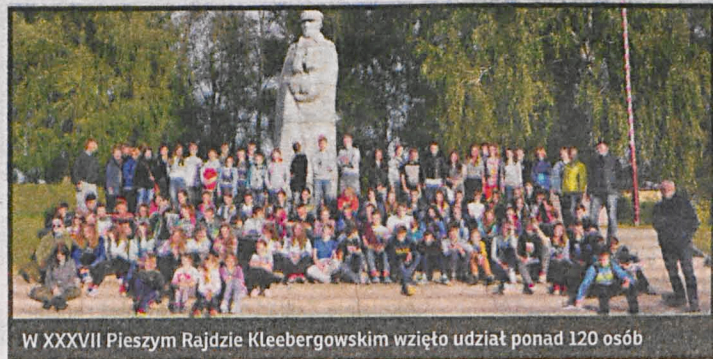
W XXXVII Pieszym Rajdzie Klebergowskim wzięło udział ponad 120 osób

W XXXVII Pieszym Rajdzie Klebergowskim, szlakiem ostatniej bitwy wojny obronnej w 1939 r pod Kockiem, Serokomlą i Wolą Głułowską wzięło udział ponad 120 osób. Rozpoczął się on złożeniem kwiatów i zapaleniem zniczy na cmentarzu wojennym w Kocku, gdzie spoczywa 81 poległych żołnierzy oraz prochy ich dowódcy, gen. Franciszka Kleberga. W trakcie dwudniowej imprezy odbywały się marsze na orientację oraz konkursy o tematyce krajoznawczej i historycznej. Tegorocznemu rajdowi patronował miesięcznik „Poznaj swój kraj”.